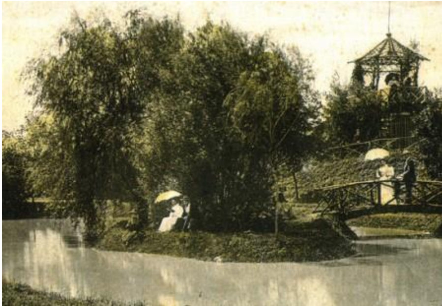
Slika 1. Jelkin brijeg s jezercem i otočićem početkom 20. stoljeća