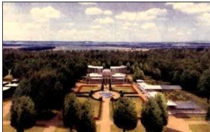
Slika 6. Zdravstveno-rekreacijski centar Lipik

Godine 1983. nakon četverogodišnje gradnje Lipik je dobio hotelski kompleks s pratećim sadržajima nazvan Zdravstveno-rekreacijski centar Lipik kojim je mogao konkurirati na domaćem i europskom tržištu. Napisano potvrđuju i statistički podatci prema kojima se broj domaćih turista udvostručio, dok je broj stranih turista porastao za 85% u odnosu na 1982. godinu. 80 Novosagrađeni hotel Lipik upotpunjen je zabavno-trgovačkim centrom, kuglanom, školom jahanja, novim kompleksom bazena, teniskim igralištima te mogućnostima lova i ribolova što je dostatno za privlačenje tisuća turista. Lipik je postao konkurentna destinacija, a ponovno su se vratili inozemni gosti, među kojima i Šveđani i Izraelci (Slika 6.). 81