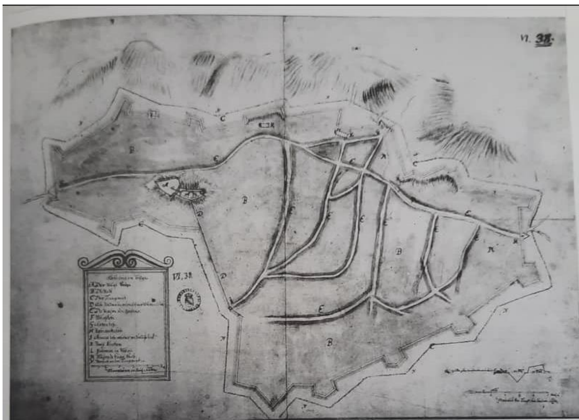
Slika 9. Tlocrt grada Požege

Prilikom promatranja tlocrta grada može se vidjeti dio urbanog područja za koje se pretpostavlja da je nekada služilo kao prostor namijenjen naseljavanju stanovništva. Na pojasu utvrde ustanovljeni su brojni lomovi i oštećenja, ali su se na mnogo mjesta mogli uočiti polubastioni i veliki dio od četiriju bastiona. 21