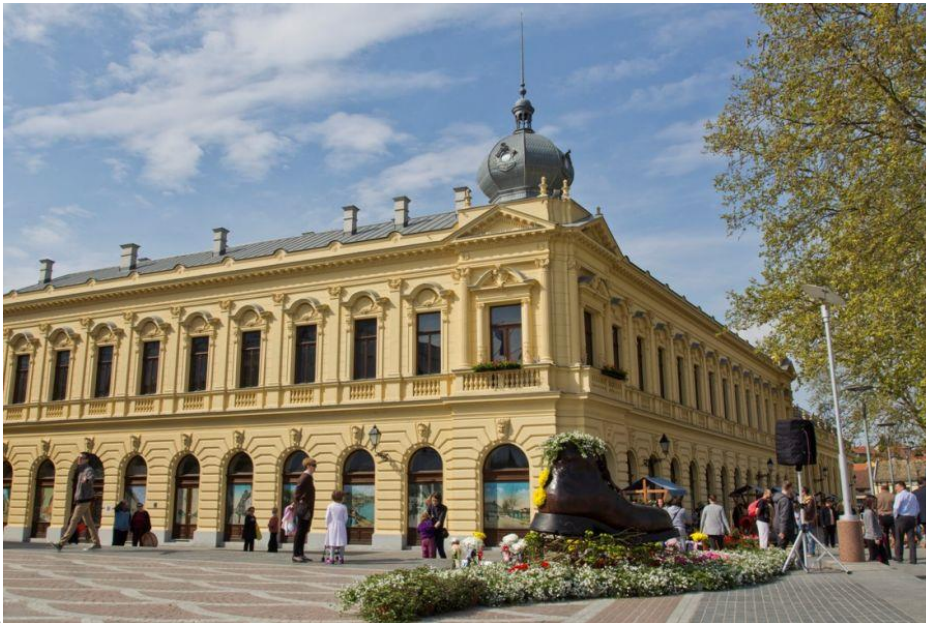
Slika 3. Grand hotel

Izrazito upečatljiva i neobična pojava za grad koji je još u fazi renoviranja i revitalizacije vrlo je poznato monumentalno djelo historicističke arhitekture, Grand hotel (sl. 4), odnosno Radnički dom . Zgradu je prema projektu poznatoga arhitekta Vladimira Nikolića gradio veleposjednik Paunović za hotel od 1895. do 1897. godine. Uz ugostiteljske sadržaje hotel je posjedovao i kazališnu dvoranu. Kako je Grand hotel 1919. godine ponovno ponuđen na prodaju, radnici osnivaju Zadrugu Radnički dom i prodajom zadružnih udjela prikupljaju sredstva, kupuju Grand hotel i pretvaraju ga u Radnički dom .