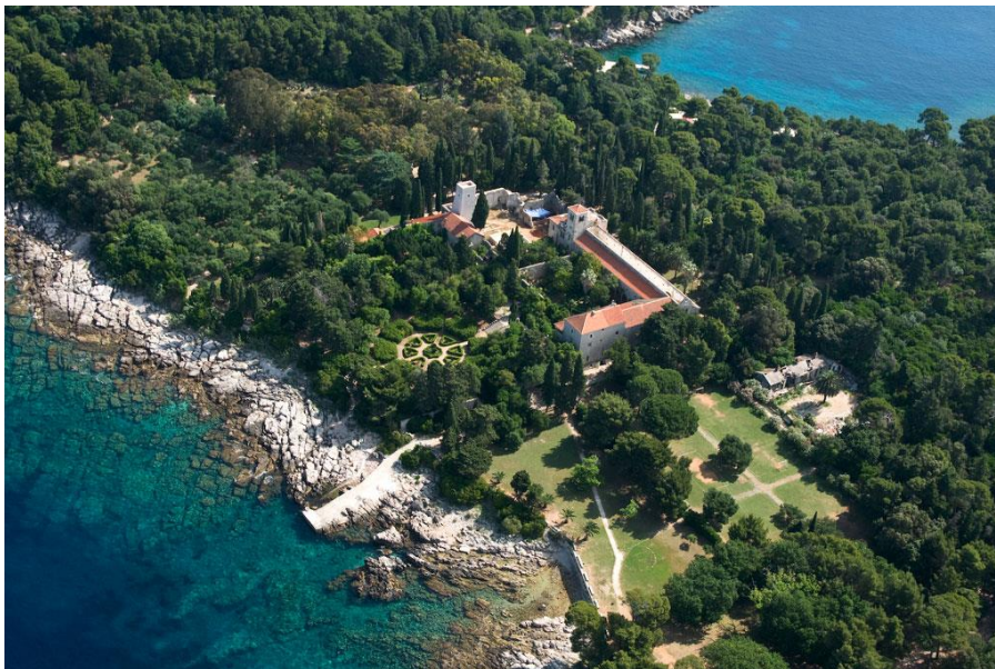
Slika 7. Benediktinski samostan

Na području Dubrovnika veliku ulogu imaju i renesansni perivoji čija posebnost proizlazi iz činjenice da su oblikovani u skladu s karakterističnim obilježjima ambijenta. U povijesti ih je bilo tristotinjak, dok ih je do danas ostalo samo nekoliko očuvanih. Razlog je tomu što ih je potrebno obnavljati prema nekadašnjemu izgledu, no, nažalost, dosljedna provedba u stvarnosti nije moguća. Upravo zbog toga mnogi su perivoji i ljetnikovci svedeni na arheološka nalazišta te su pregrađivani, napušteni i degradirani. 12