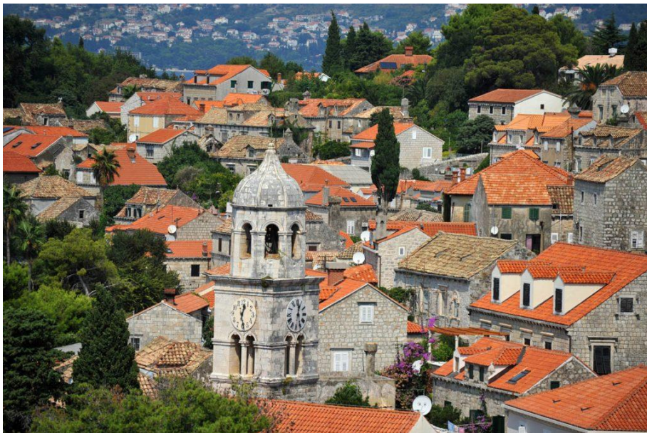
Slika 6. Grad Cavtat

Sljedeća značajna građevina, koja ujedno nosi i titulu spomenika kulture, jest kuća Vlaha Bukovca. Karakteriziraju je oslikani unutrašnji dijelovi zidova, a smatra se jednom od većih atraktivnosti u gradu. Vrlo vrijedan spomenik iz razdoblja renesanse jesu i Kneževi dvori, koji danas služe kao knjižnica te arhiv poznatoga doktora filozofije Baltazara Bogišića. 11