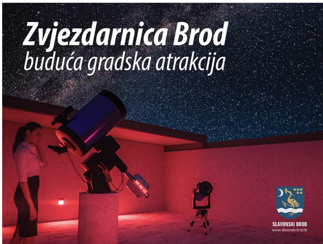
Slika 17. Prikaz buduće zvjezdarnice Slavonskoga Broda

Projektom se omogućava brodskom astronomskom društvu još bolji i kvalitetniji pogled k nebu, prema proučavanju i promatranju zvijezda, dok se stanovnicima grada pruža atraktivni doživljaj gradskog neba (sl. 17). Zvjezdarnica će imati pomični krov te tri terenska teleskopa, kako bi se posjetiteljima omogućio poseban doživljaj. 28