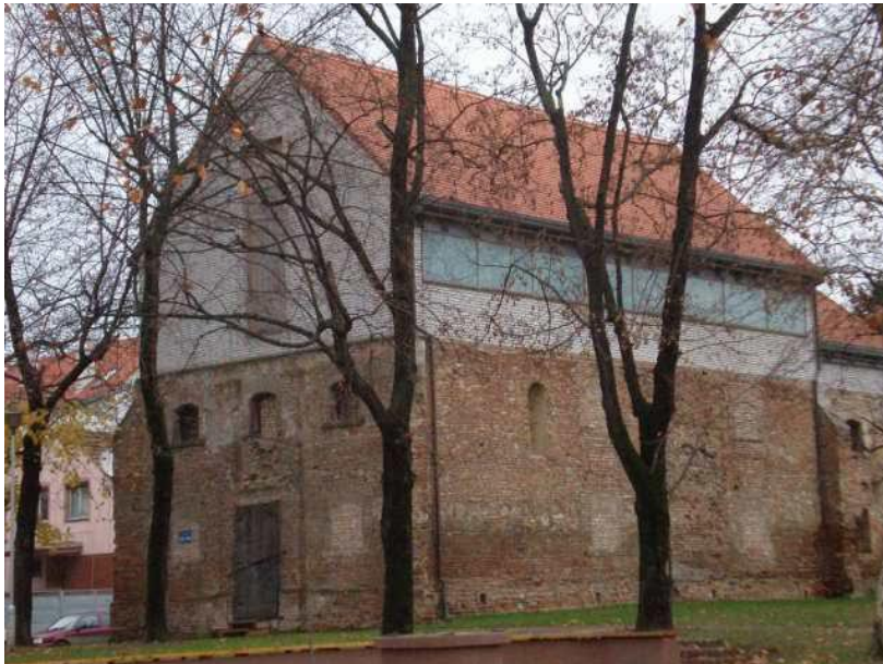
Slika 2. Gotička crkva svetoga Ilije na Meraji

Vinkovačku starogradsku jezgru karakterizira barokni stil gradnje, koji prevladava na središnjem trgu grada. Šetnjom kroz staru gradsku jezgru najviše se ističe središnji trg nazvan Trg bana Josipa Šokčevića. U središtu trga nalazi se poznati spomenik Svetoga Trojstva. U tom dijelu grada je i crkva sv. Euzebija i Poliona, koja je također izgrađena u baroknom stilu te izaziva interes mnogih posjetitelja. Na trgu se nalazi i gradski park koji je nastao 1868. godine. Okružuju ga velike zgrade, od kojih je jedna posebno poznata. Riječ je o zgradi Brodske imovne općine koja odiše secesijskim stilom gradnje. Ugao zgrade poznat je po tome što se upravo ondje nalazi spomen-ploča Josipu Runjaninu, skladatelju hrvatske himne. U okolici parka nalazi se gotička crkva svetoga Ilije na Meraji, koja je jedan od najvažnijih spomenika (sl. 2). 3