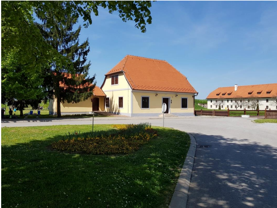
Slika 14. Prikaz Kapelanova stana

Zgrada Kapelanova stana izmijenjena je i dograđena, kako bi mogla poslužiti suvremenoj svrsi (sl. 14). Isprva se ondje nalazio ured Turističke zajednice grada Slavenskog Broda, a danas taj prostor koristi ugostiteljski objekt.