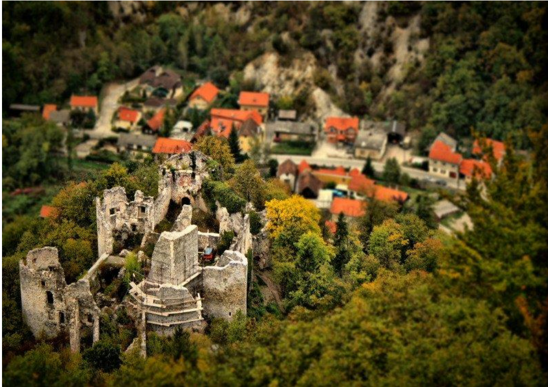
Slika 10. Stari grad Samobor