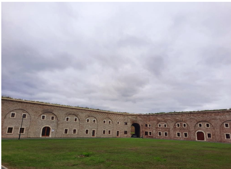
Slika 15. Revitalizirani dio kavalira

meta napada neprijateljske vojske. Upravo je izgradnja kavalira nastojala reducirati mnoge nedostatke ranije gradnje, koji su se najviše očitovali u manjku skladišta i skloništa za vrijeme napada (sl. 15 i 16). 27