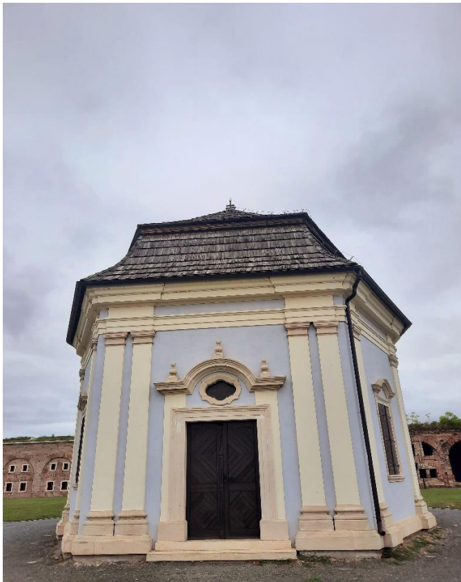
Slika 12. Kapelica svete Ane

Akcijski plan razvoja turizma u Slavonskom Brodu uključio je i kapelicu svete Ane (sl. 12) koja se nalazi u samom središtu tvrđave, a čija se površina želi obogatiti sadnjom drveća. Projekt je još na čekanju te se ubrzo očekuje njegova konačna realizacija.