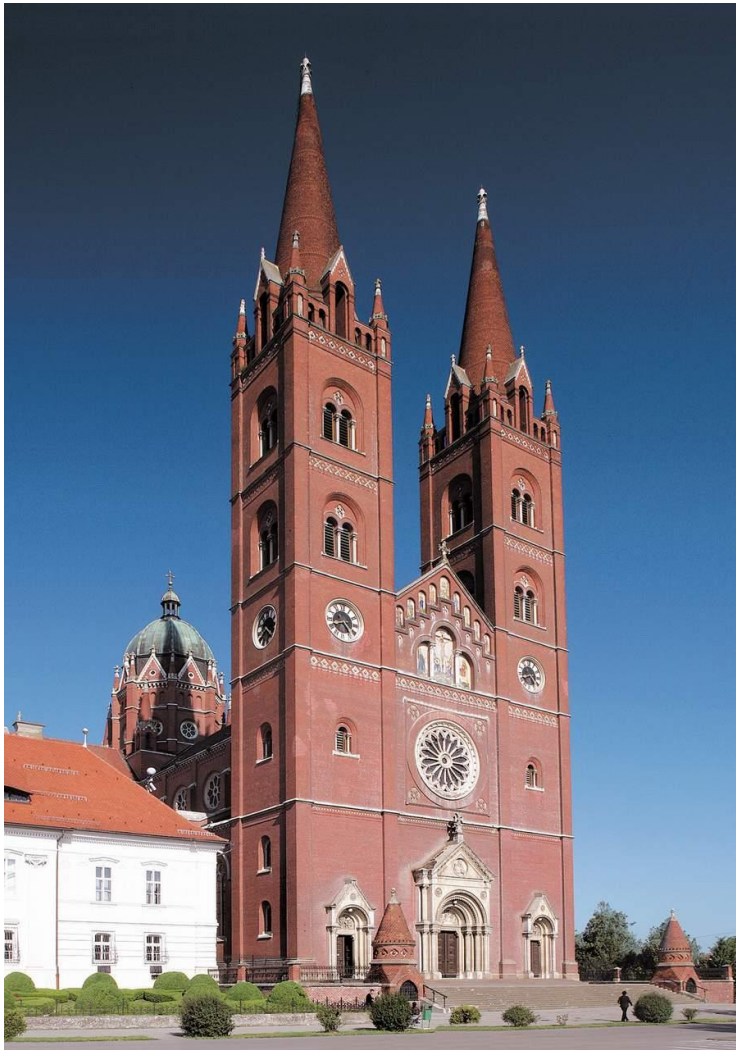
Slika 1. Katedrala svetoga Petra u Đakovu

Europi, na kojem se posebno ističe katedrala svetog Petra (sl. 1). U doba biskupa Krtice bio je izrađen prvi projekt za katedralu, a u vrijeme biskupa Mandića čak dva projekta. Nažalost, nijedan od projekata nije zaživio sve dok na Mandićevo mjesto nije došao Josip Juraj Strossmayer. Biskup J. J. Strossmayer odmah je nakon stupanja na čelo Đakovačke biskupije započeo proces izgradnje katedrale, naručivši novi projekt, jer mu tadašnja katedrala, koju je dao izgraditi biskup Đuro Patačić u 18. stoljeću, nakon oslobađanja od Osmanlija, nije odgovarala. 2