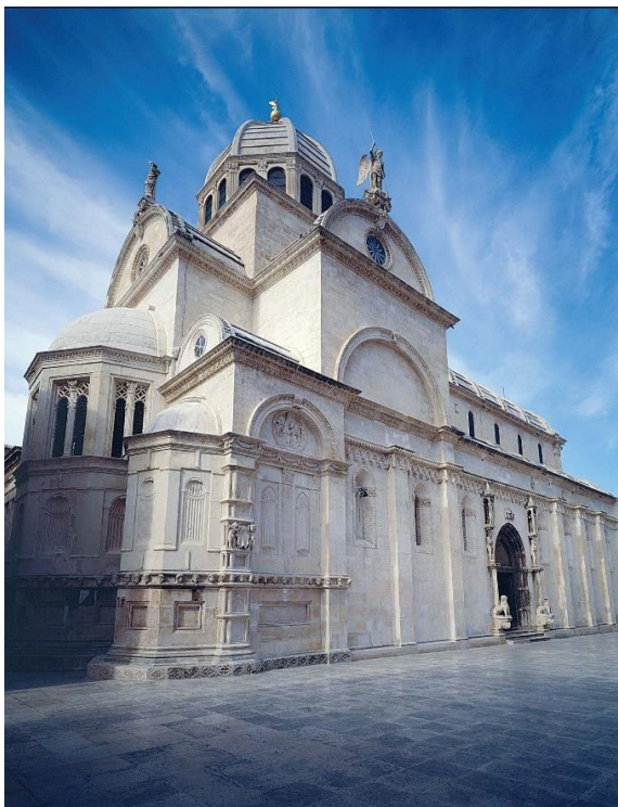
Slika 5. Katedrala svetoga Jakova u Šibeniku

Kad je riječ o graditeljskoj baštini, posebno se ističu fortifikacije i katedrala svetoga Jakova, čijoj gradnji je sudjelovao već spomenuti kipar Juraj Dalmatinac te sagradio neke od najljepših dijelova katedrale, tri apside, stupove s kapitelima te sakristiju i krstionicu. 9 Od staroga dijela grada ističu se i biskupska palača sagrađena u 15. stoljeću u gotičkom stilu, u čijem se dvorištu nalazi veliki kip svetog Mihovila – simbol zaštitnika grada (sl. 5). 10