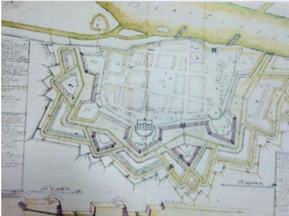
Slika 8. Projektni plan gradnje nove utvrde 1715. godine

Početak 18. stoljeća obilježila je gradnja nove utvrde, koja se nalazila na drugoj strani rijeke Drave i koja je bila zabilježena samo na posebnim nacrtima (sl. 8). Utvrda je bila iznimno velika, što dokazuje i činjenica da su se na uglovima nalazili polubastioni te veliki šanac. 17