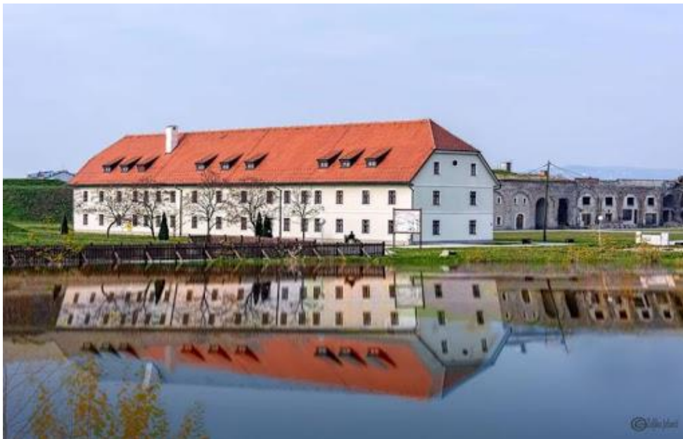
Slika 13. Današnji izgled Klasične gimnazije fra Marijana Lanosovića s pravom javnosti

Obnova tvrđave Brod kao kulturnoga dobra od nacionalnoga značenja počela je 1995., kada je grad preuzeo tvrđavu od Ministarstva obrane. Prve su obnovljene zgrade slavonske vojarne, današnje Klasična gimnazija fra Marijana Lanosovića s pravom javnosti (sl. 13). Zgrada Klasične gimnazije, tadašnje vojarne, relativno je dobro očuvana. Projekt obnove rađen je u smislu izgradnje eko-škole, prilikom čega su bili korišteni isključivo prirodni materijali. Stropovi su izgrađeni od velikih drvenih greda, obnovljenih uglavnom izvornom opekrom baroknoga formata, jer je u okolini bilo dovoljno takvoga materijala koji se kvalitetno mogao iskoristiti. Popločenje ispred ulaza napravljeno je od šiploškoga kamena, koji je bio sastavni dio tvrđave. Potkrovlje je pretvoreno u polivalentni prostor s velikom gimnastičkom dvoranom.