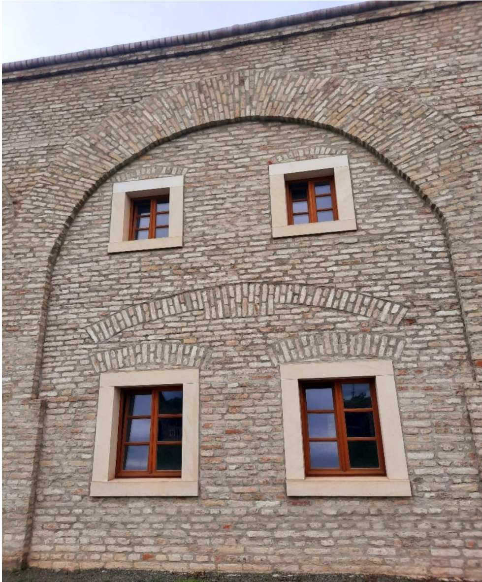
Slika 16. Dio obnovljenoga dijela kavalira