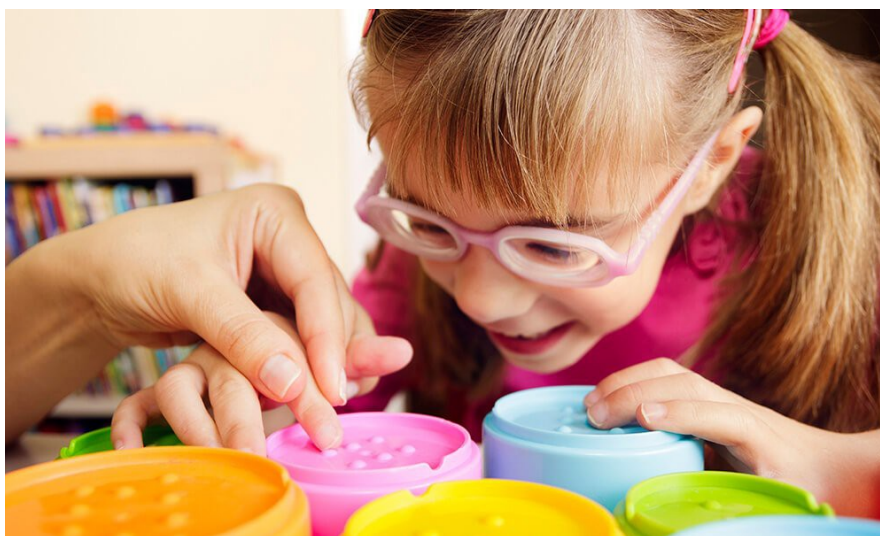
Slika 3. Slabovidno dijete i odgajatelj

Vrlo je bitna odgojiteljeva sposobnost, način ponašanja i sam odnos prema djetetu. Zapravo svako dijete, pa i dijete s oštećenjima vida treba promatrati kao individuum i odgajati ga u skladu s njegovim interesima i sposobnostima. Odgoj ovakvog djeteta zajednička je briga ne samo odgajatelja već i roditelja koji su zajedno s djetetom aktivni čimbenici u odgoju (Slika 3).