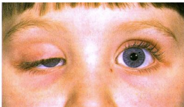
Slika 2. Ptoza kod djece https://hr-m.iliveok.com/health/ptoza-u-djece_108123i15936.html