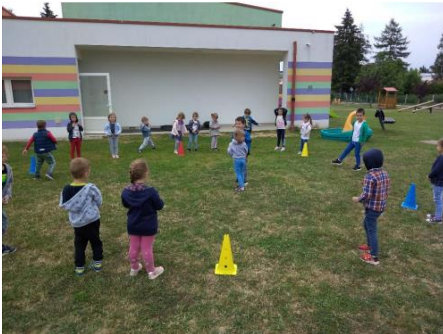
Slika 3. Igra čarobnjaka i kipova