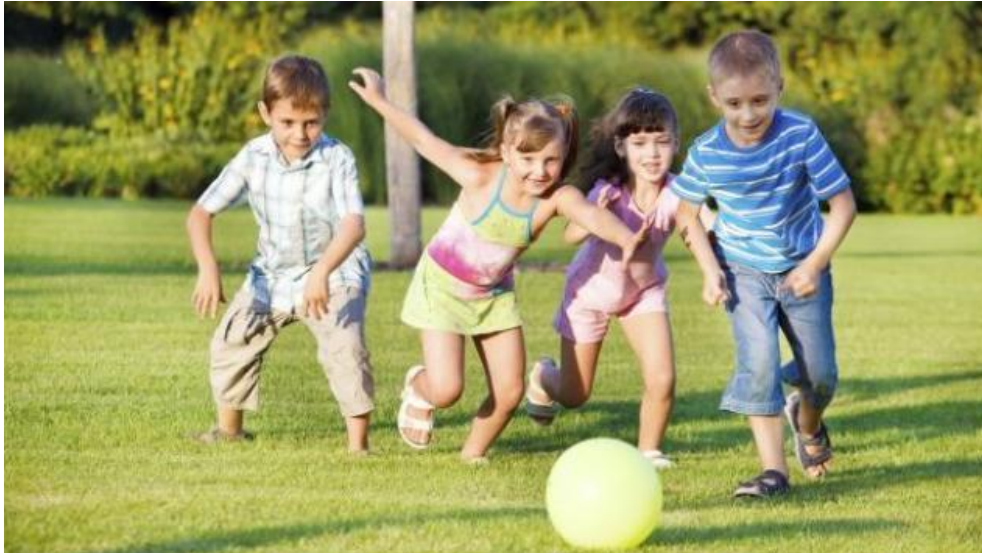
Slika 1. Dječja igra na svježem zraku