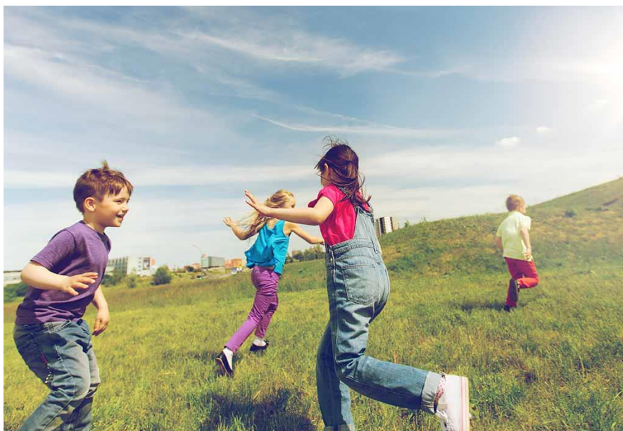
Slika 5. Sjena