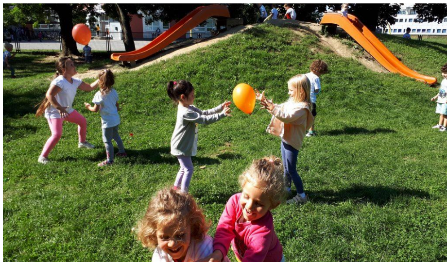
Slika 4. Igra baloni u zraku

Odgajatelj svakom djetetu dodjeljuje balon te objašnjava pravila igre. Cilj igre je zadržati balon u zraku duže od ostatka djece. Igra se odvija u kontroliranim uvjetima na otvorenom prostoru (travi ili igralištu). Dijete kojem balon padne ispada iz igre. Igra se igra dok ne ostane samo jedno dijete s balonom. Igru je moguće igrati i u parovima, kao što je prikazano na Slici 4 .