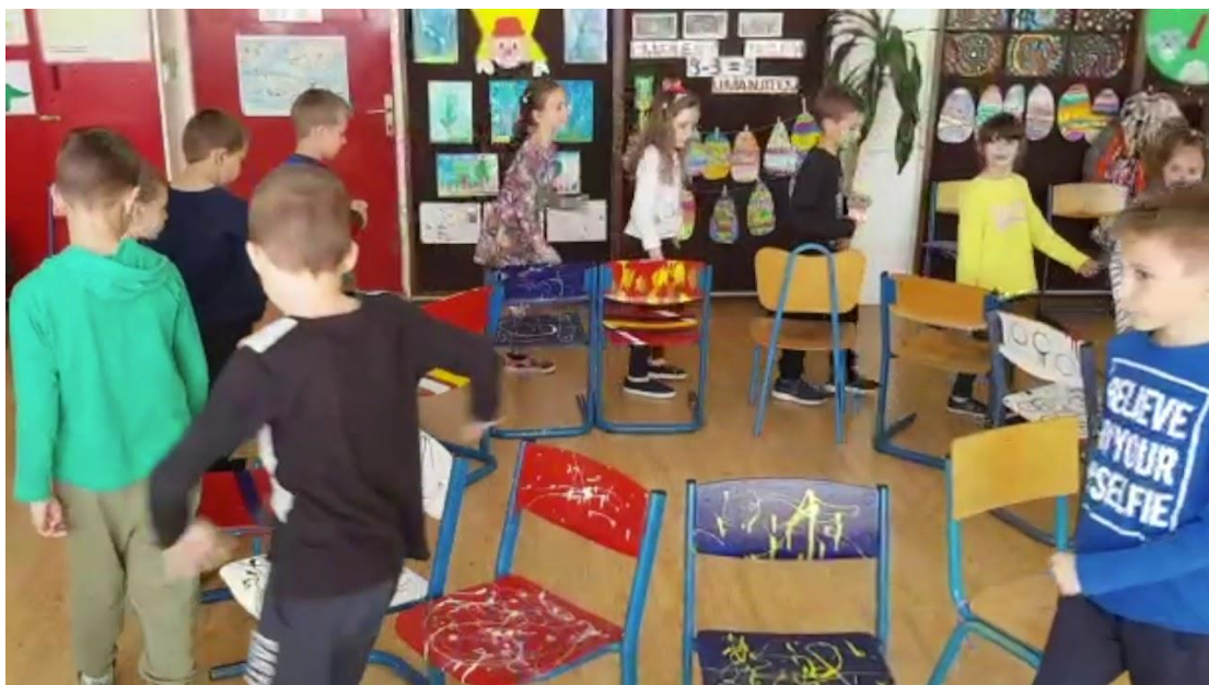
Slika 7. Glazbena stolica