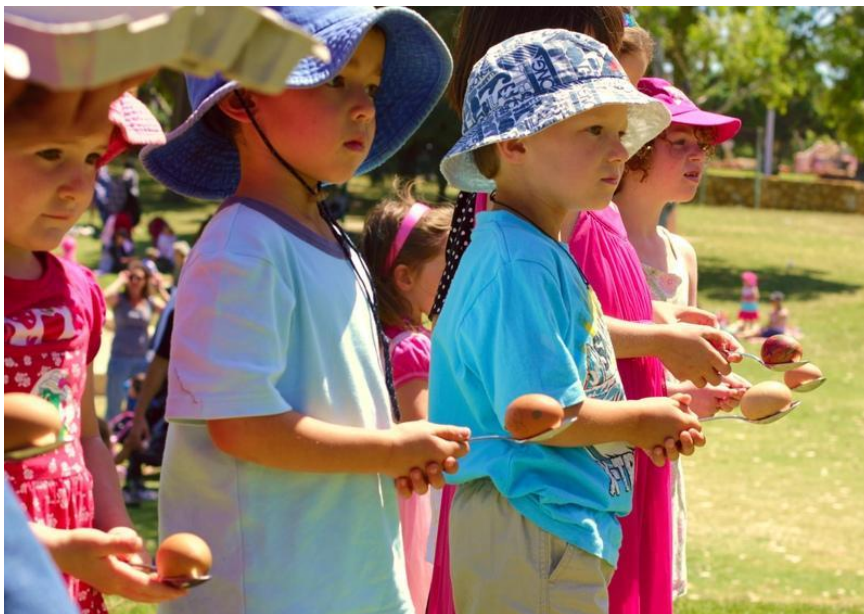
Slika 8. Jaje na žlici

Postoje i druge varijante ove igre. Npr. igru je moguće igrati na otvorenom prostoru na travi. U tom slučaju jaja ne trebaju biti kuhana. Igra se može igrati i na način da se jaje postavi na žlicu te da se djeca utrkuju (slika 8). Cilj je doći do cilja a da jaje pritom ne padne iz žlice. Igru je moguće igrati i timski. Odgajatelj djecu dijeli u dva tima. Polovica svakog tima treba biti na početku, a druga na cilju. Dijete mora doći do suigrača na cilju i predati žlicu na kojoj se nalazi jaje. Taj se član vraća na početak, a ukoliko jaje padne, igrač se vraća na početak. Pobjednik je ekipa iz koje se svi članovi prvi vrate na cilj.