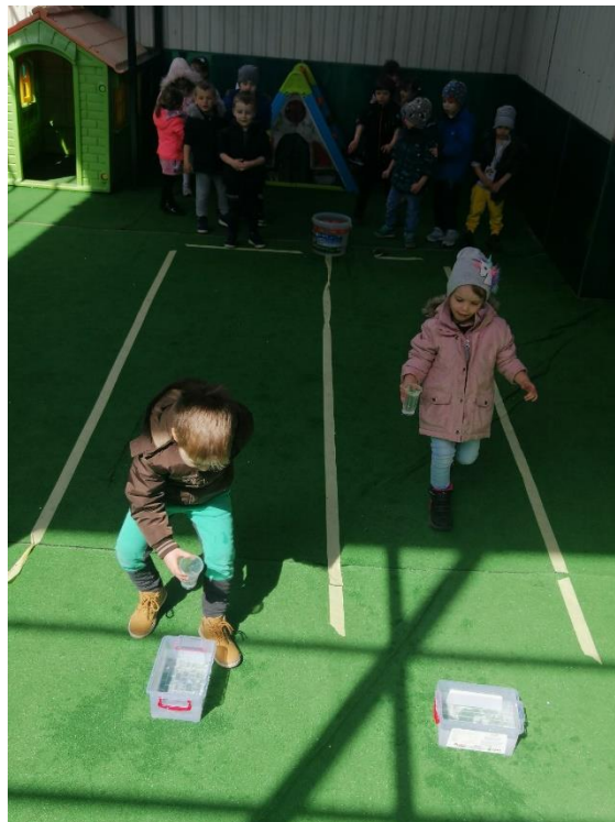
Slika 6. Tko će prije napuniti posudu vodom

Ovu igru prikladnije je igrati na otvorenom prostoru, no moguće ju je igrati i u zatvorenom prostoru, kao što to pokazuje Slika 6 . Odgajatelj treba označiti teren za igru. Za igru su potrebne plastične čaše, kanta s vodom te posuda koju je potrebno napuniti vodom. Odgajatelj djecu dijeli u dvije skupine te svakom djetetu daje po jednu plastičnu čašu. Zadatak je čašom zagrabit vodu iz kante te ju potom odnijeti do posude i izliti. Pobjednik je ekipa koja prva napuni posudu vodom.