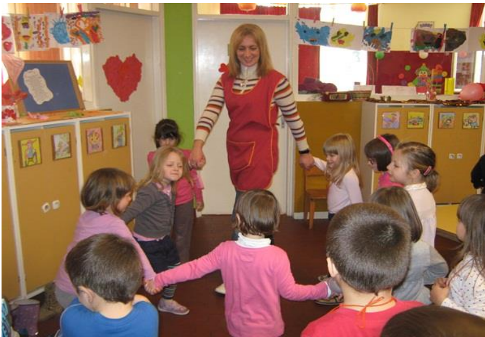
Slika 9. Odgajatelj kao paralelni suigrač