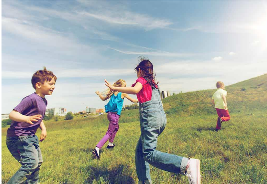
Slika 5. Sjena