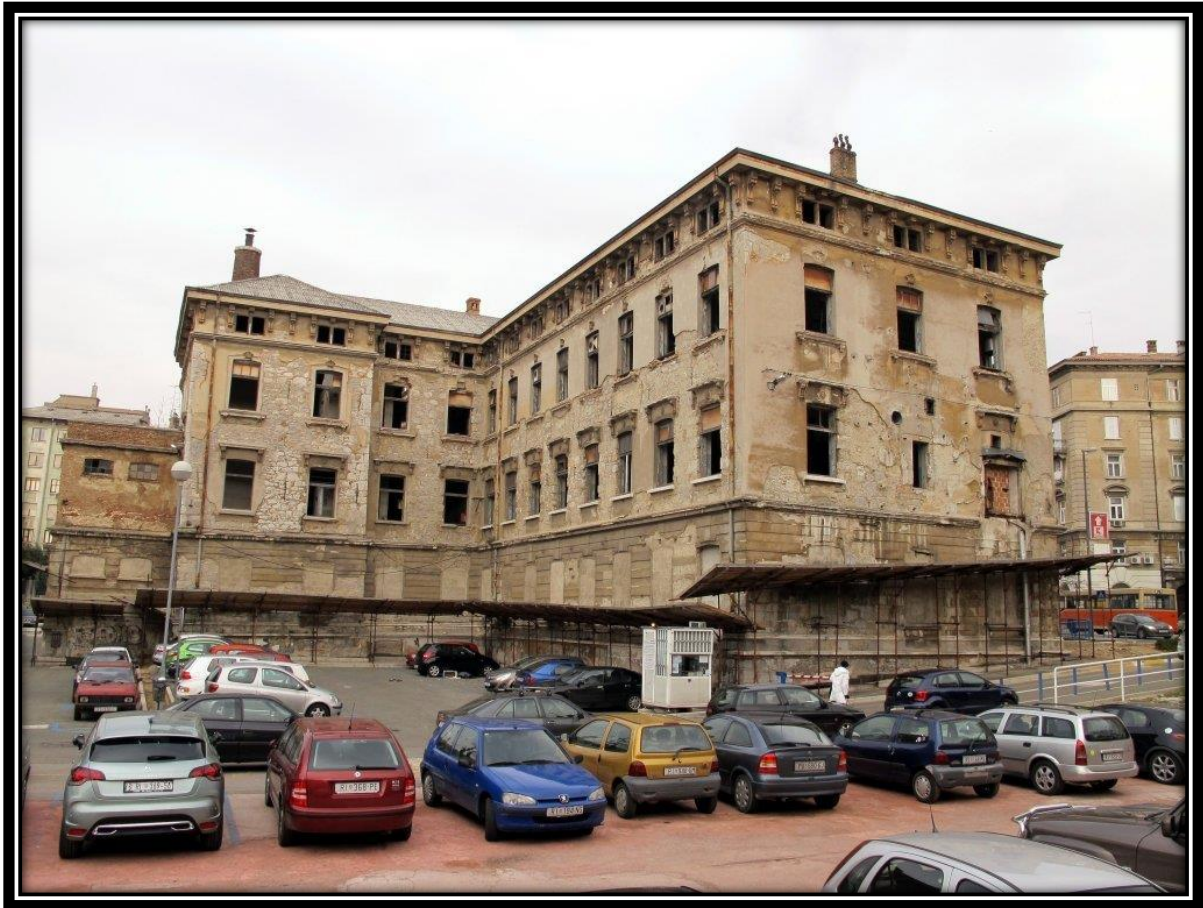
Slika 2 Bivša tvornica Rikard Benčić

trajne baštine, od kojih se ističu jedanaest stalnih umjetničkih instalacija i skulptura na otvorenom, na obali i na otocima na području Kvarnera. 95