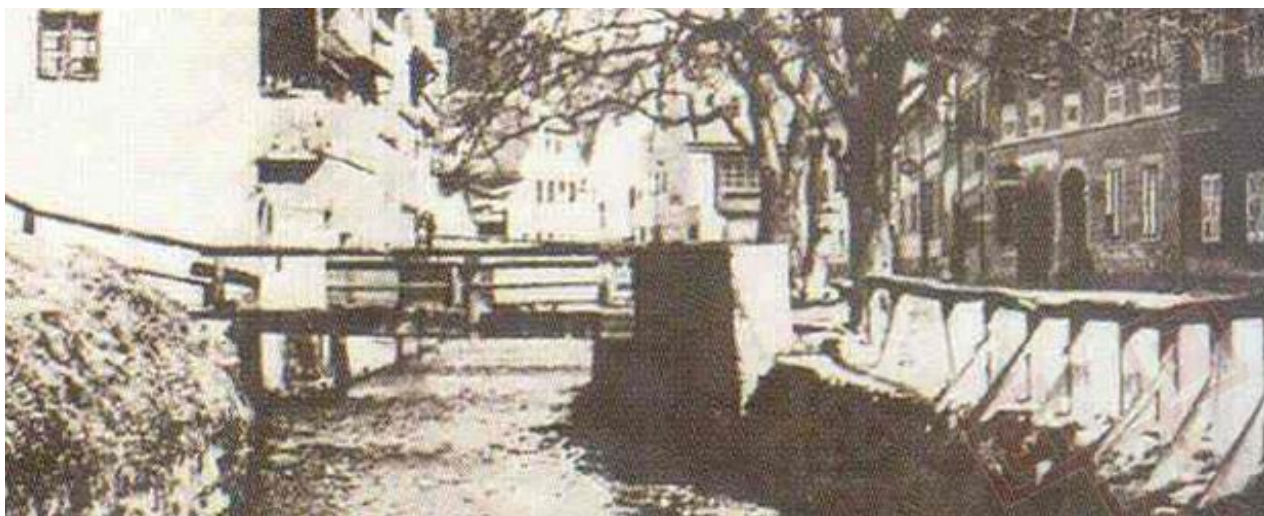
Sl. 19. Pisani most, prijelaz preko potoka Medveščak