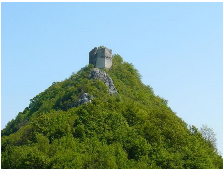
Sl. 18. Stari grad Okić