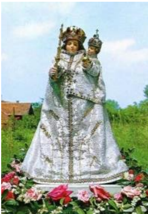
Sl. 13. Majka Božja Molvarska