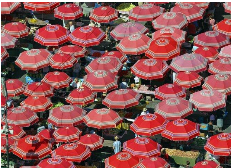
Sl. 21. Šestinski kišobran na tržnici Dolac