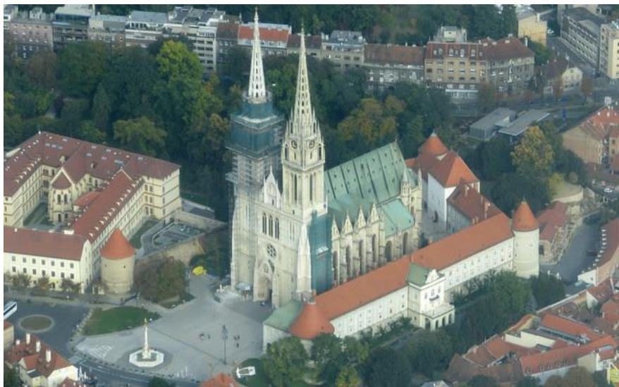
Sl. 11. Katedrala Uznesenja Blažene Djevice Marija i svetih Stjepana i Ladislava