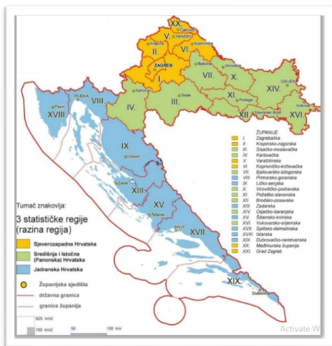
Sl. 4. Nacionalna klasifikacija prostornih jedinica za statistiku – NUTS 2