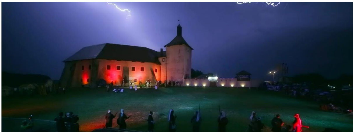
Sl. 12. Uprizorenje legende o Picokima