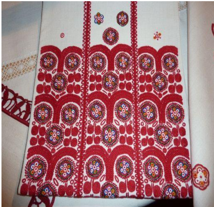
Sl. 5. Ivanečki vez