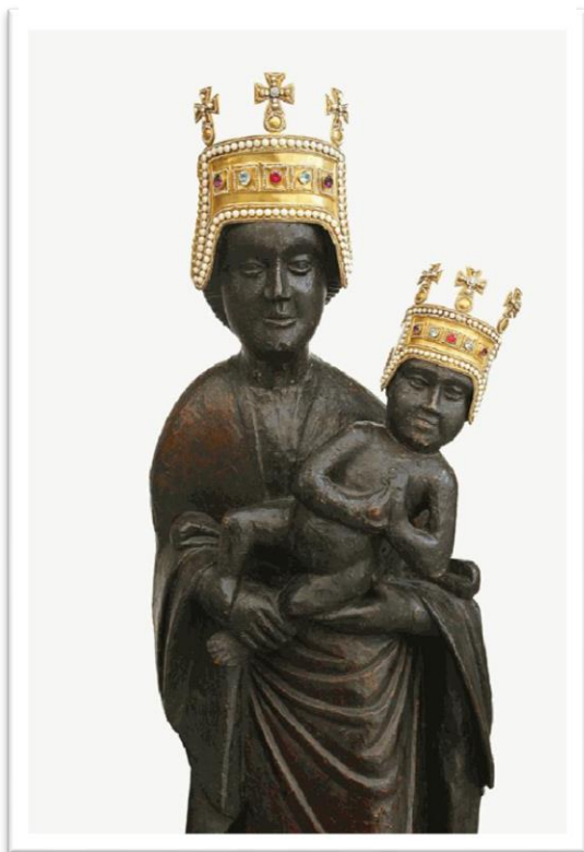
Sl. 16. Kip Majke Božje Bistričke