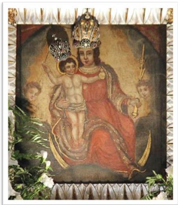
Sl. 20. Majka Božja s Kamenitih vrata