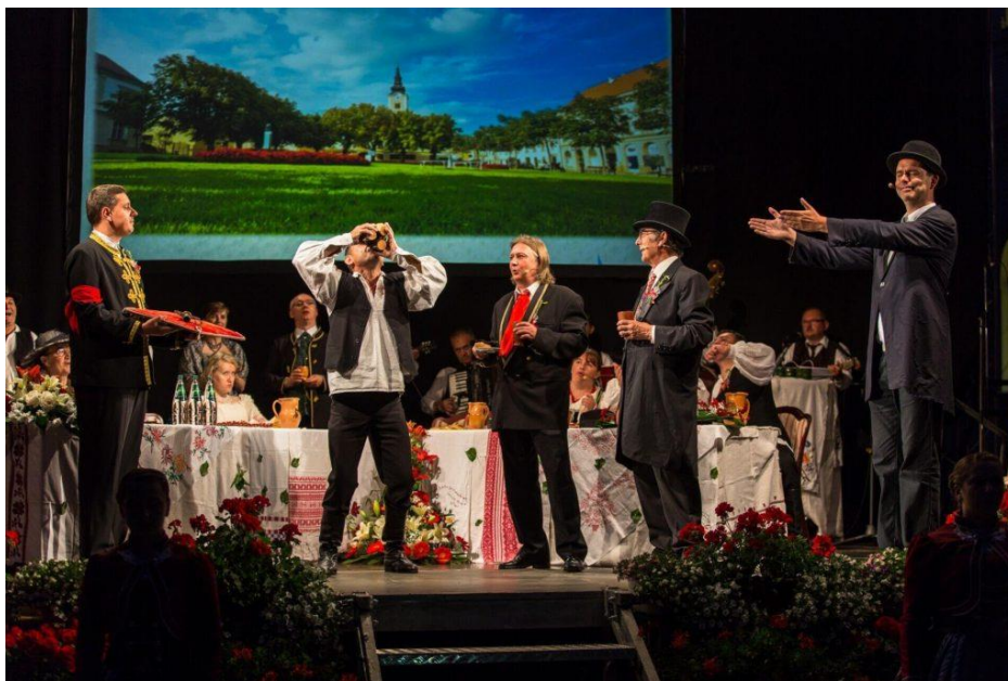
Sl. 14. Uprizorenje Križevačkih štatuta