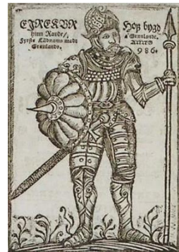
Slika 1. Eirik Raudi

Eirik Raudi (Erik Crveni) istraživao je Grenland od 981. do 984., te mu je odlučio dati ime. Smatra se da mu je dao ime koje znači zelena