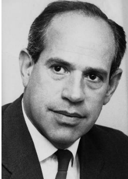
Slika 6. Verner Goldschmidt

procesa preobrazbe u kojem je kolonijalna država igrala značajnu ulogu. Komisija je izdala izvješće koje je podcijenilo želju vodećih Grenlandčana za modernim zakonom i redom. Zbog njihovog izvješća prijedlog Berthelsenova kaznenog zakona ponovno je odbijen 1950. 128