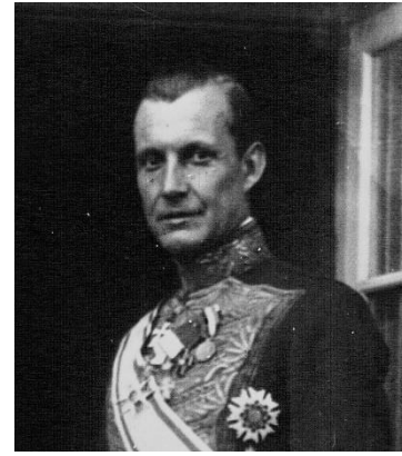
Slika 7- Henrik Kaufmann

Na prvu godišnjicu njemačke okupacije Danske, Henrik Kaufmann potpisao je sporazum s SAD-om o obrani Grenlanda. Henrik Kaufmann (1888.-1963.) 141 bio je samoprozvani zastupnik danske vlade te je taj sporazum odobrio bez prethodne suglasnosti danskog Ministarstva vanjskih poslova u Kopenhagenu. Vlasti u Kopenhagenu nisu se slagale s tim sporazumom; službenim su dopisom opozvali Kaufmanna te su izdali nalog za njegovo uhićenje i optužen je za izdaju. Danska je vodila politiku neutralnosti koju je namjeravala nastaviti poslije rata, a ovaj sporazum bio je suprotan toj politici. Grenlandski guverneri su shvatili da im taj sporazum pruža zaštitu, kao i mogućnost dobivanja namirnica koje trenutno nisu mogli dobiti iz Danske. Imali su vrlo malo vremena za odlučivanje, što im je smetalo, ali su pristali i potpisali Kaufmannov sporazum koji vrijedi „dok se ne postigne suglasnost da su trenutne opasnosti miru i sigurnosti na američkom kontinentu prošli“. Najesen iste godine, Kaufmann je dobio pravo upravljanje blokiranom danskom imovinom u SAD-u od tamošnjega State Departmenta, a nakon rata postaje ministar bez portfelja u oslobodilačkoj vladi Danske. 142