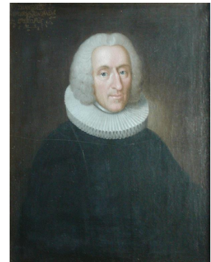
Slika 5. Hans Egede

Hans Egede bio je luteranski svećenik iz Norveške koji je išao na Grenland 1721., s ciljem prosvjetljivanja Norsa koji su ostali pod 'tamom katoličanstva'. Naravno, nije našao Norse, no dok ih je tražio preobraćivao je 'divlju' populaciju na koju je naišao. 84 On i njegov sin (koji ga je naslijedio 1736.) proučavali su inuitski jezik te objavili prvu inuitsku gramatiku i prvi rječnik. 85 No, Egede je uglavnom gledao na Inuite s prezirom; smatrao ih je 'defektivnom verzijom zapadnjaka', glupima i bez emocija. Mislio je da nisu sposobni posjedovati bogati unutarnji život. Njihove šamane je smatrao lažljivcima koji iskorištavaju lakovjernost naroda. Međutim, hvalio je njihovu socijalnu usklađenost i njihov skladan odgoj djece. Njegovo viđenje tih domorodaca nije se razlikovalo od općeg zapadnjačkog viđenja bilo kojih domorodaca u to vrijeme. Kroz 18. stoljeće, viđenje Inuita se mijenja u nešto više od snishodljivosti i tolerancije, dok će u 19. stoljeću dobiti jedan