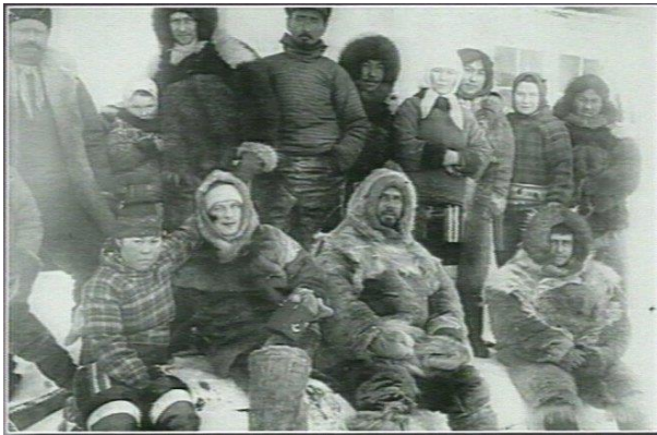
Slika 4. Članovi ekspedicije sjeverozapadnog Grenlanda Mylius-Erichsena, 1903.

Ludwig Mylius-Erichsen je najprije poveo ekspediciju na sjeverozapadni Grenland, 1902.-1904. Zatim je osmislio novu ekspediciju na sjeveroistočni Grenland, za 1906.-1908.