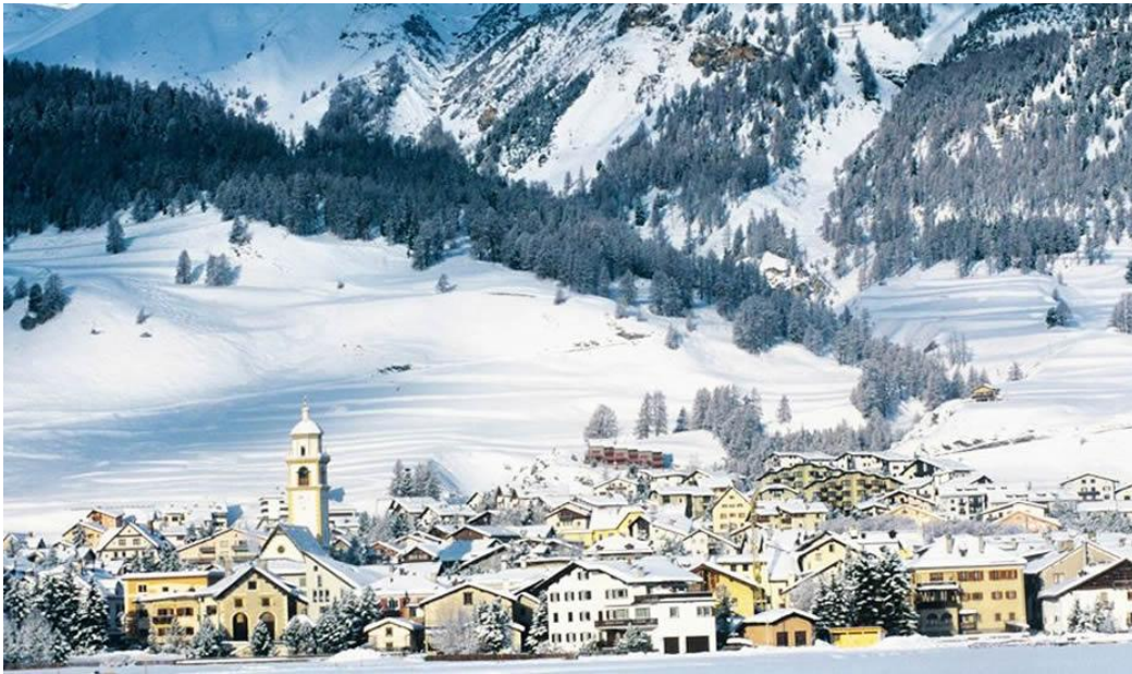
Slika 8: Skijalište Corviglia