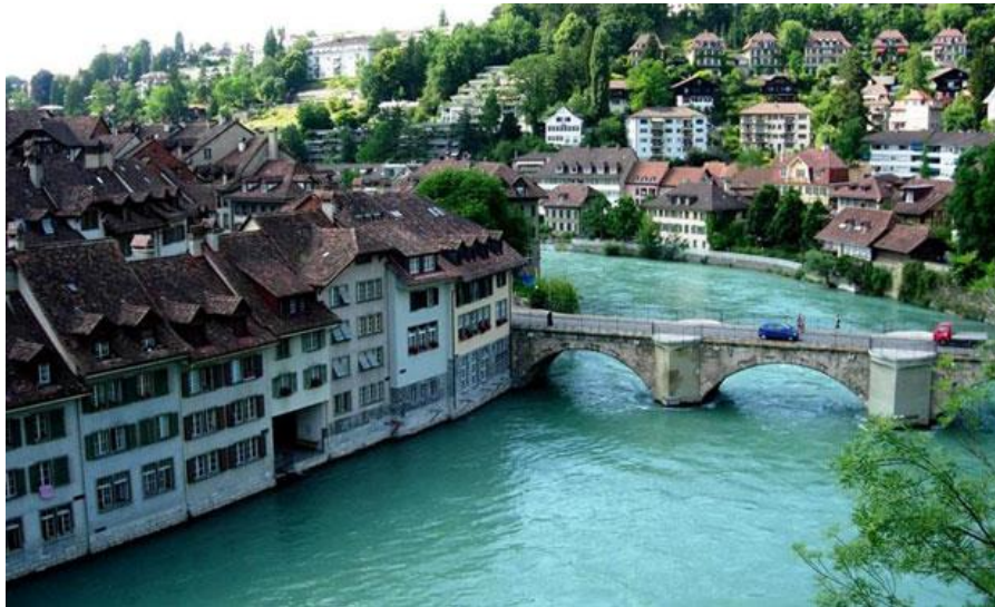
Slika 3: Stari grad