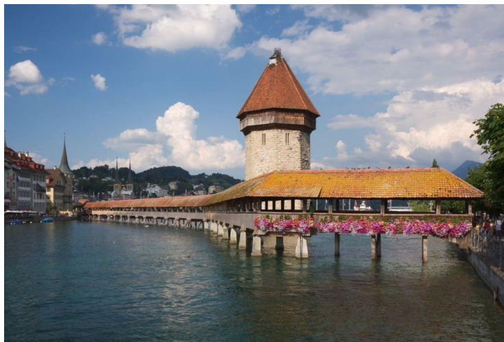
Slika 7: Najstariji Drveni most