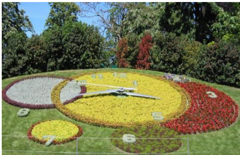
Slika 4: “Engleski vrt“