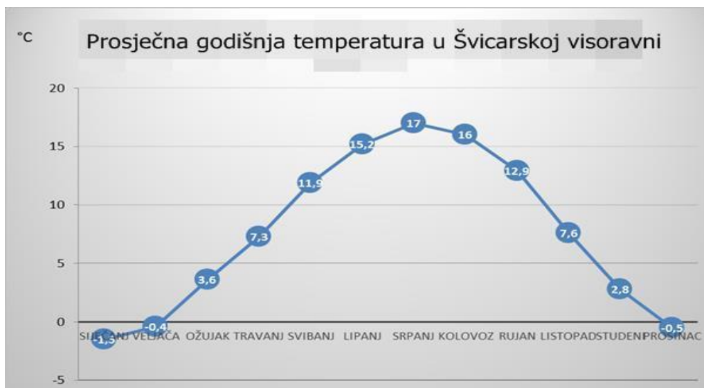
Grafikon 1: Prosječna temperatura Švicarske visoravni