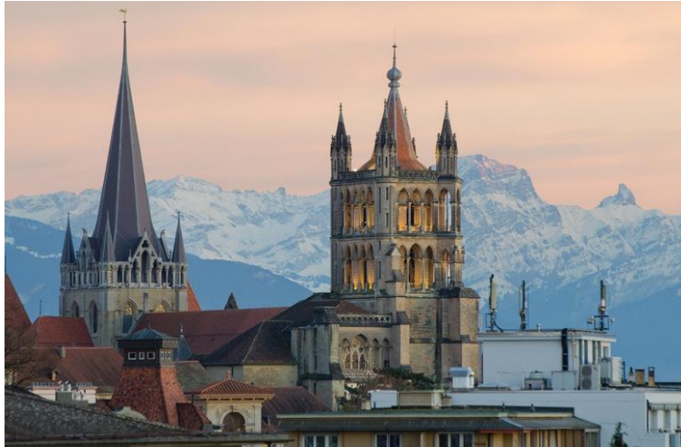
Slika 6: Cathedrale de Lausanne

Izvor: http://www.weather-forecast.com/locations/Lausanne/photos/18790 (24.08.2016.)