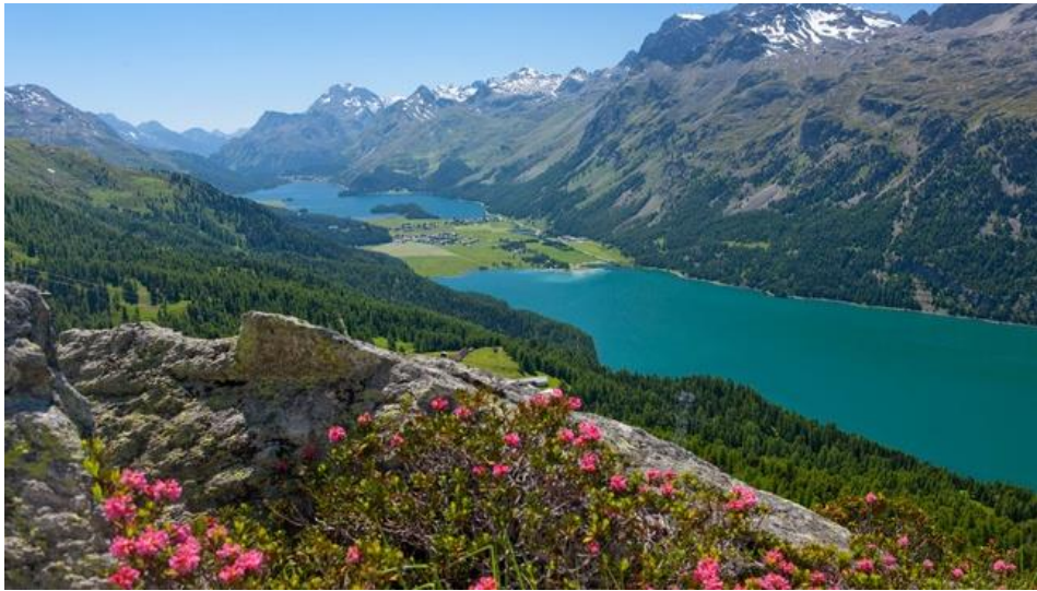
Slika 2: Nacionalni park Engadin