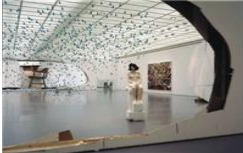
Slika 5: Galerija Kunsthaus