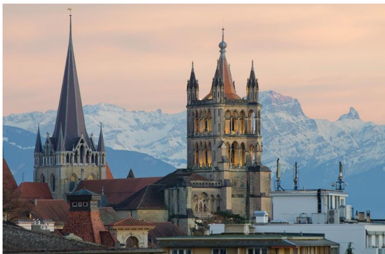
Slika 6: Cathedrale de Lausanne