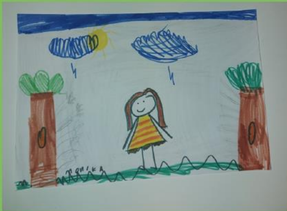
Primjer 5. Djevojčica (6 god. 1 mj.) Djevojčica u šetnji šumom, tehnika: flomaster, format A4, 2022., DV Kostrena, skupina "Bubamare".

JEDNOM DAVNO, DJEVOJČICA ANI ŠETALA JE ŠUMOM. SUNCE JOJ JE GRIJALO OBRAZE, KAD NEGDJE DALJE U ŠUMI UOČI DIKOBRAZE.