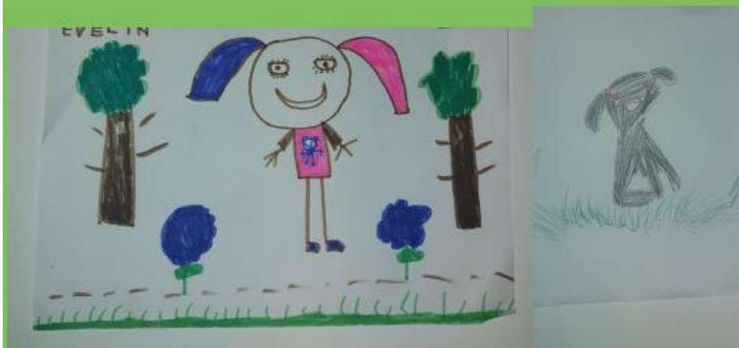
Primjer 6. Crtež lijevo: Djevojčica (6 god., 3 mj.), Djevojčica traži prijatelja, tehnika: flomaster. Crtež desno: Dječak (6 god) Psić u travi, tehnika: olovka u boji, format A4, 2022., DV Kostrena, skupina "Bubamare". Fotografirala: Lea Bašić

STADE SA STRANE, KRAJ JEDNE STARE BUKOVE KLADE KAD UOČI U KLUPKU TRAVE MALO KRZNENO ČUDO ČIJE SE OČI SJAJE.