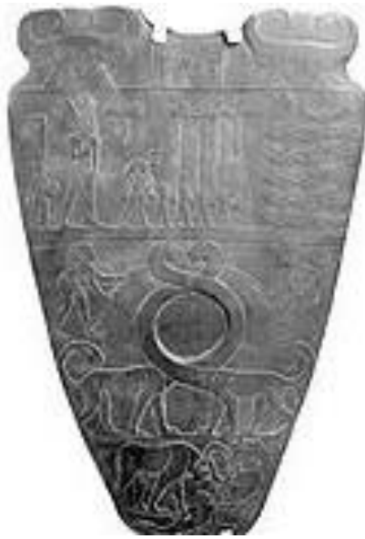
Primjer 1. Olovna ploča korištena u starom Egiptu