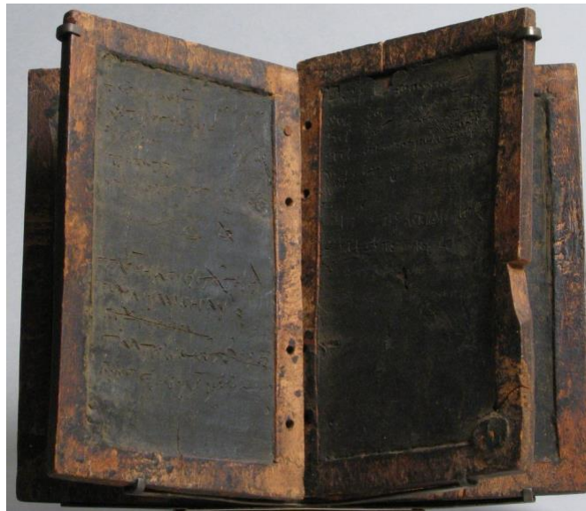
Primjer 2. Voštana ploča korištena u starom Rimu