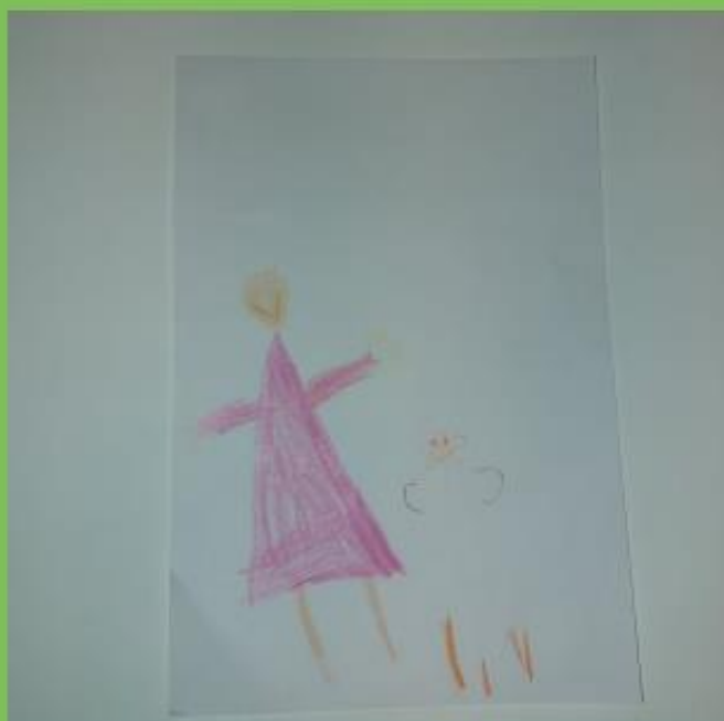
Primjer 7. Djevojčica (6 god.) Prijateljstvo, tehnika: olovka u boji, format A4, 2022., DV Kostrena, skupina "Bubamare".

ŠTO TE MUČI, ŠTO JE POŠLO NAOPAKO, MENI MOŽEŠ REĆI SVAKAKO! KAD SMO TUŽNI, TREBAMO SVOJE OSJEĆAJE IZREĆI, PRIJATELJI SU TU DA IM SE MOŽEMO POTUŽITI, ZATO SE MOŽEMO TI I JA DRUŽITI – REČE ANI.