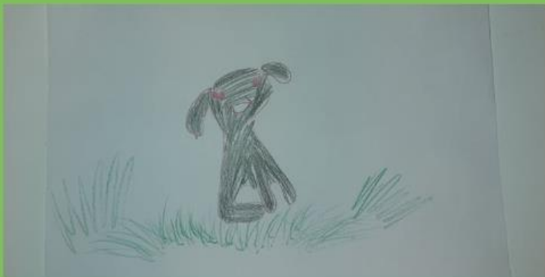
Primjer 8. Dječak (6 god.) Psić u travi, tehnika: olovka u boji, format A4, 2022., DV Kostrena, skupina "Bubamare".

TO ZVUČI KRASNO, PRIJATELJ MI STVARNO TREBA I OBEĆAJEM I JA ĆU TEBE UVIJEK SASLUŠATI, JER ZNAM DA PRIJATELJI NE PADAJU S NEBA – REČE KRZNENI PRIJATELJ.