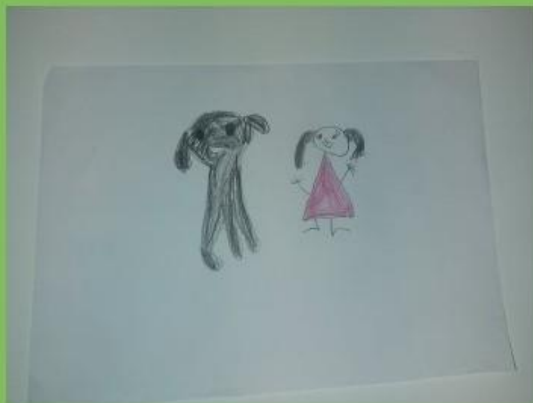
Primjer 9. Djevojčica (6 god., 6 mj.) Najbolji prijatelji, tehnika: olovka u boji, format A4, 2022., DV Kostrena, skupina "Bubamare".

JADNO MALO KRZNENO ČUDO, TAKO MI JE ŽAO ŠTO SI SAM, PA TO JE SULUDO. SA MNOM ĆEŠ KUĆI POĆI I VIŠE NEĆEŠ TUGOVATI U SAMOĆI. NI JA PRIJATELJA NEMAM, MOŽDA BI MOGLI BITI PRIJATELJI.