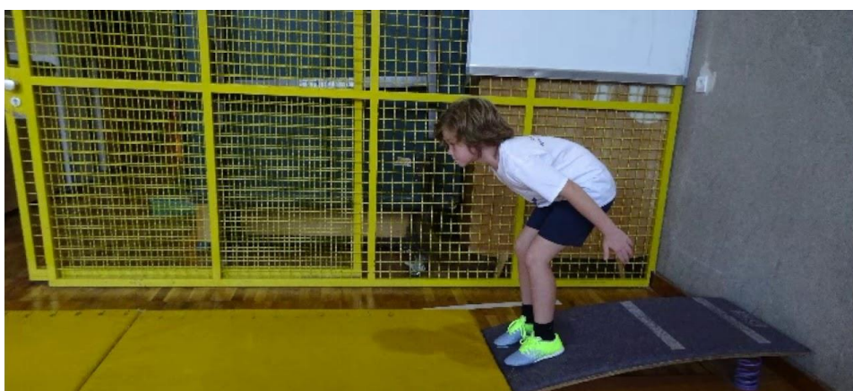
Slika5. Prikaz pravilnog izvođenja skoka u dalj

Za mjerenje eksplozivne snage koristi se test skoka u dalj. Za uspješne rezultate potrebne su dvije spojene strunjače dužine 3,5 metra, metalna metarska traka, ravnalo u obliku slova t te odskočna daska. Ispitanik sunožno skače s kraja odskočne daske pri čemu mu je dozvoljeno zamahivanje ruku. Učenik skače bos, tri puta zaredom, a mjeriteljev zadatak je zabilježiti najdulji trag ispitanika kojeg je napravio u tri pokušaja. Rezultat skoka se upisuje u centimetrima.