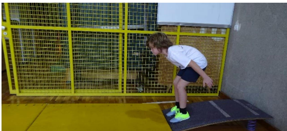
Slika5. Prikaz pravilnog izvođenja skoka u dalj

Za mjerenje eksplozivne snage koristi se test skoka u dalj. Za uspješne rezultate potrebne su dvije spojene strunjače dužine 3,5 metra, metalna metarska traka, ravnalo u obliku slova t te odskočna daska. Ispitanik sunožno skače s kraja odskočne daske pri čemu mu je dozvoljeno zamahivanje ruku. Učenik skače bos, tri puta zaredom, a mjeriteljev zadatak je zabilježiti najdulji trag ispitanika kojeg je napravio u tri pokušaja. Rezultat skoka se upisuje u centimetrima.