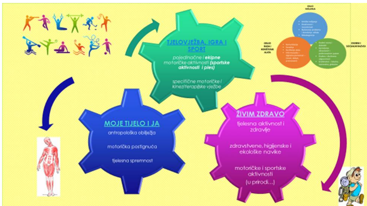
Slika 1. Grafički prikaz predmeta Tjelesne i zdravstvene kulture – domene

( https://www.google.com/search?q=domene+tjelesnog&sxsrf=ALeKk005Y6cM4XrdXUyLzrj2Yi-AN1ezqQ:1599923231516&source=lnms&tbn=isch&sa=X&ved=2ahUKEwi5nle_8uPrAhWuk4sKHX-tCAMQ_AUoAXoECAwQAw#imgrc=zBq5IA8aivFx0M )