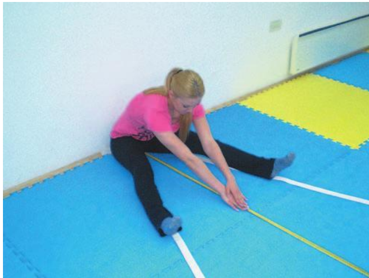
Slika 9. Primjer pravilnog izvođenja pretklona raznožno

Svrha zadatka je procjena fleksibilnosti ispitanika. Kao pomagalo služi nam drveni krojački metar. Zadatak učenika je da sjedne ispred zida na ravnu površinu pri čemu noge raširi pod kutom od 45 stupnjeva. U tom položaju ispruži ruke tako da postavi desni dlan na nadlakticu lijeve ruke, i tako postavljene i ispružene ruke spušta na tlo ispred sebe. Osoba koja je zadužena za mjerenje postavlja metar na mjesto gdje učenik dodirne tlo vrhovima prstiju. Učenik izvodi što dublji pretklon, bez trzaja tako da prsti klize po podu. Bilježi se najbolji rezultat od tri pokušaja, a očitava se i bilježi u centimetrima.