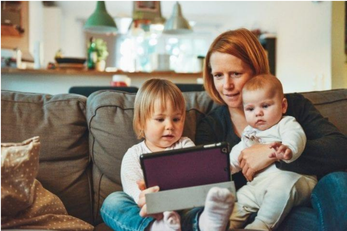
Slika 1. Učenje djeteta rane predškolske dobi vještinama i vrijednostima socijalizacije