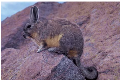
Slika 9. Pasanac