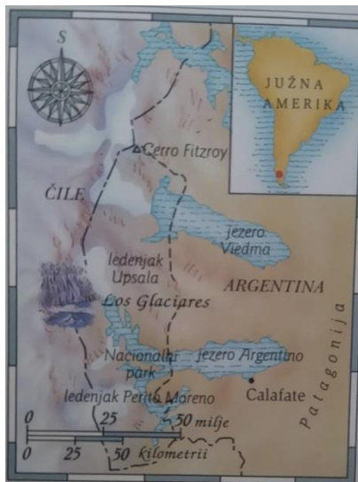
Slika 6. Smještaj na karti