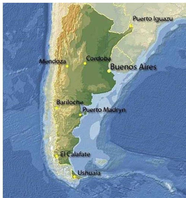
Slika 3. Prikaz reljefa Argentine

Izvor: <URL:www.hansaroundtheworld.com> (10.9.2016)