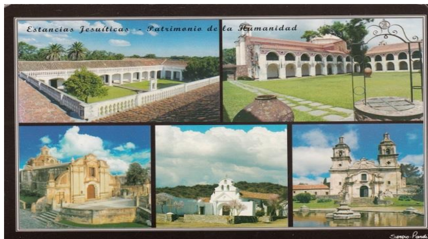
Slika 10. Isusovačka estancija

Córdoba je s 1,3 milijuna stanovnika drugi po veličini grad Argentine. 29 Nalazi se sjeverno od samog geografskog središta zemlje i glavni je grad pokrajine Córdoba. Dugo je bio španjolsko kolonijalno središte pokrajine koja je danas država Argentina. Córdoba je industrijsko i kulturno središte središnje Argentine i u gradu se nalazi jedno od vodećih sveučilišta u zemlji, Universidad Nacional de Córdoba. Njega su 1613. godine osnovali isusovci, koji su također zaslužni za najstarije argentinske rančeve i isusovačku četvrt, koji su 2000. godine upisani na UNESCO-v popis mjesta svjetske baštine u Americi. 30