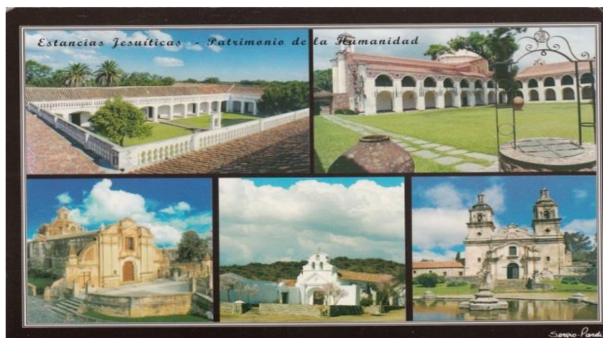
Slika 10. Isusovačka estancija

Córdoba je s 1,3 milijuna stanovnika drugi po veličini grad Argentine. 29 Nalazi se sjeverno od samog geografskog središta zemlje i glavni je grad pokrajine Córdoba. Dugo je bio španjolsko kolonijalno središte pokrajine koja je danas država Argentina. Córdoba je industrijsko i kulturno središte središnje Argentine i u gradu se nalazi jedno od vodećih sveučilišta u zemlji, Universidad Nacional de Córdoba. Njega su 1613. godine osnovali isusovci, koji su također zaslužni za najstarije argentinske rančeve i isusovačku četvrt, koji su 2000. godine upisani na UNESCO-v popis mjesta svjetske baštine u Americi. 30