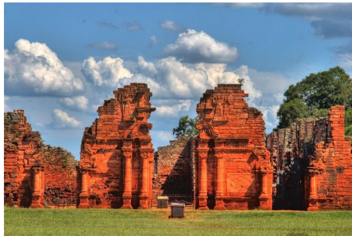
Slika 11. Isusovačke misije Guarana: San Ignacio Mini