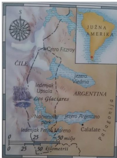
Slika 6. Smještaj na karti