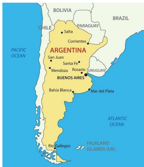
Slika 1. Smještaj Argentine u Južnoj Americi