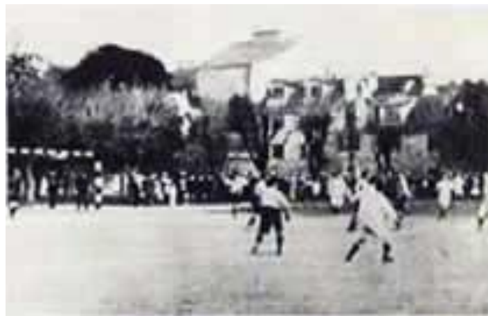
Slika 2: Prva utakmica kluba Hajduk

Ubrzo su se građani Splita, koji je tada brojio svega 20 tisuća stanovnika, podijelili na one koji su bili za i protiv nogometa. Međutim, balun se već zakotrljao Kraljevom njivom i bilo ga je nemoguće otjerati iz grada. Prva trening-utakmica između prve i druge momčadi odigrana je već sredinom travnja. S jedne strane mladići u bijelim košuljama, a s druge crveno-bijele košulje, po uzoru na Slaviju. Za ovu prigodu Fabijan Kaliterna je iz Praga poslao lopte, dresove i kopačke. Utkmica je trajala gotovo tri sata. Prvi predsjednik kluba bio je Kruno Kolombatović, a trener pod čijom vodstvom je i ostvarena prva pobjeda bio je Čeh Oldrich Just. Prva utakmica bila je protiv kluba Calcio Spalato, splitskog talijanaškog kluba, i Hajduk je u lipnju 1911. slavio pobjedom od 9:0, a prvi pogodak postigao je Šime Raunig.