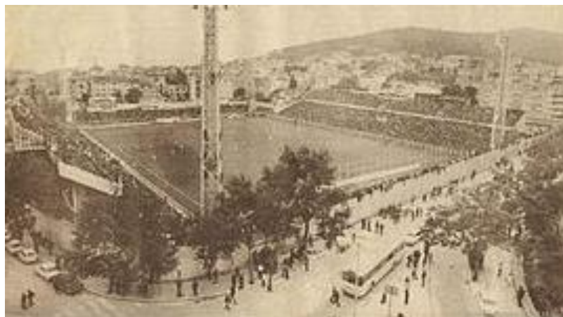
Slika 8: Stari plac

Sve do 1979. Hajduk je svoje utakmice igrao na Starom placu pokraj stare plinare. Zanimljivo je da se stadion nalazi odmah pokraj rodilišta, pa se tako govorilo da je svakom malom Splićaninu prvi pogled na vanjski svijet Hajdukov plac. Na ovom stadionu Hajduk je osvojio šest kupova i jedanaest prvenstava te odigrao 3138 utakmica. Valja napomenuti kako je Split dobio organizaciju Mediteranskih igara te je za tu priliku izgrađen novi gradski stadion, Poljud. Dakle, nakon 68 godina igranja na Starom placu, od 1979. Poljud je novi stadion Hajduka, gradska ljepotica te remek-djelo Borisa Magaša.