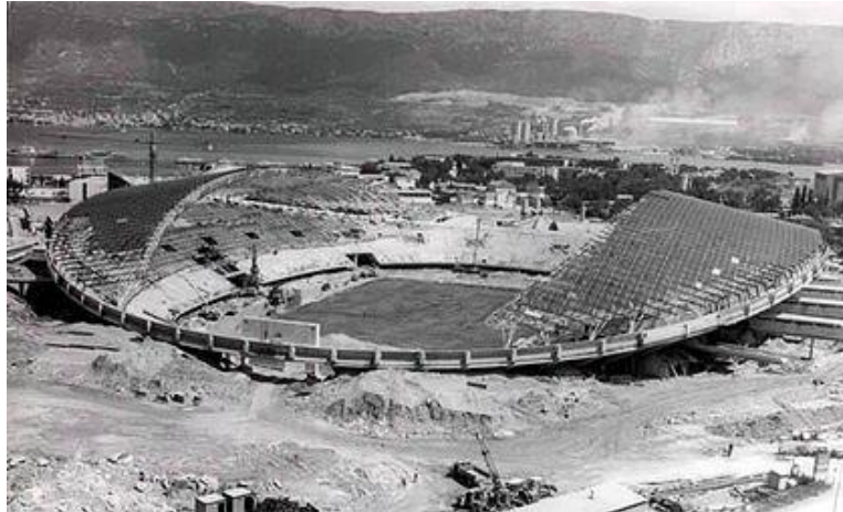
Slika 9: Izgradnja Poljuda