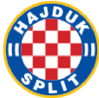
Slika 7: Grb Hajduka

grb kao i u prethodnom razdoblju samo bez godine 1911. na plavom obrubu. Od 1990. godine do danas Hajduk ima svoj početni grb.