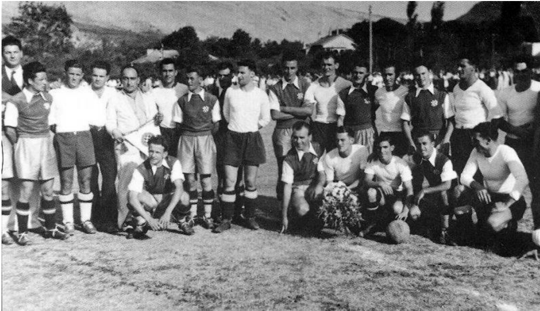
Slika 3: Momčad Hajduka 1939. godine

Prvo Prvenstvo splitskog nogometnog podsaveza odigrava se 1920. godine. Bilo je to jedino prvenstvo koje nisu osvojili jer su do 1936. slavili u svih 13 završenih prvenstava. Kasnih tridesetih nije nastavio upisivati dobre rezultate, iako je igrao diljem svijeta, a u zemlji nije ni jednom bio državni prvak. Prva sljedeća titula uslijedila je 1941. u Banovini Hrvatskoj.