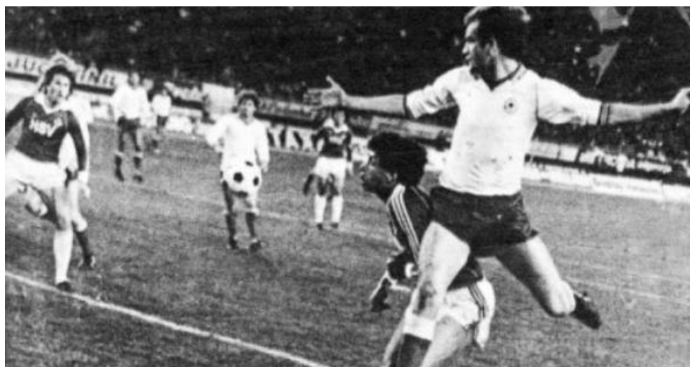
Slika 12: Utakmica 1980. godine