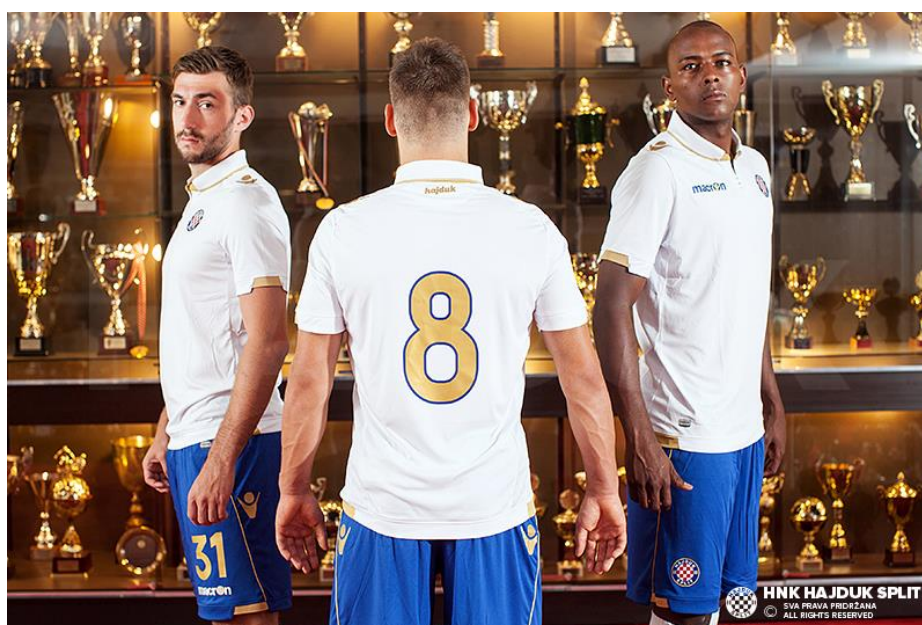
Slika 6: Dres Hajduka 2016. godine

Na prvim utakmicama igrači Hajduka su imali crveno-bijele pruge okomito kombinirane, kao simbol hrvatskoga grba. Dres je kasnije imao crvenu boju kao simbol Hrvatske, plavu boju kao simbol mora i Dalmacije, a bijelim slovima je ispisano Hajduk. Opet simbolično, kasnije se koristi ponajviše bijela boja na dresovima, u kombinaciji s plavim hlačama i čarapama, simbol jedara na moru, i od tada Hajdukovi igrači imaju naziv bili , odnosno bijeli .