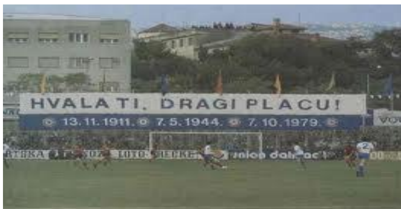
Slika 5: Zadnja utakmica na Starom placu

Dvije godine poslije momčad je preuzeo Tomislav Ivić te bijeli nižu uspjehe u svim uzrastima. Nakon sumornih i traumatičnih šezdesetih, optimizam se polako vraća u klub. Na vrata Hajdukove prve momčadi kuca generacija domaćih mladića koja će ostati upisana u povijest kao "zlatna generacija" sedamdesetih. Tvrdnju potvrđuju osvajanja četiri naslova prvaka i pet uzastopnih kupova. Nikom drugom nešto slično nije pošlo za rukom. Tu generaciju znali su naizust gotovo svi ljubitelji nogometa na ovim prostorima, a u Splitu vjerojatno nije bilo onog tko nije znao 11 veličanstvenih: Mešković, Džoni, Rožić, Peruzović, Holcer, Buljan, Žungul, Mužinić, Oblak, Jerković i Šurjak. Trener je bio Tomislav Ivić, a predsjednik kluba legendarni Tito Kirigin. Napravljen je i europski iskorak: klub stiže do polufinala Kupa pobjednika kupova i četvrtfinala Kupa prvaka.