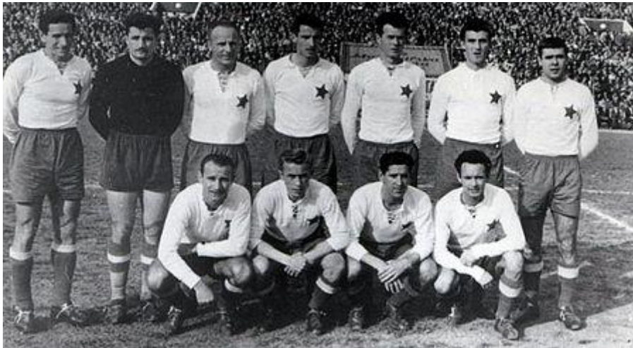
Slika 4: Momčad Hajduka 1954./55. godine

Prvo od dva velika zlatna doba Hajduka počelo je s osvojenim naslovom prvaka 1950. godine. Zvezda je povela, ali golovima Vukasa i Bože Brokete bijeli preokreću i osvajaju prvenstvo bez poraza. Ostali su jedini klub kojem je to uspjelo. Dvije godine kasnije generacija Beare i Vukasa opet je najbolja, a 1953. Nogometni savez Jugoslavije Splićanima je zabranio odgodu dviju utakmica zbog boravka u Argentini, koji je i državni vrh Jugoslavije pozdravio. Zbog tog apsurdna bijeli su morali igrati s juniorima na početku prvenstva, a unatoč nokautima Zvezde i Partizana u Beogradu, nisu uspjeli doći do titule.