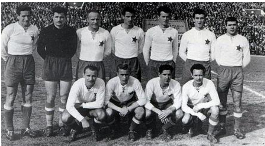
Slika 4: Momčad Hajduka 1954./55. godine

Prvo od dva velika zlatna doba Hajduka počelo je s osvojenim naslovom prvaka 1950. godine. Zvezda je povela, ali golovima Vukasa i Bože Brokete bijeli preokreću i osvajaju prvenstvo bez poraza. Ostali su jedini klub kojem je to uspjelo. Dvije godine kasnije generacija Beare i Vukasa opet je najbolja, a 1953. Nogometni savez Jugoslavije Splićanima je zabranio odgodu dviju utakmica zbog boravka u Argentini, koji je i državni vrh Jugoslavije pozdravio. Zbog tog apsurdna bijeli su morali igrati s juniorima na početku prvenstva, a unatoč nokautima Zvezde i Partizana u Beogradu, nisu uspjeli doći do titule.