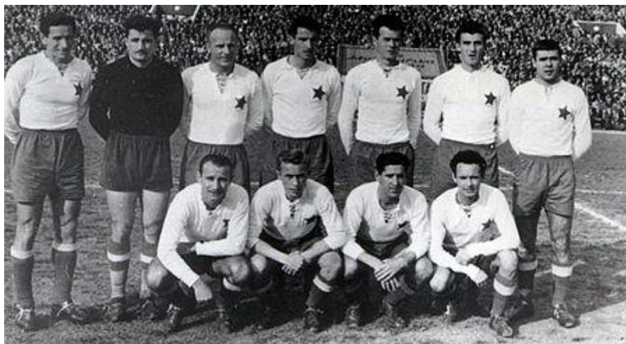
Slika 4: Momčad Hajduka 1954./55. godine

Prvo od dva velika zlatna doba Hajduka počelo je s osvojenim naslovom prvaka 1950. godine. Zvezda je povela, ali golovima Vukasa i Bože Brokete bijeli preokreću i osvajaju prvenstvo bez poraza. Ostali su jedini klub kojem je to uspjelo. Dvije godine kasnije generacija Beare i Vukasa opet je najbolja, a 1953. Nogometni savez Jugoslavije Splićanima je zabranio odgodu dviju utakmica zbog boravka u Argentini, koji je i državni vrh Jugoslavije pozdravio. Zbog tog apsurdna bijeli su morali igrati s juniorima na početku prvenstva, a unatoč nokautima Zvezde i Partizana u Beogradu, nisu uspjeli doći do titule.