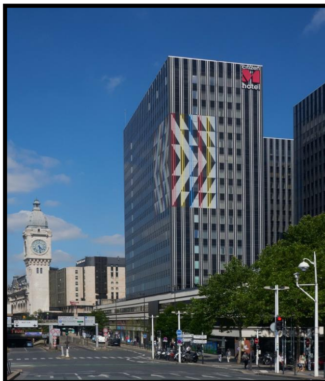
Slika 12. Hotel CitizenM Paris Gare de Lyon