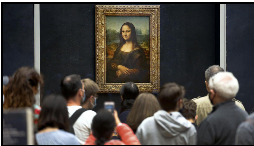
Slika 5. Mona Lisa