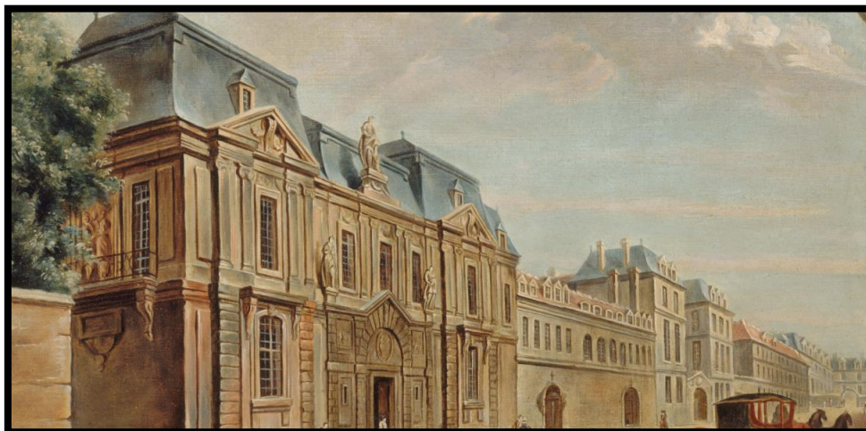
Slika 9. Muzej Carnavalet