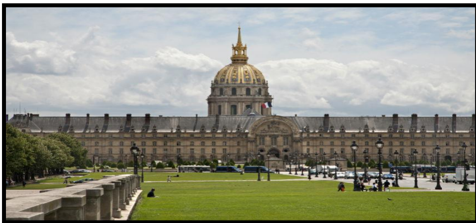
Slika 10. Muzej de l'Armee