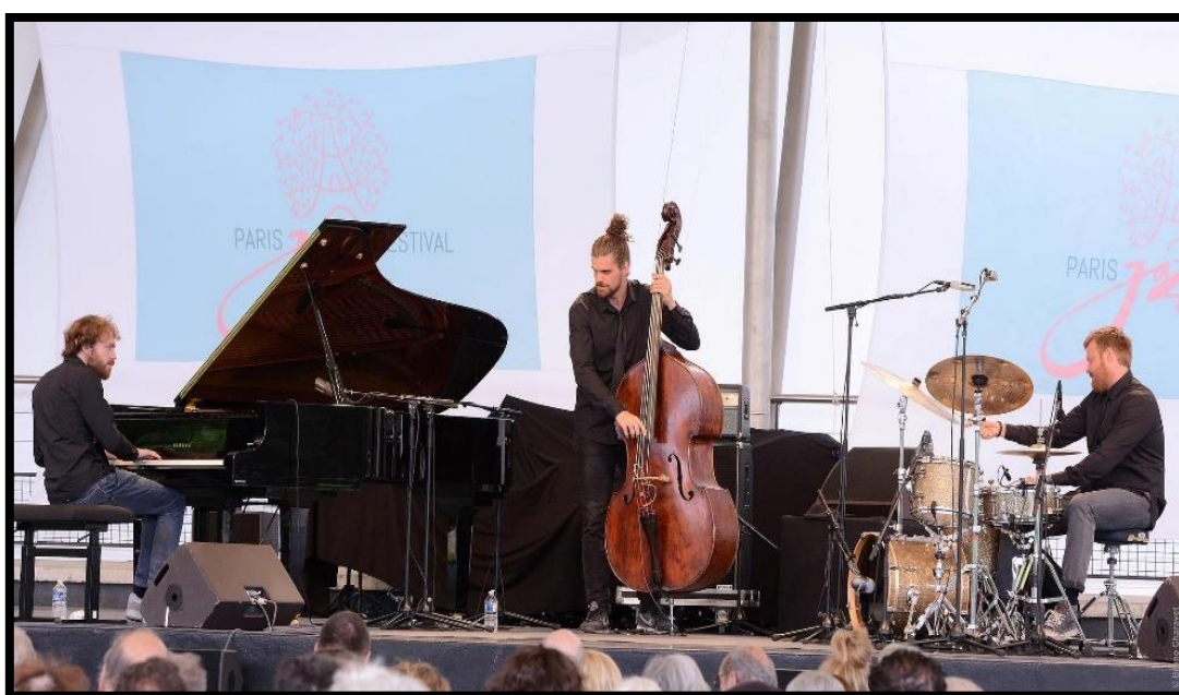
Slika 11. Paris Jazz Festival