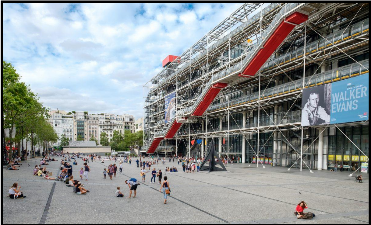
Slika 7. Centar Georges Pompidou