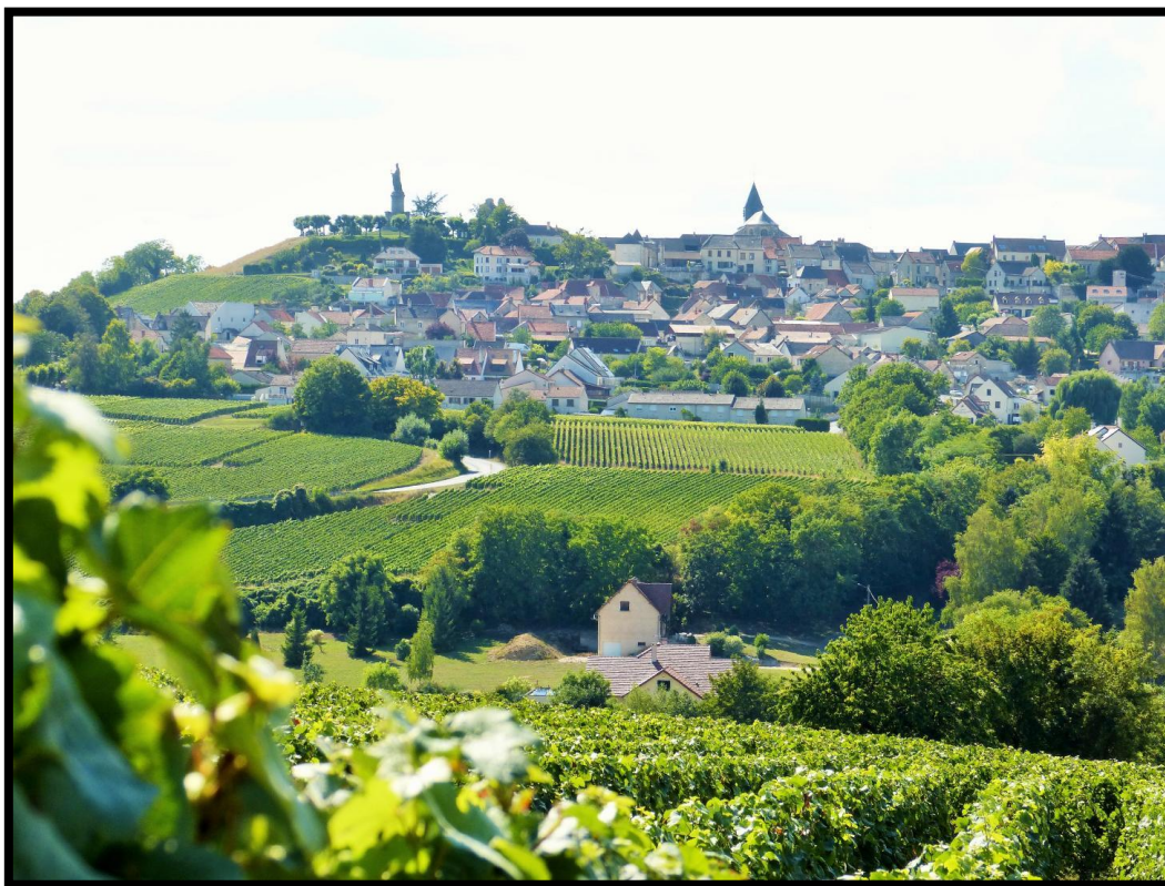
Slika 3. Montagne de Reims