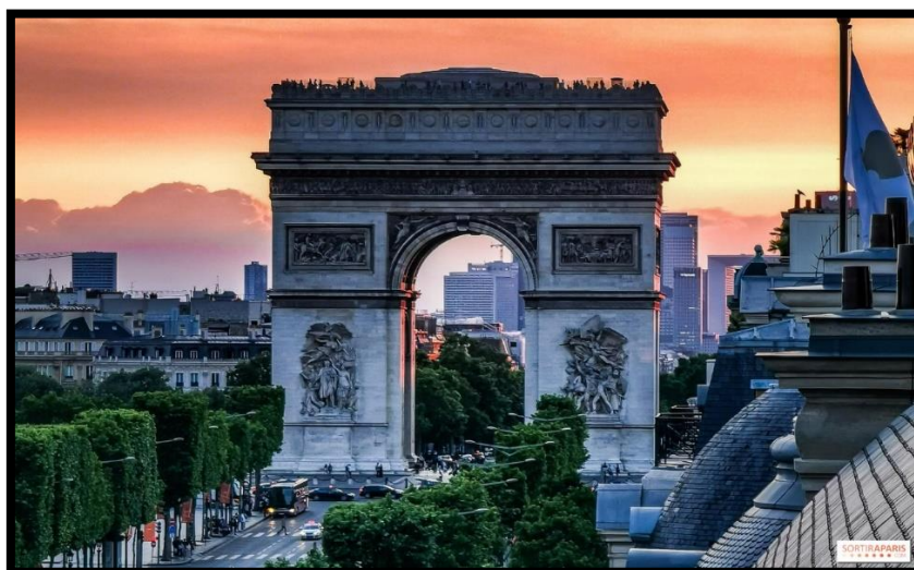
Slika 4. Slavoluk pobjede u Parizu