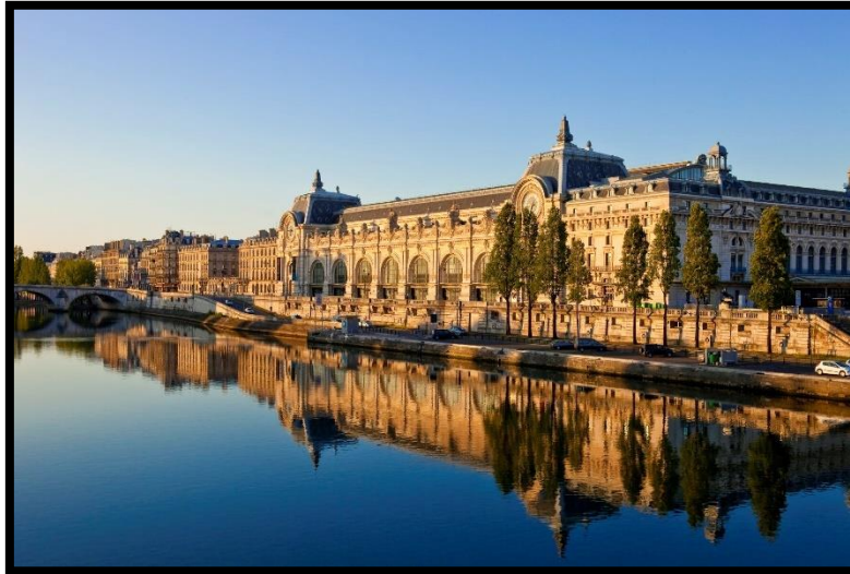
Slika 6. Muzej d'Orsay