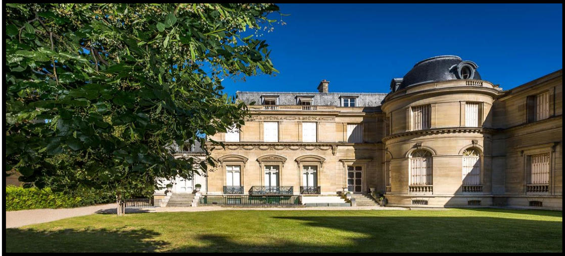
Slika 8. Muzej Marmottan