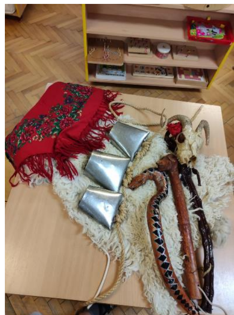
Slika 7. Zvona i druga oprema zvončara.

Na stalku su pripremljena tri velika zvona, na svakom je zalijepljen kružić u drugoj boji. Kružići u boji lijepe se i na nekoliko papira A4 formata, različitim redoslijedom. To djeci označava kojim redoslijedom moraju udarati zvona ne bi li proizveli