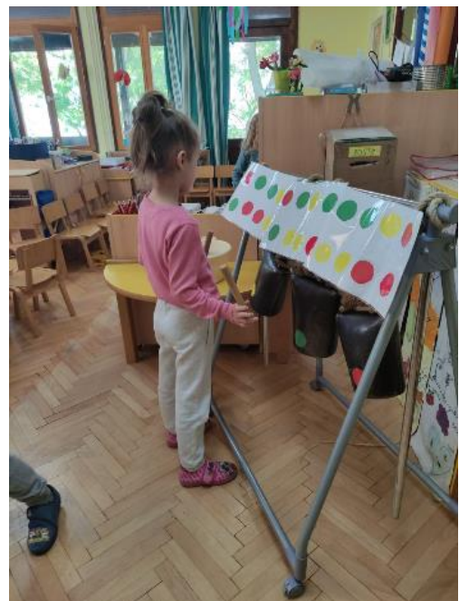
Slika 10. Aktivnost sviranja zvona.

Djevojčice su samo latice morale naviti na štapić za ražnjiće kako bi se latica uvila te onda je stišćući u sredini formirati u cvijet. Aktivnosti je pristupio i jedan dječak te je ostao do kraja, do zadnje potrošene krep latice. Na početku su veoma spretno uvijali i spajali cvjetove, ali kako im je pozornost popuštala počeli su ih brzo uvijati te su bili sve tanji i sve manje nalikovali cvijetu.