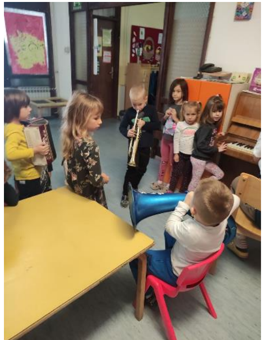
Slika 11. Aktivnost sviranja instrumenata.

odgoj i obrazovanje u ustanovama za rani i predškolski odgoj prenijeti dio folklornog glazbenog naslijeđa.