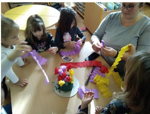
Slika 8. Izrada "krabujosnice".

dva plakata kako bi lakše mogli obratiti pozornost na upite vezane za temu. Na upit koje su razlike kod zvončara, djeca navode: maska ili šešir s cvjetovima. Jedan od dječaka ističe da neki zvončari imaju jedno zvono dok neki imaju više njih. Potom je