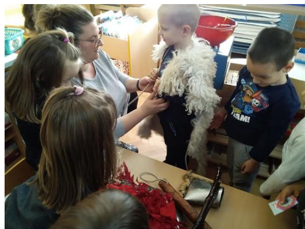
Slika 9. Odijevanje u zvončarsku odjeću.

Postavljeno im je pitanje jesu li ikada vidjeli zvončare. Djeca su potvrdno odgovorila, kako su ih vidjela na Riječkom karnevalu. Jedna je djevojčica i privatno vidjela zvončare jer joj baka i djed žive u selu gdje zvončari ophode selo (Halubajski zvončari). Na zidu iznad glazbenog centra bila su im pripremljena