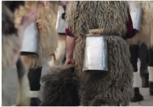
Slika 3. Grobnička Dondola (zvona).

stvaraju se različiti zvukovi. Pri tome do izražaja dolazi vještina zvončara koji usklađuju pulsiranje zvona vlastitim tijelom dovodeći ih u suživot, proizvodeći (svi zajedno) istovremeno ritmičku tutnjavu (Rijeka 2020.eu, 2020).