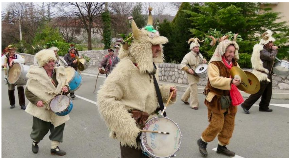
Slika 6. Svirači udaraljka u zvončarskoj povorci.

Djeca u ustanovama ranog i predškolskog odgoja na širem području Rijeke upoznaju se s bubnjem ne samo kao glazbenim instrumentom već i kao instrumentom koji je usko vezan uz zvončare te koji, zajedno sa zvukovima zvona, proizvodi simfoniju straha koja može otjerati sve što je zlo.