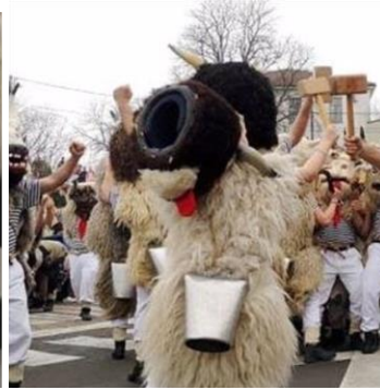
Slika 2. Halubajska zvona.

Prema riječima dondolaša, zvuk zvona je ono što ih pokreće, “osjećaj kada sve oko tebe nestaje, a ritam srca ujednači se sa zvukom zvona i postajete jedno” (Gržetić, 2009:38).