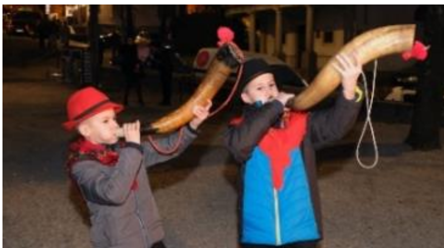
Slika 4: Početak Mesopusta puhanjem u Antonjski rog.

Analizom objava o aktivnostima i programima dječjih vrtića na širem riječkom području uočeno je da se u pojedinim ustanovama ranog i predškolskog odgoja njeguje tradicija i kultura kroz glazbene i likovne aktivnosti s temom zvončara, kao što je izrada i tuljenje (sviranje) u Antonjski rog. Puhanjem u rog na Antonju (dan sv. Antuna Pustinjaka, 17. siječnja), odnosno zvukom Antonjskog roga, najavljuje se početak pokladnih igara koje traju do Pepelnice.