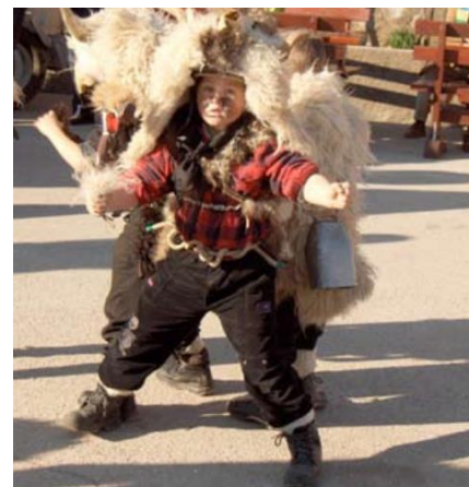
Slika 1. Grobnički mići dondolaši.

U tu svrhu koristili su zvona, čegrtaljke i druga priručna sredstva. No, zvuk zvona je, unatoč njihovom zastrašujućem izgledu zbog maski i odjeće koje su nosili te različitih alata (sjekira, štap i dr.) koja su imali, bio presudan u ostvarenju njihova nauma. Na Grobniku je to bio zvuk Dondolo (zvona), a oni koji su ih nosili dobili su naziv Dondolaši . Iako se tijekom vremena običaj "dondolanja" izgubio pod pritiskom društvenih promjena i industrijalizacije, običaj se zadržao tijekom maškara. Dondolaši nose na leđima veliko zvono, a kretnjama tijela u koreografiji, parovi dondolaša (Slika 1) stvaraju zvukove zvona.