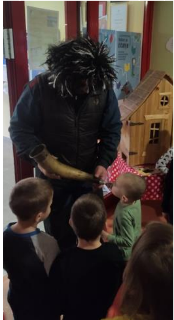
Slika 5. Puhanje u Antonjski rog u Dječjem vrtiću Viškovo.

Bubanj se ubraja među najstarije glazbene instrumente. Nezaobilazan je pratitelj zvončara. Zvuk ovog instrumenta nastaje udaranjem palice po membrani od životinjske kože. Nema pravila kakav se bubanj koristi u zvončarskom ophodu, može biti bilo kakav (Slika 6). Prisutnost bubnja može, također, biti jedan od pokazatelja vojničkog karaktera zvončara. Udarci palice po bubnju stvaraju vibracije koje proizvode određeni zvuk. Sila zvuka koju bubnjevi proizvode trebala bi otjerati sve zlo.