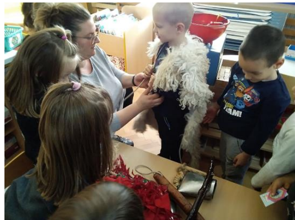
Slika 9. Odijevanje u zvončarsku odjeću.

Postavljeno im je pitanje jesu li ikada vidjeli zvončare. Djeca su potvrdno odgovorila, kako su ih vidjela na Riječkom karnevalu. Jedna je djevojčica i privatno vidjela zvončare jer joj baka i djed žive u selu gdje zvončari ophode selo (Halubajski zvončari). Na zidu iznad glazbenog centra bila su im pripremljena