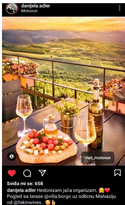
Slika 3. Primjer digitalnog marketinga na Instagramu