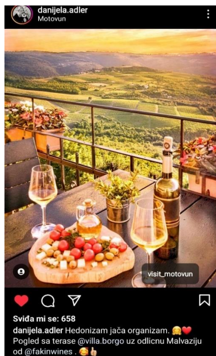
Slika 3. Primjer digitalnog marketinga na Instagramu