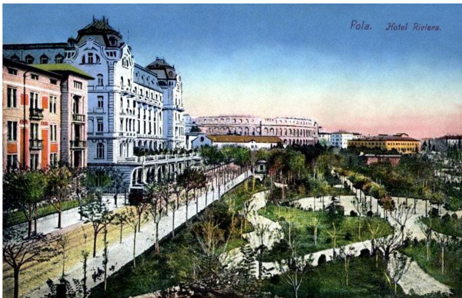
Slika 3. Hotel Riviera