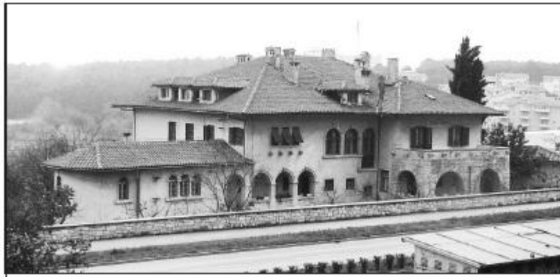
Slika 2. Vila Idola