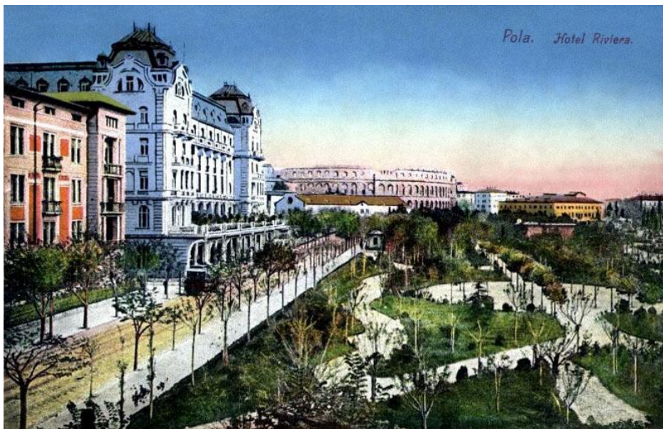
Slika 3. Hotel Riviera