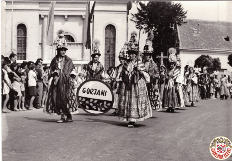
Slika 27. Ljelje iz Gorjana na 2. Đakovačkim vezovima