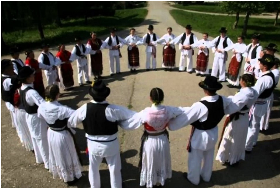
Slika 23. Slavonsko kolo (drmeš)