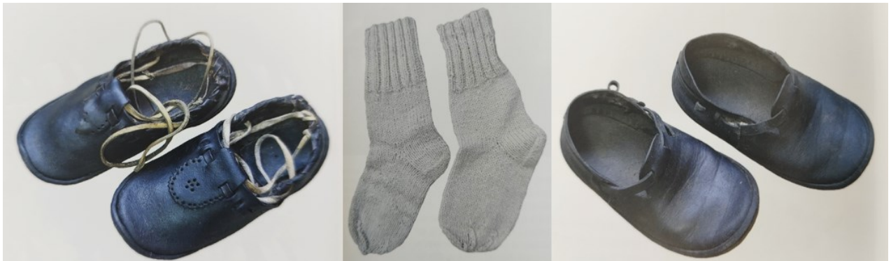
Slika 14. Opanci kaišari, bijele vunene čarape i opanci s remenima