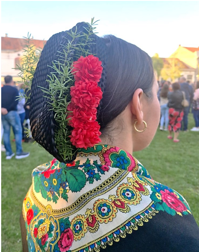
Slika 22. Perčin na snaši