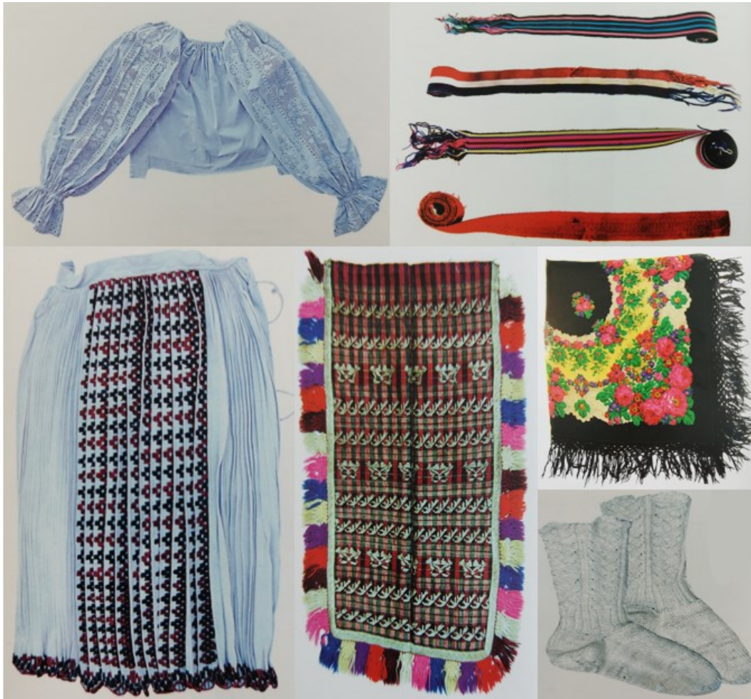
Slika 16. Dijelovi ženske narodne nošnje