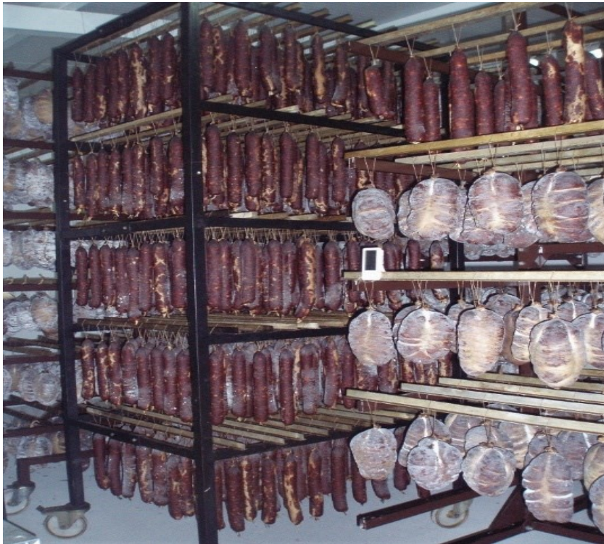
Slika 5. Sušenje i skladištene kulena