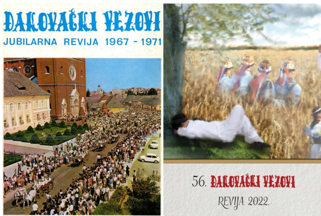
Slika 29. Revije Đakovačkih vezova