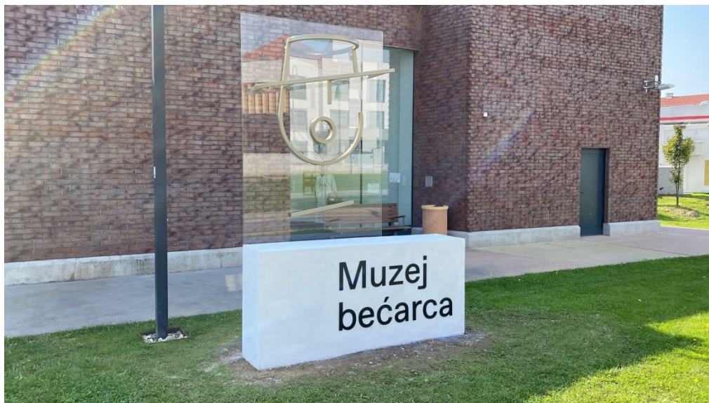
Slika 12. Muzej bećarca