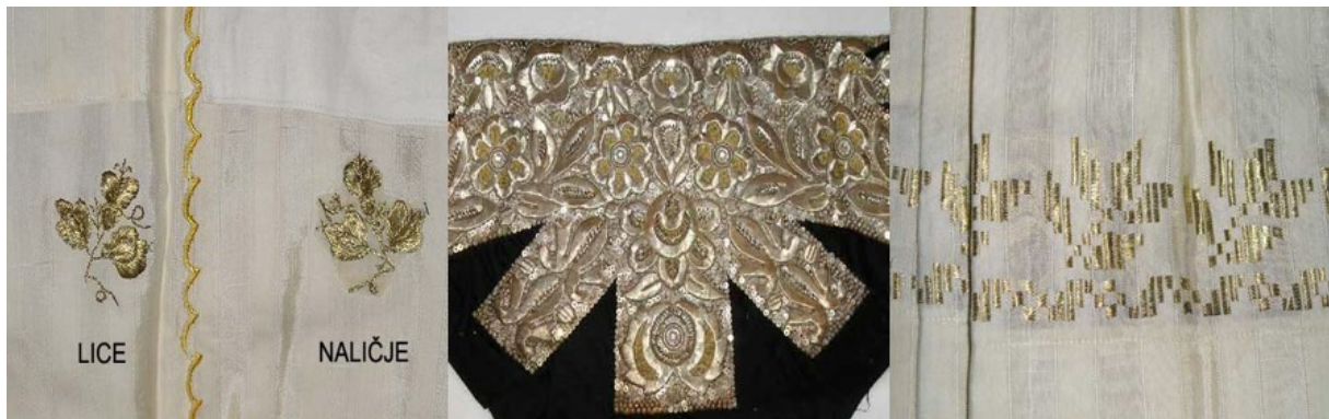
Slike 10. Tehnike zlatoveza (naskroz, zlatom preko papira i ubjerano)