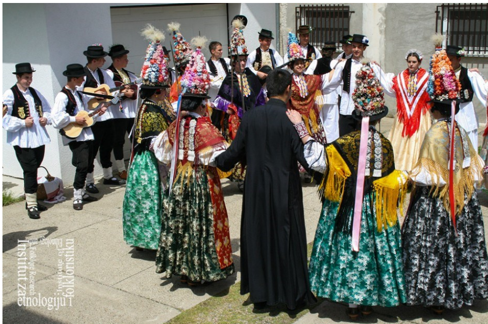
Slika 2. Nastup Ljelja iz Gorjana