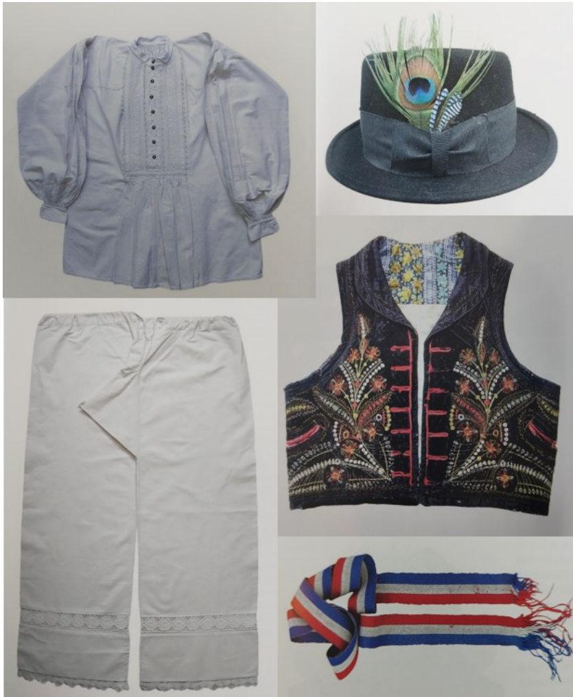
Slika 13. Dijelovi muške narodne nošnje