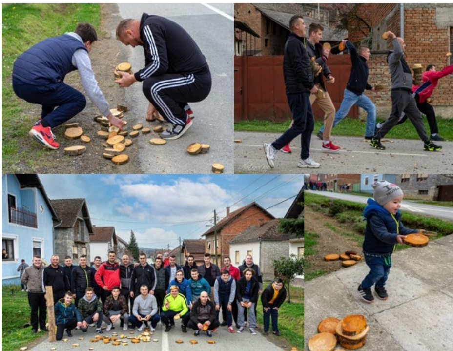
Slika 6. Običaj koturanja