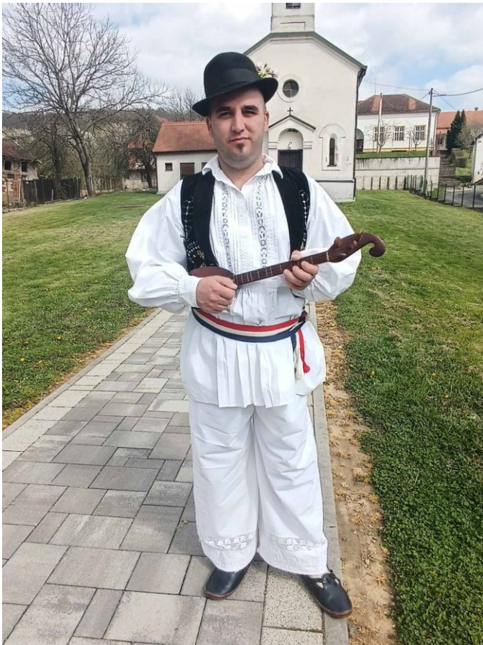
Slika 26. Bećar s tamburom samicom

Umijeće sviranja na tamburi samici upisano je u Registar kulturnih dobara RH na Listu zaštićenih kulturnih dobara. Pravni status je zaštićeno kulturno dobro, vrsta je nematerijalna, a datacija od sredine 18. do početka 21. stoljeća. Ovo je kulturno dobro smješteno na području pet županija, odnosno u Brodsko-posavskoj, Osječko-baranjskoj, Požeško-slavonskoj, Virovitičko-podravskoj te Vukovarsko-srijemskoj županiji. 130