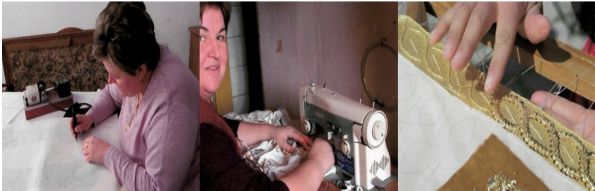
Slika 9. Priprema i izrada zlatoveza

Izvor: Juzbašić, J., Slavonski zlatovez , Županja, Zavičajni muzej „Stjepan Grubner“ Županja, 2018., str. 43., 45. i 47.