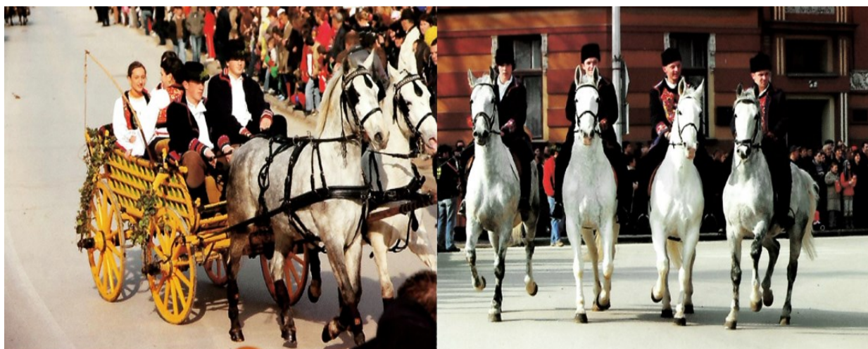
Slika 8. Zaprega i jahači