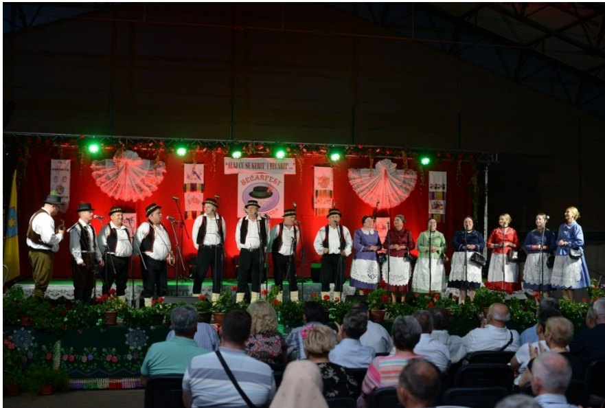
Slika 11. Pjevači bećarca