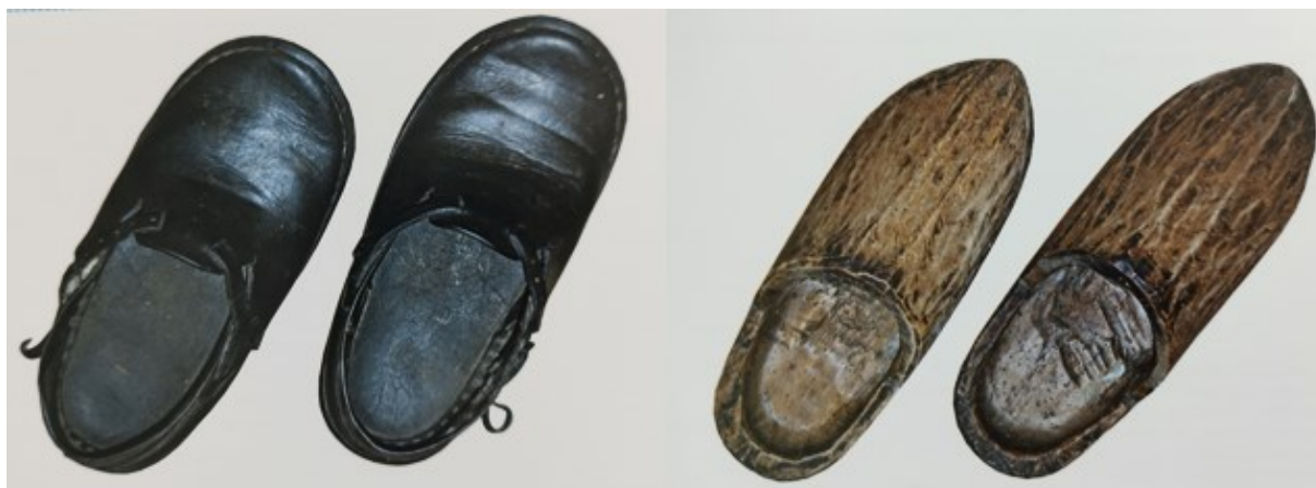
Slika 18. Opanci i drvenjaci