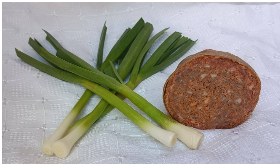
Slika 4. Slavonski kulen

Proizvodnja kulena nastala je puno prije nego što što je spomenuta u pisanom obliku i to kao potreba da se višak svinjskog mesa spriječi od kvarenja duže vrijeme. U vrijeme Austro-Ugarske Monarhije brojni su mladići odlazili u inozemstvo kao šegrti kako bi izučili mesarski obrt, a zahvaljujući europskom kulturnom utjecaju stvoreni su specifični suhomesnati proizvodi, među kojima je i kulen (sl. 4).