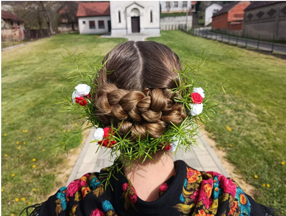
Slika 20. „Coklovana“ frizura ukrašena živim i umjetnim cvijećem