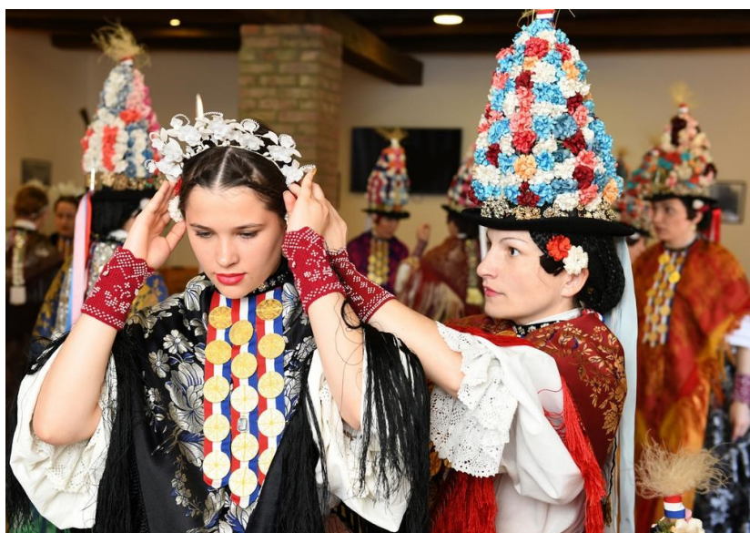
Slika 3. Narodna nošnja Ljelja