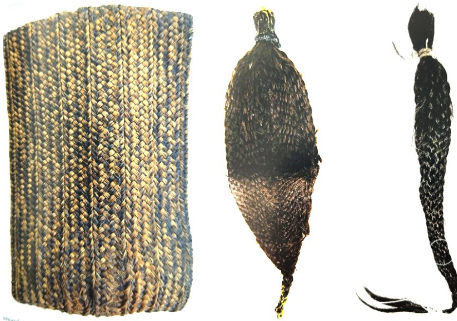
Slika 21. Garčinski perčin, paurski perčin i kintoš