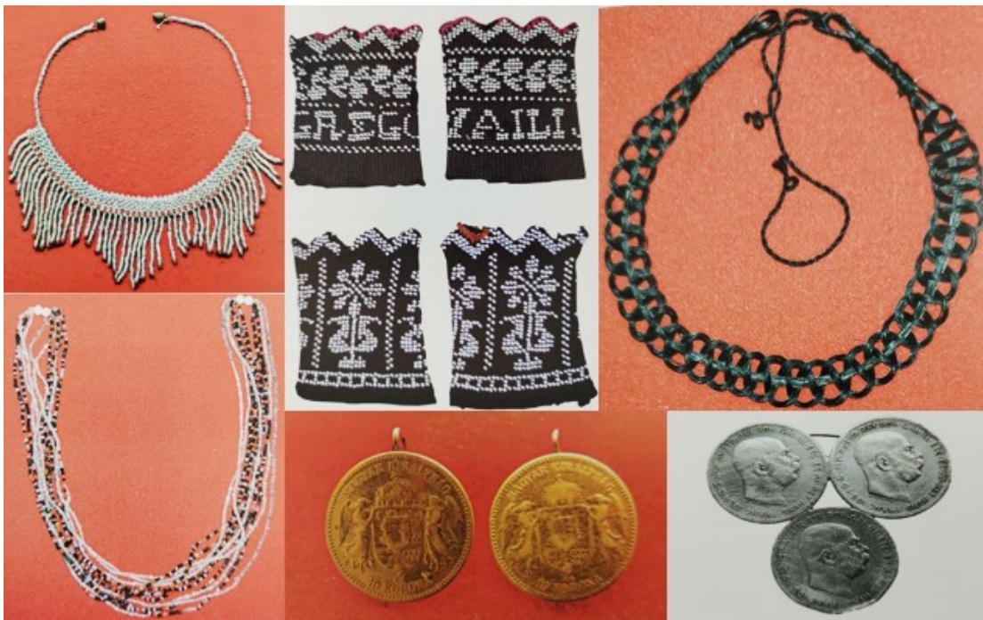
Slika 19. Tradicijski nakit