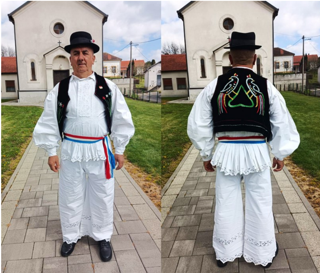
Slika 15. Bećar u narodnoj nošnji novogradiškog kraja