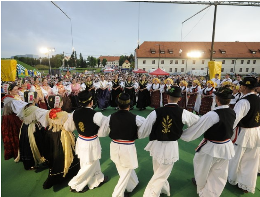
Slika 24. Šokačko kolo