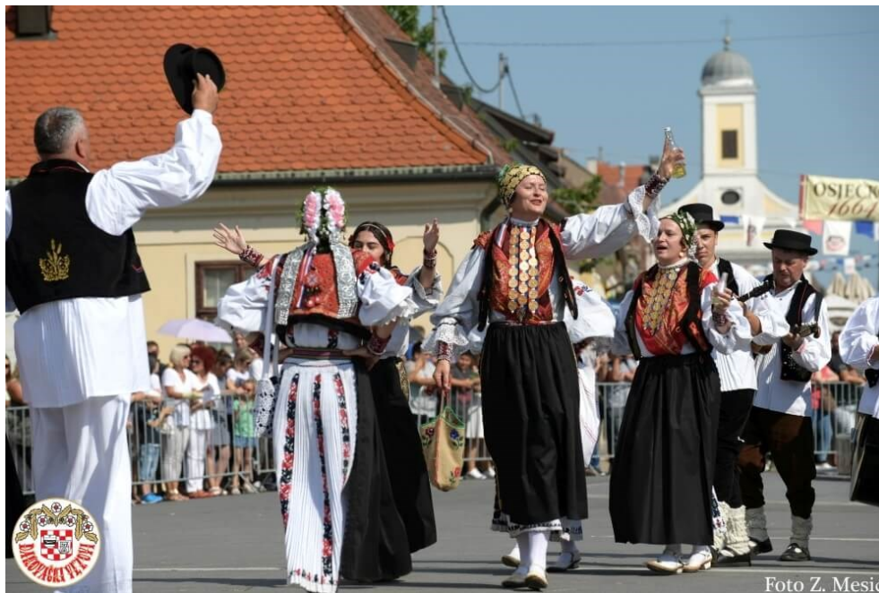
Slika 28. Svečana povorka Đakovačkih vezova