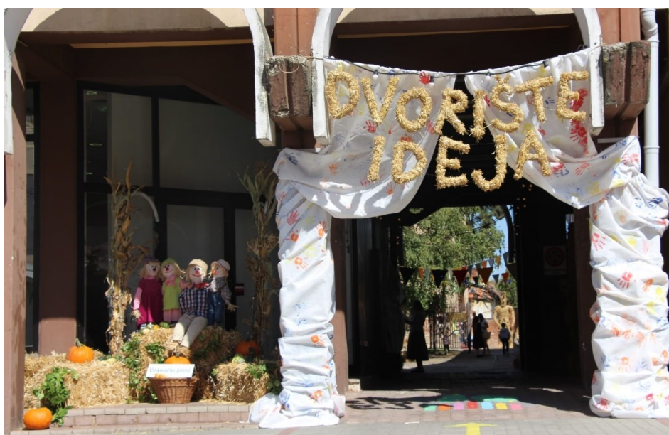
Slika 31. Dvorište ideja