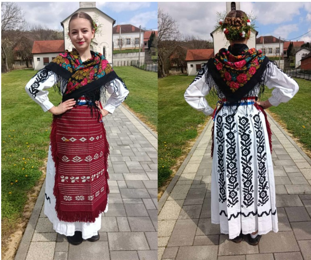
Slika 17. Snaša u narodnoj nošnji novogradiškog kraja

Preko košulje se još, ovisno o dijelu Slavonije, nosi i marama ili lajbek (prsluk). Marama se nosila oko vrata i zapravo je bila četvrtasti kupovni rubac s velikim resama koji je bio savijen na pola, savijen preko prsa i vezan na leđima. Najcjenjenije su „tibetne marama“ (marama od kašmira), najčešće izrađivane u crnoj boji s raznobojnim cvjetnim ornamentom, a tek se rijetko mogla naći takva marama u bijeloj boji. 104 Lajbek, odnosno prsluk, najčešće se šivao u crnoj boji od svile, someta ili glota. S prednje strane se kopča kvačicom, a šivan je s dubokim prsnim izrezom. Unutarnji rub može biti nazuban ili ravan, a neki mogu imati i prišivenu ukrasnu mašnu izrađenu od istog materijala. 105