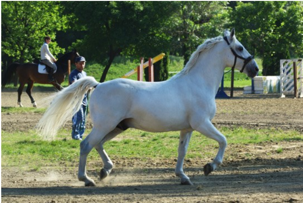
Slika 7. Lipicanac