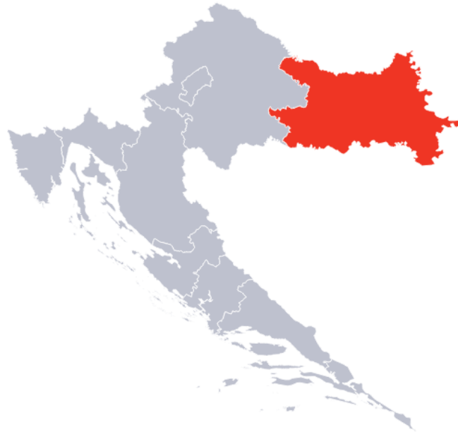
Slika 1. Položaj Slavonije