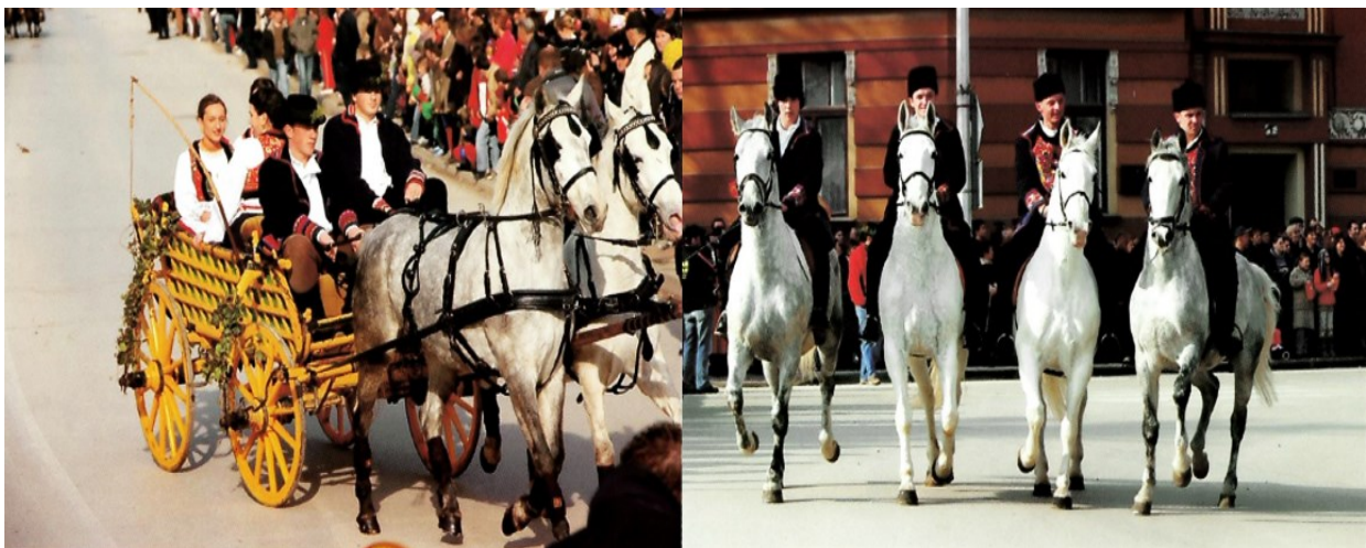
Slika 8. Zaprega i jahači