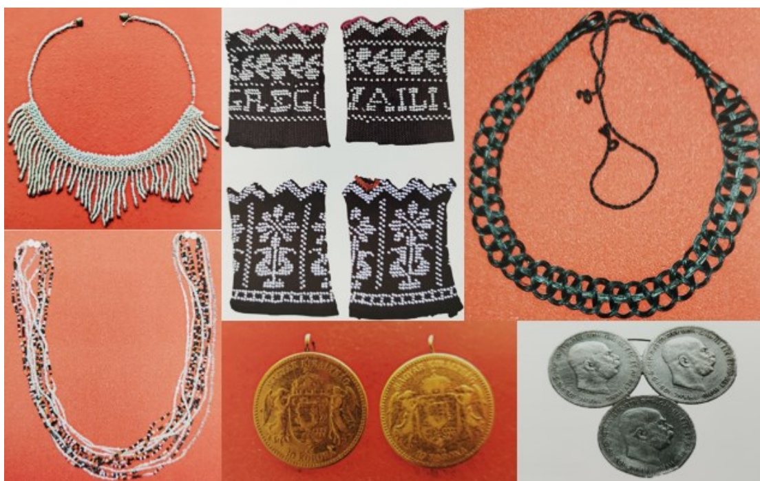
Slika 19. Tradicijski nakit