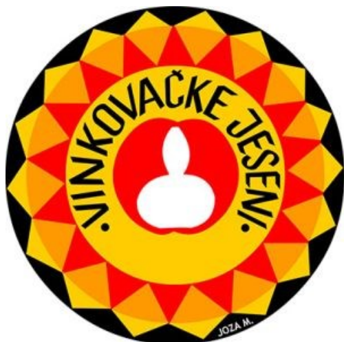
Slika 30. Grb Vinkovačkih jeseni