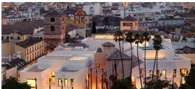
Slika 13: Picassov muzej