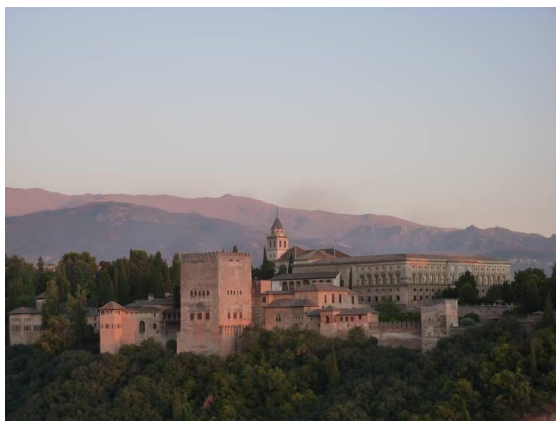
Slika 5: Dvorac Alhambra