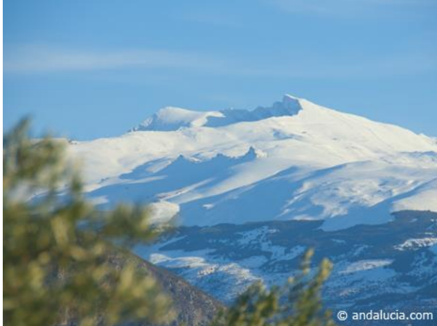
Slika 1: Bijeli vrhovi planinskog lanca Sierra Nevada