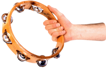
Slika 10. - Tamburin