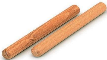
Slika 5. – Štapići