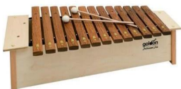
Slika 2. - Ksilofon