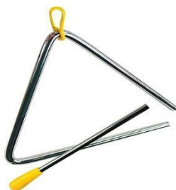
Slika 7. - Triangl