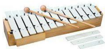
Slika 3. - Metalofon