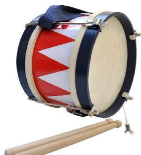
Slika 6. - Mali bubanj