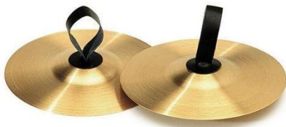
Slika 8. - Činele