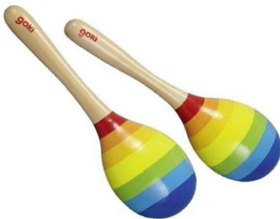
Slika 9. - Zvečka