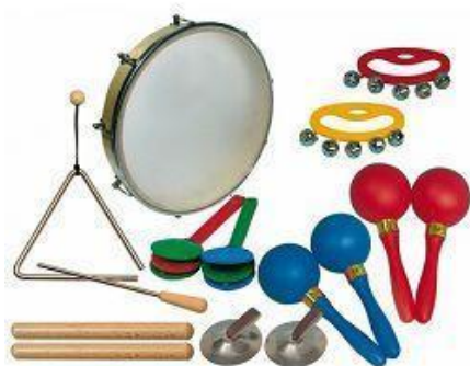
Slika 1. - Orffov instrumentarij

Izvor: https://www.musicshopetida.hr/slike/male/goldon-mimni-set-30020-gol-30020_1.jpg 10.02.2023.