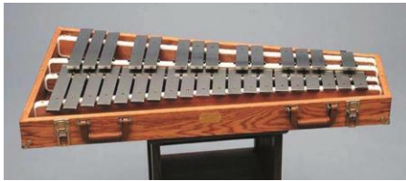
Slika 4. - Zvončići