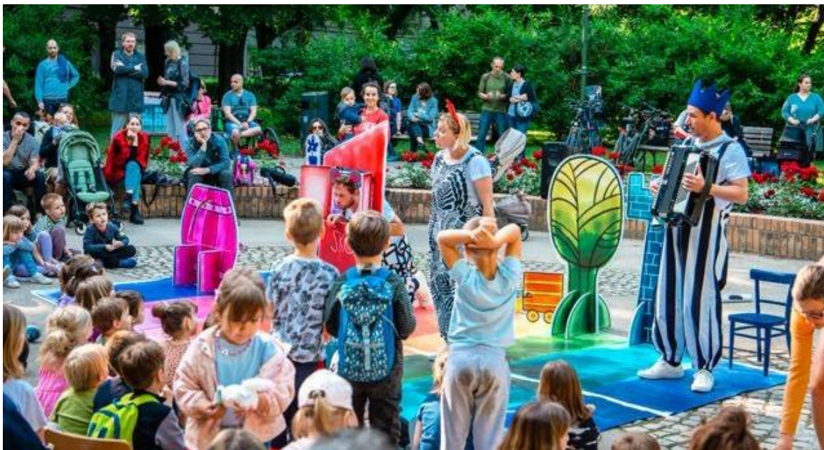
Prilog 4: Atmosfera tijekom predstave Teatra Poco Loco