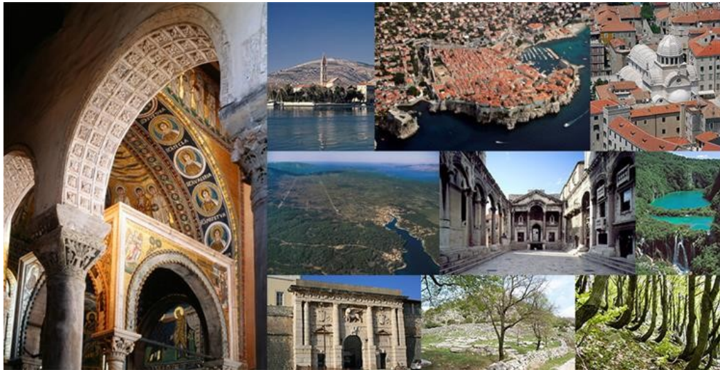
Slika 1. Nepokretna kulturna dobra Republike Hrvatske na UNESCO-ovoj listi