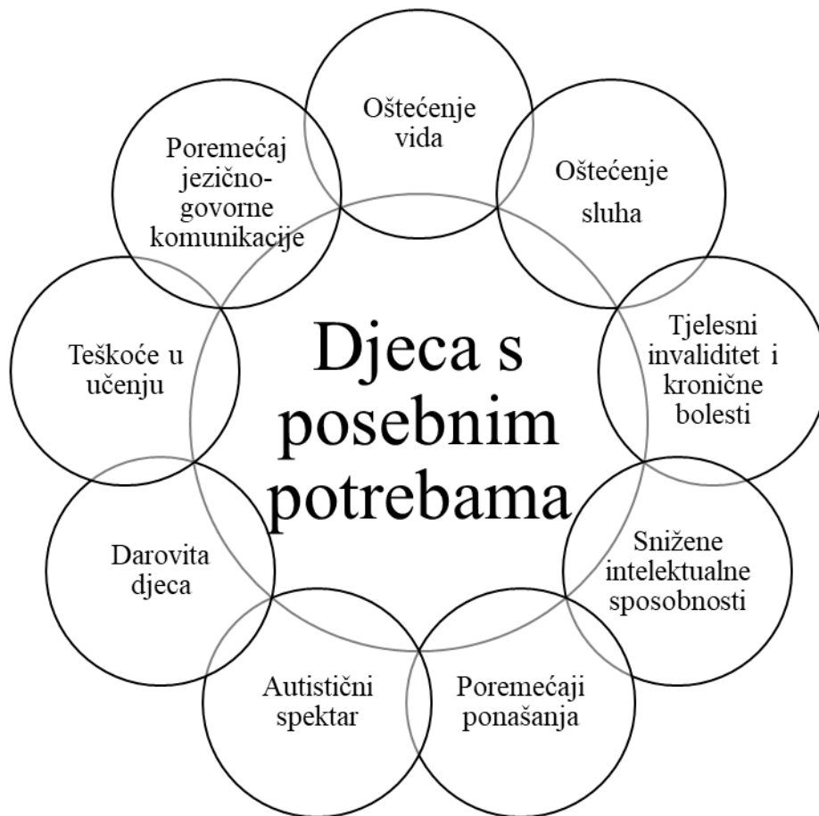
Grafikon 1. Djeca s posebnim potrebama (prema Kostelnik, 2004,22)

Kao što je vidljivo na grafikonu 1. djeca s posebnim potrebama, prema Kostelnik (2004,22) su djeca s: