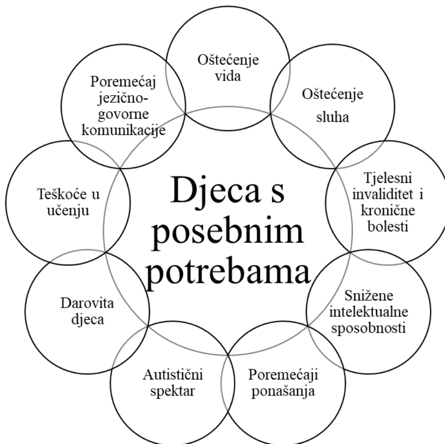
Grafikon 1. Djeca s posebnim potrebama (prema Kostelnik, 2004,22)

Kao što je vidljivo na grafikonu 1. djeca s posebnim potrebama, prema Kostelnik (2004,22) su djeca s: