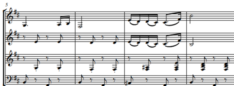
Primjer br. 10 – takt broj 7

U 7. taktu (vidi primjer br.10) brač 2 popunjava harmoniju akordima te pridonosi tome da ritam u skladbi ostane stalan, uz to da čelo uvijek svira basovsku dionicu na prvi dio dobe, a brač 2 nastupa na drugi dio prve i druge dobe u tipičnom vidu pratnje.