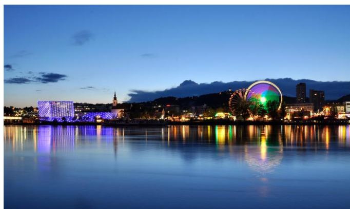
Slika 2: ArsElectronica centar