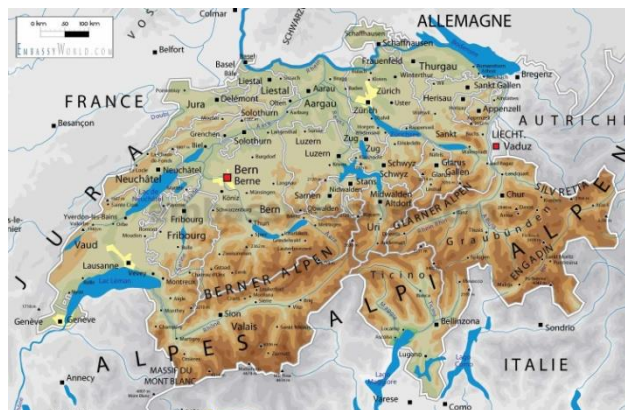
Slika 3: Karta Švicarske

Zemlja je bogata planinama, dolinama te rijekama i jezerima čiji broj prelazi 1 500. Graniči sa pet država, odnosno sa Austrijom i Lihtenštajnom na istočnom djelu, Francuskom na zapadu, sa Njemačkom na sjevernom djelu te sa Italijom na jugu. Kao visokoplaninska zemlja sačinjena je od tri prirodno - geografska djela, a to su Jure na sjeverozapadu, Švicarske visoravni pod nazivom Mittelland u središnjem dijelu te Alpa na južnom i jugoistočnom dijelu. (slika u nastavku)