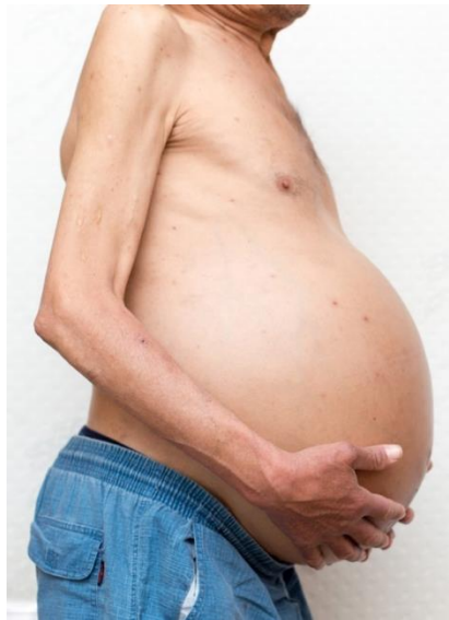
Slika 2. Ascites

Ascites je najčešća komplikacija ciroze jetre, a označava stanje patološkog nakupljanja tekućine u trbušnoj šupljini (Slika 2.). Stvaranje ascitesa u pacijenata s cirozom posljedica je poremećaja portalne i sistemske cirkulacije te poremećaja bubrežne funkcije u čijoj podlozi su promjene patofizioloških mehanizama (Duvnjak i Barišić, 2006).