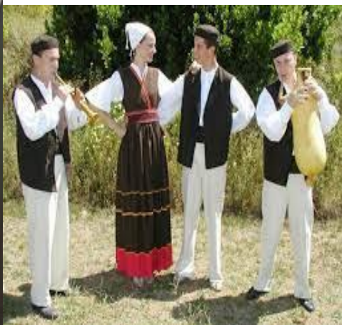
Slika 5. Istarska narodna nošnja 2