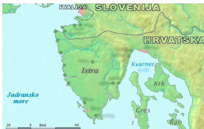
Slika 1. Prikaz Istre 1

Slijedom svih povijesnih događanja koja su se zbivala u Istri, danas se ističu hrvatska i talijanska tradicijska glazba. Istra, zbog svog zemljopisnog položaja istovremeno je odbijala, ali isto tako privlačila pažnju jer su je nastojali pokoriti brojni osvajači. Stoga se nerijetko može reći kako je sva europska povijest svoje stanište pronašla u Istri, kroz međusoban dodir triju europskih civilizacija - romanske, germanske i slavenske.