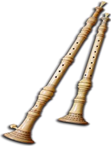
Istarske roženice (sopele)

Profesor objašnjava i pokazuje dijelove roženice : Karakterizira ih dvostruki jezičak odnosno pisak izrađen od trske, špuleta ( valjkasta cijev u koju se sprema pisak), prebiralice ( cijevi prebiraljke sa 6 rupica), lijak ( okrugli završetak svirale). Zatimo puštamo glazbeni primjer za mih uz prethodno zadane zadatke. Prikazujemo mih te objašnjavamo dijelove miha : kozja mješina, puhaljka (kanela), kutla odnosno bačvica te svirale ili kako se to naziva u istri prebiraljke.