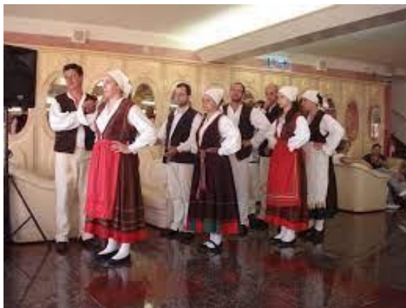
Istarska narodna nošnja

Nakon analize odgovora prelazimo na kratku demonstraciju narodnih nošnji nakon što su učenici primijetili da se balun pleše u narodnoj nošnji.