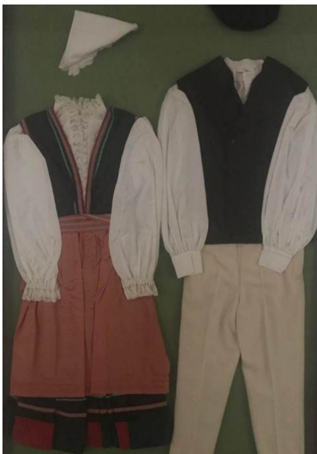
Slika 4. Istarska narodna nošnja 1

Iako se danas većinom oblači za prigode folklor i plesa, nekada je istarska narodna nošnja bila glavni komad odjeće u svakom ormaru za skoro sve prigode, a i za dnevne aktivnosti. Svako selo ili kraj imalo je neki svoj detalj na nošnji, jedan primjer je da u srednjoj istri narodnu nošnju karakterizirala ista boja svih vanjskih (gornjih dijelova) dok u južnoj istri su hlače bile svijetlije boje.