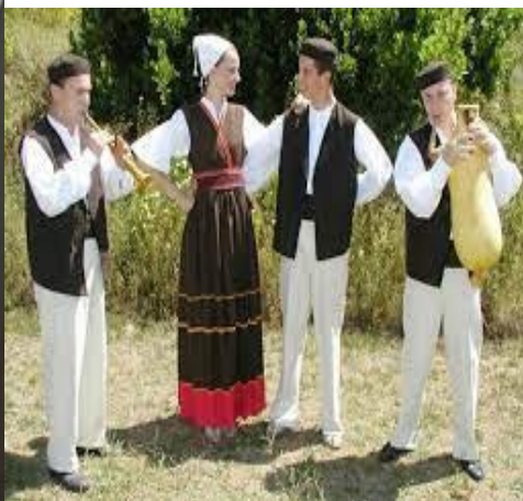
Slika 5. Istarska narodna nošnja 2