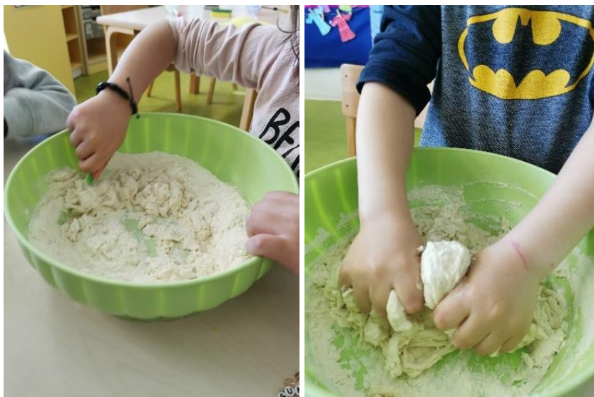
Slika 14. Pripremanje slanog tijesta za oblikovanje