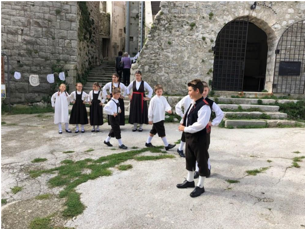
Slika 2. Djeca u narodnim nošnjama na otvaranju kod Plominskih vrata