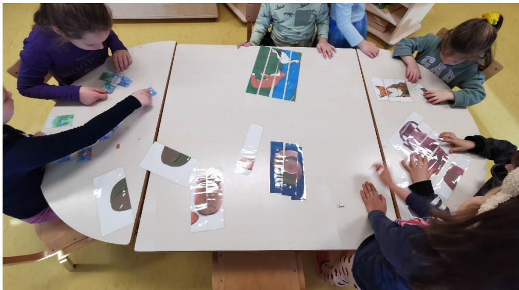
Slika 12. Ponuđeni poticaji po ostalim centrima

Na slici 11 možemo vidjeti postupak dječjeg rada posuđa od gline. Veći broj dječaka bio je zainteresiran za rad glinom dok su se djevojčicama više svidjele ostale aktivnosti ponuđene po centrima (slika 12.). Sva su se djeca držala zadanog zadatka, osim jedne djevojčice koja je od gline radila svoje zamišljene oblike (gusjenica, kolač). Većina djece samostalno je uspjela napraviti glinenu kuglu te im pomoć nije bila potrebna. Prilikom oblikovanja stranica posuđa pomoć im je bila potrebna, a najteži dio bio im je korištenje nožića kojim su zaglađivali spoj ručke i posude.