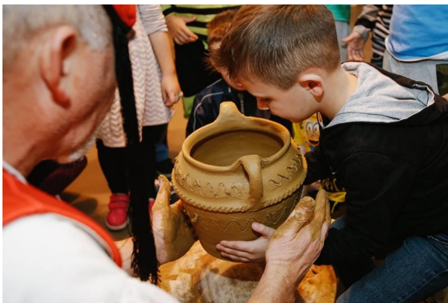
Slika 9. Radionica lončarstva

Već je u prethodnom poglavlju rečeno nešto o glini i lončarstvu, a što se tiče djece, ono je važno jer djeca imaju urođenu želju za dodirom i potrebu da osjete glinu pod prstima, dakle, stvaraju osjetilna iskustva. Glina je materijal koji upravo traži stiskanje, tapkanje, uvijanje i kotrljanje te djeca takvim radnjama razvijaju svoju motoriku. Vizualno je pregledavaju, osjete miris gline, čuju zvukove kada je glina mokra i stvaraju od nje razne oblike i predmete. Upravo je to važno kod djece, dok rade s glinom, vide svoje kreacije, shvaćaju oblik i perspektivu i time upoznaju geometriju. Također uče rješavati problem: gdje smjestiti prozore i vrata na glinenoj kućici ili kako će veći komad gline utjecati na već postojeći, manji dio, hoće li pasti ako je pretežak i slično (Otvoreni, Keramički atelje, 2020).