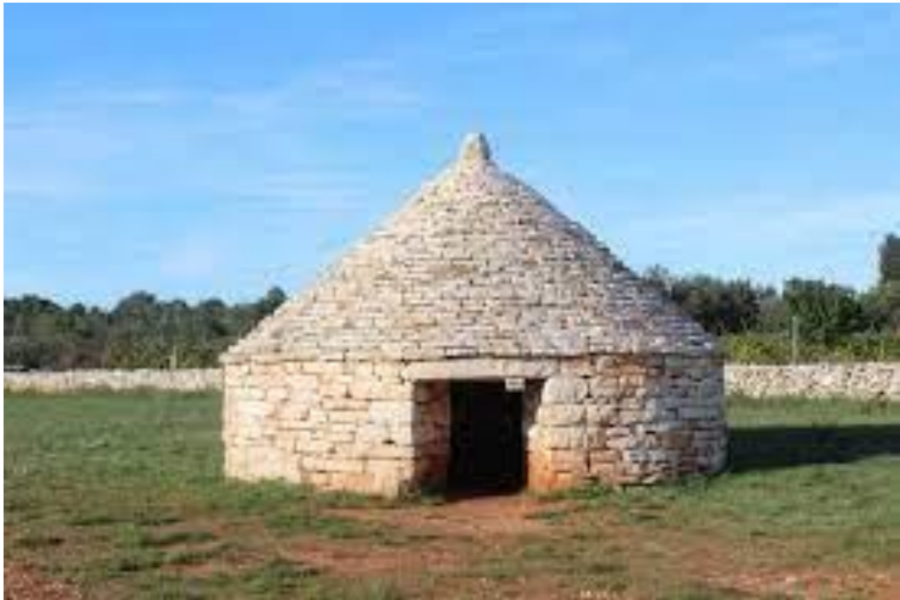
Slika 5. Istarski kažun

Što se tiče zidarstva, Istra je najpoznatija po svojim kažunima. To su kućice kružna tlocrta i specifična kupolasta krova, tradicionalno suhozidno sklonište. Napravljeni su bez korištenja betona ili vezivne žbuke, a služili su kao sklonište od sunca i kiše pastirima i poljodjelicima. Najčešće se nalaze na privatnim posjedima pa ih je nešto teže vidjeti, ali zbog svog izgleda vrlo prepoznatljivi.