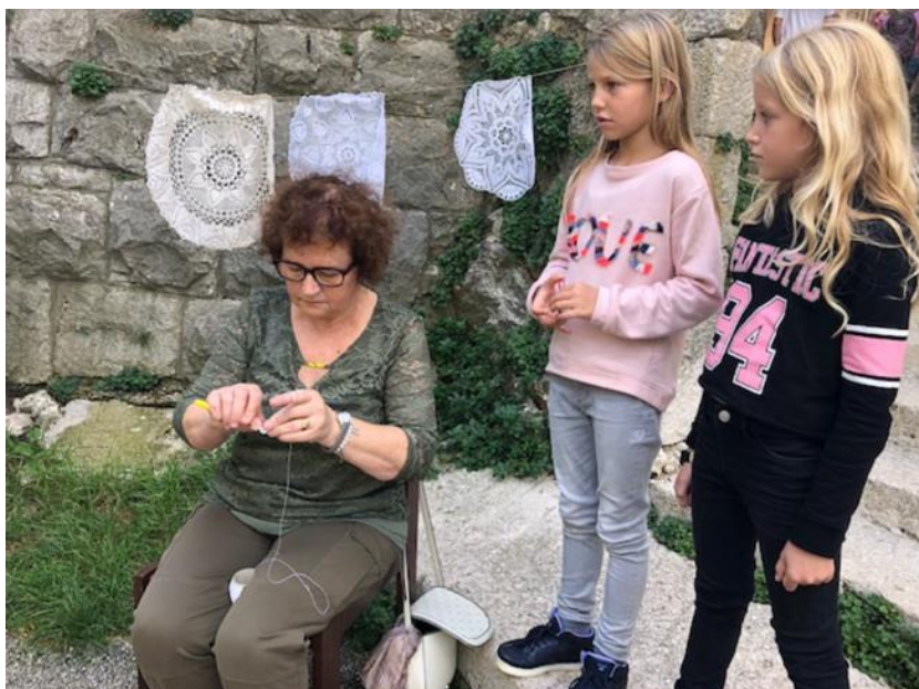
Slika 3. Vezenje čentrina