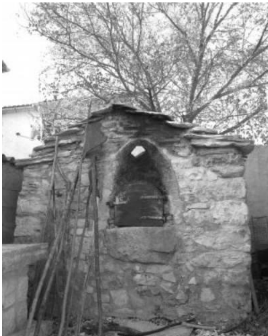
Slika 8. Krušna peć

Izvor: https://www.istrapedia.hr/hr/natuknice/901/krusne-peci