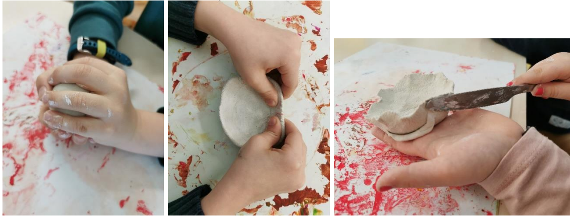
Slika 11. Oblikovanje gline