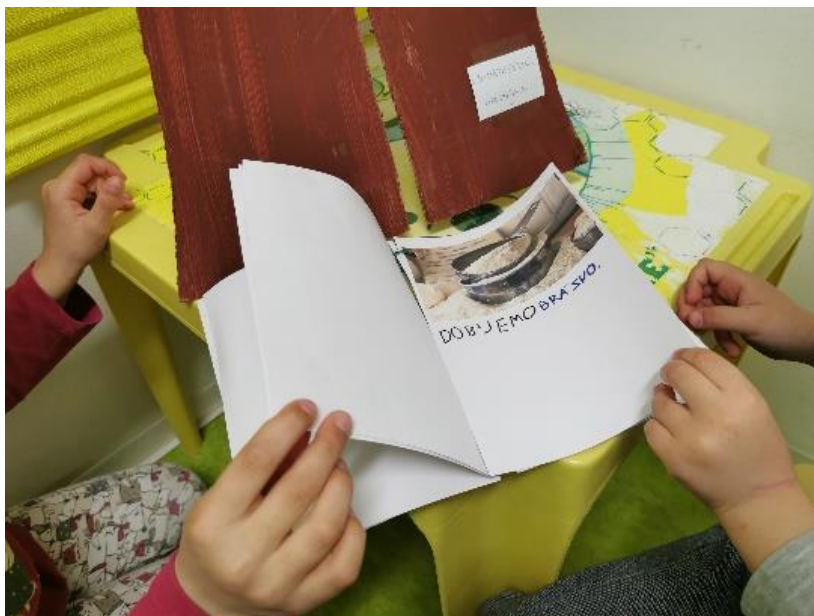
Slika 19. Slikovnica kao razbibriga nakon uspješno provedene aktivnosti

Na slici 19. nalazi se slikovnica koju su na samom kraju djeca listala i razgledavala te su se tada i zasluženo odmarala!