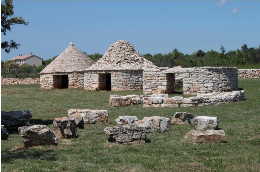
Slika 6. Park kažuna u Istri