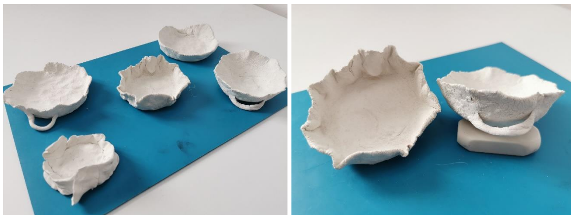
Slika 13. Konačni radovi djece

Ostale aktivnosti (razne slagalice, puzzle , memory ), koje su djeci bile ponuđene po centrima, većinom su se svidjele djevojčicama, što možemo vidjeti i na slici 12. Djeca su u tome bila vrlo vješta te su se poduže zadržala na izrađenim poticajima. Dječak koji im se pridružio ugodno me iznenadio svojim snalaženjem prilikom slaganja slika, brzim zaključivanjem te se jako dobro snalazi kod proporcija određenih dijelova motiva na slikama koje slaže.