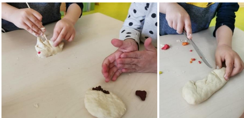
Slika 15. Oblikovanje pekarskih proizvoda

Likovnu aktivnost o temi „Dani kruha“ s vrtičkom skupinom „Medvjedići“ započela sam razgovorom, istraživanjem i čitanjem priče uz neke od fotografija. Najviše im je bilo zabavno istraživanje raznih površina oko sebe, odnosno u prostoriji u kojoj smo boravili. Prilikom glavnog dijela aktivnosti djeca su u pripremljenu posudu dodala sastojke te prvo miješala žlicom, a onda i rukama (slika 14.). Svatko od njih želio je probati umijesiti tijesto, a najviše su se zabavili stiskanjem tijesta kroz prstiće.