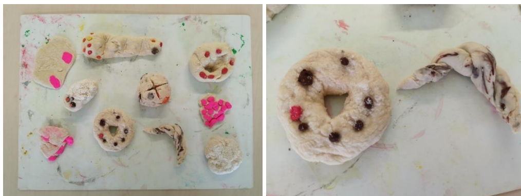
Slika 16. Gotovi radovi djece

Motani kroasan ideja je jednog dječaka koji je želio da njegov kroasan bude s okusima „čokolade i vanilije“ pa je zato ovako šaren i oku vrlo zanimljiv te privlačan na način na koji je rađen, odnosno motan, slično kao pletenica.