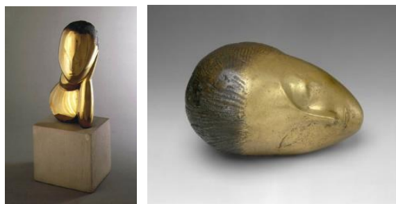
Fotografije pekarskih proizvoda

Nastavno sredstvo – reprodukcija: Constantin Brancusi „Muza“ Izvori: https://www.metmuseum.org/art/collection/search/488458 , http://likovna-kultura.ufzg.unizg.hr/povrsina.htm