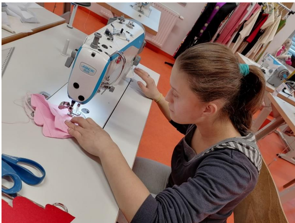
Slika 7. Učenje šivanja