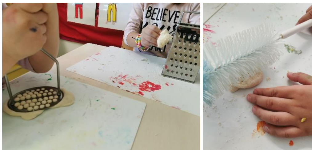
Slika 18. Udubljivanje tijesta posuđem

Djeci se izuzetno svidjelo udubljivanje tijesta raznim posuđem koje im je bilo ponuđeno. Na slici 18. djevojčice su udubile tijesto gnječilicom i ribežom. Također su i hrapavu četku za pranje boca pokušale otisnuti u tijesto da vide što će nastati.