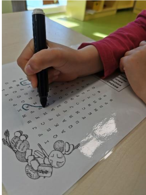
Slika 17. Osmosmjerka