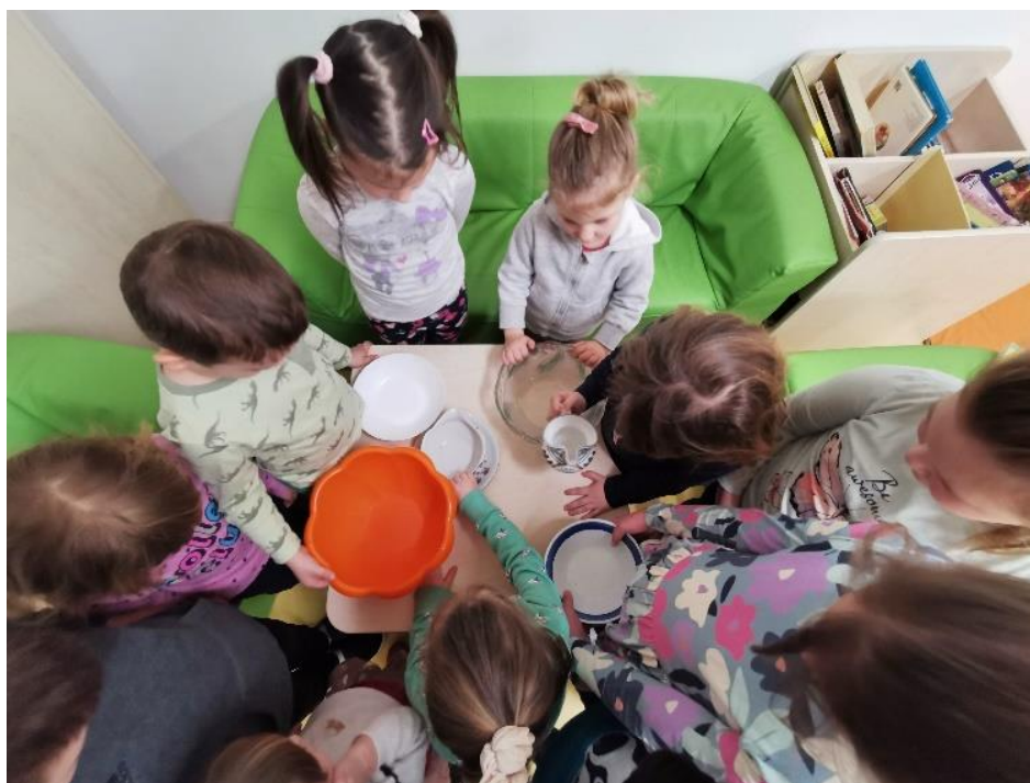
Slika 10. Scenografija