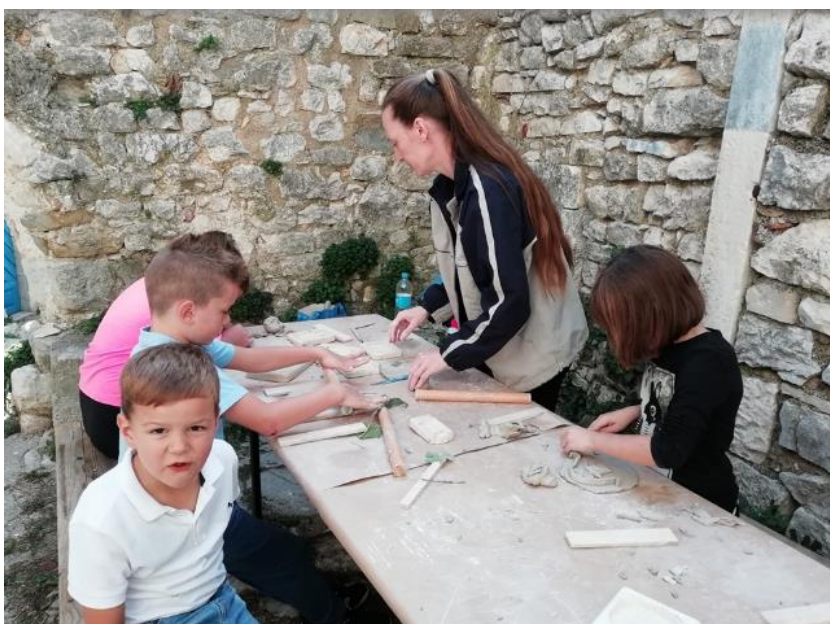
Slika 4. Radionica izrade reljefa u glini