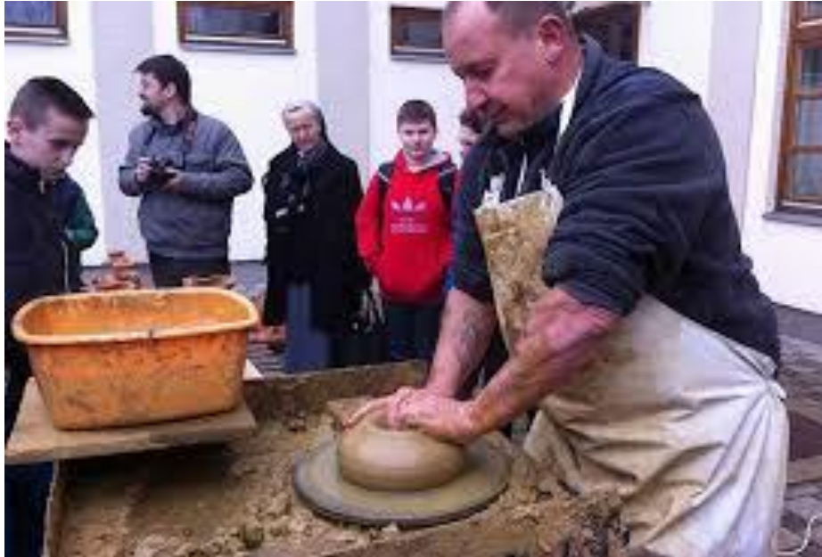
Slika 1. Prikaz izrade posuda od gline