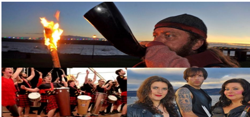
Slika 4: Largs Viking Festival, Sjeverni Ayrshire

niz događaja, uključujući povijesne rekonstrukcije, glazbu, ples i pripovijedanje, koji pomažu oživjeti škotsku vikinšku prošlost. Slaveći škotsku i vikinšku povijest, pomaže u očuvanju i promicanju jedinstvenog kulturnog identiteta Škotske.