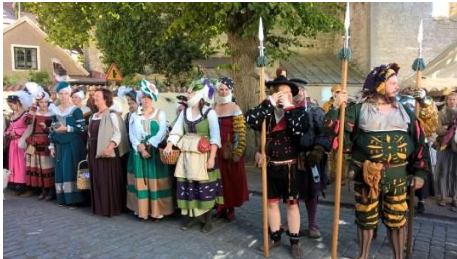
Slika 2: Srednjovjekovni tjedan, Visby, Gotland

kao i na domaće stanovništvo. Slavi srednjovjekovnu baštinu Gotlanda, koji je bio važno trgovačko središte u srednjem vijeku. Vodi posjetitelje na putovanje u prošlost kako bi iskusili prizore, zvukove i okuse srednjovjekovnog života, uključujući viteške turnire, tržnice, glazbu, ples i kazalište. Slaveći srednjovjekovnu baštinu Gotlanda, festival pomaže u očuvanju i promicanju jedinstvenog kulturnog identiteta regije. Vođen je zajednicom koji uključuje ljude svih dobi i podrijetla u slavlje povijesti i kulture. Pruža platformu za lokalne umjetnike, izvođače i povjesničare da pokažu svoje talente i podijele svoje znanje sa zajednicom. Poticanjem osjećaja zajednice i zajedništva, festival pomaže u stvaranju povezanije i angažiranije zajednice koja pruža podršku, otporna je i kulturno bogata.