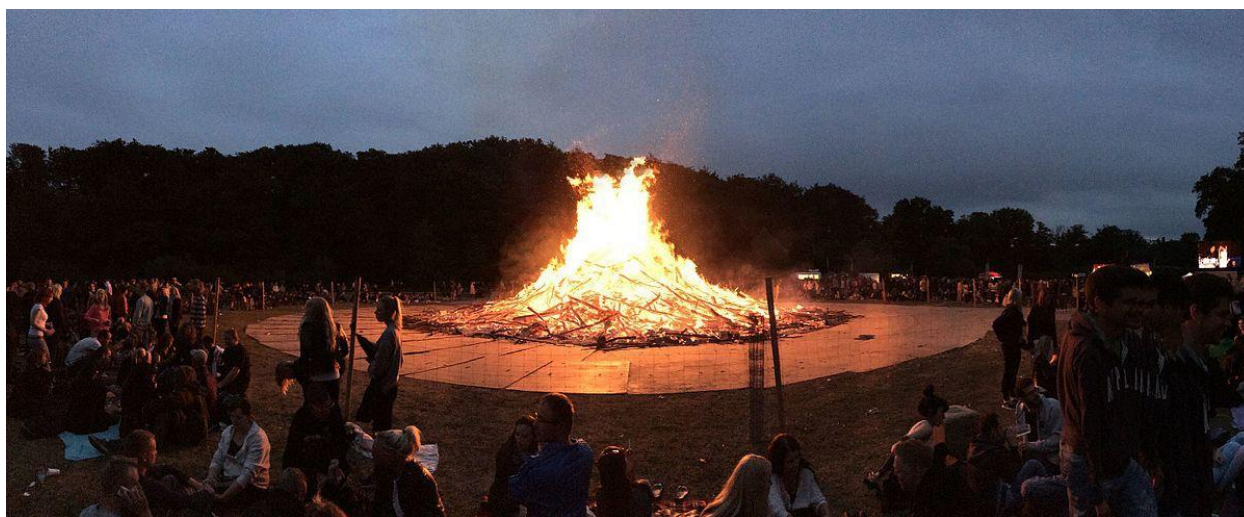
Slika 1: Sankt Hans festival, Skagen, Jutland

16. i 17. stoljeću (Slika 1). Prije paljenja krijesa svira živa glazba (Sankt Hans Festival, 2023). Festival privlači broje domaće i strane turiste. Slaveći danske tradicije, pomaže u očuvanju i promicanju jedinstvenog kulturnog identiteta Danske i povezuje ljude s njihovom poviješću i baštinom. Vođen je zajednicom koji okuplja ljude iz svih sfera života kako bi proslavili, povezali se i zabavili se. Pruža platformu za lokalne umjetnike, glazbenike i izvođače da pokažu svoje talente i povežu se sa zajednicom. Poticanjem osjećaja zajednice i zajedništva, pomaže u stvaranju povezanije i angažiranije zajednice koja pruža podršku, otporna je i kulturno bogata.