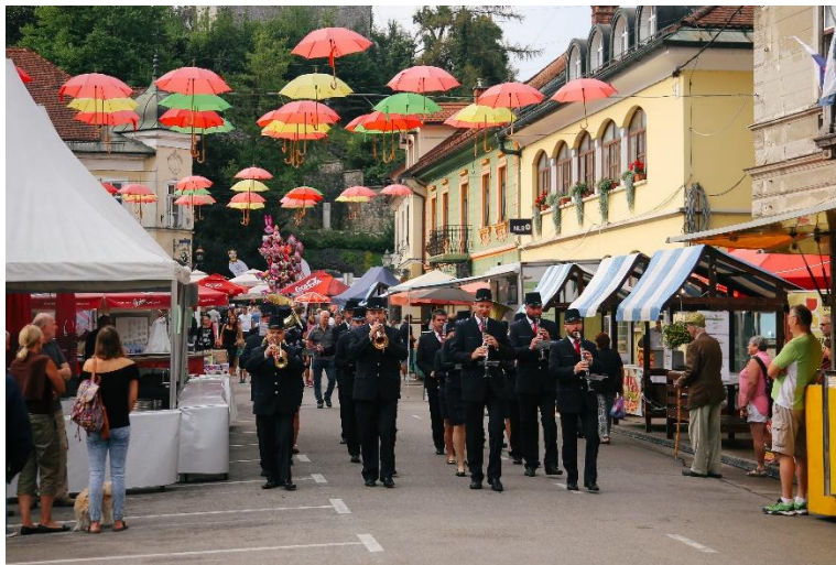
Slika 3: Dnevi Narodnih Noš, Kamnik

u gradu od samo 13.000 stanovnika (Dnevni Narodni Noš, službena stranica, 2023). Festival potiče domaće stanovništvo na sudjelovanje te ekonomsku korist kroz prodaju ručno rađenih radova i domaćih proizvoda. Uključuje izložbe, radionice i predstave koje prikazuju zamršene dizajne, žive boje i kulturni značaj tradicionalne slovenske nošnje. Slaveći slovensku tradicionalnu nošnju, pomaže u očuvanju i promicanju jedinstvenog kulturnog identiteta Slovenije. Festival Dnevi narodnih noš je međunarodni događaj koji okuplja ljude iz različitih zemalja i kulturnih sredina kako bi podijelili svoja znanja, iskustva i tradiciju. Pruža platformu za kulturnu razmjenu i dijalog, pomažući u promicanju međusobnog razumijevanja i poštovanja među ljudima različitih kultura. Poticanjem kulturne razmjene, pomaže u stvaranju raznolikijeg, tolerantnijeg i međusobno povezanog svijeta.