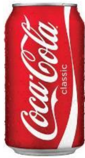
Slika 4. Limenka Coca-Cole s logom