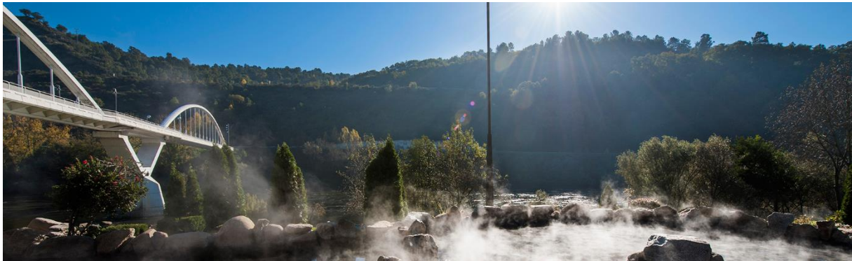
Slika br. 3. Ourense, Španjolska