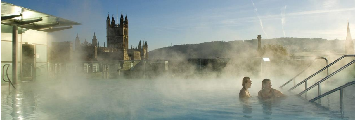
Slika br. 2. Bath, Velika Italija