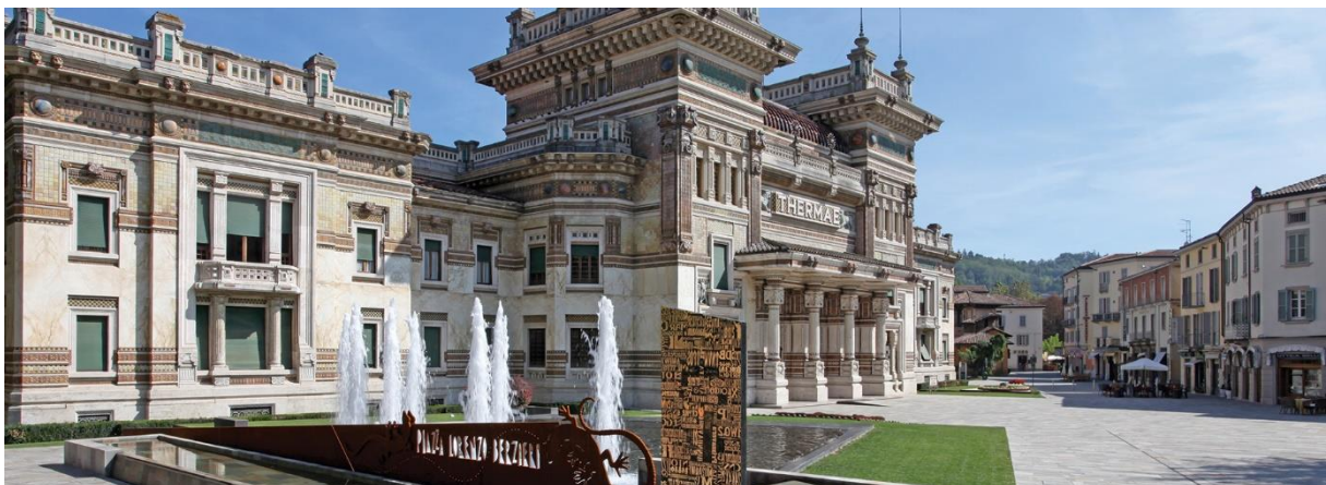
Slika br. 4. Salsomaggiore, Italija