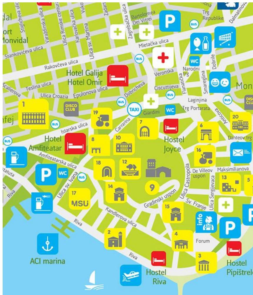
Slika 1. Mapa grada Pule sa kulturnim znamenitostima

Izvor: Turistička zajednica grada Pule, http://www.pulainfo.hr/hr/map/ , (21.05.2016.)