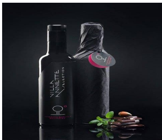
Slika 5. Proizvod Buza delicates