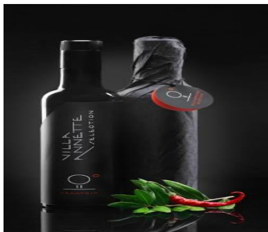
Slika 2. Proizvod Essentia Mediteranea