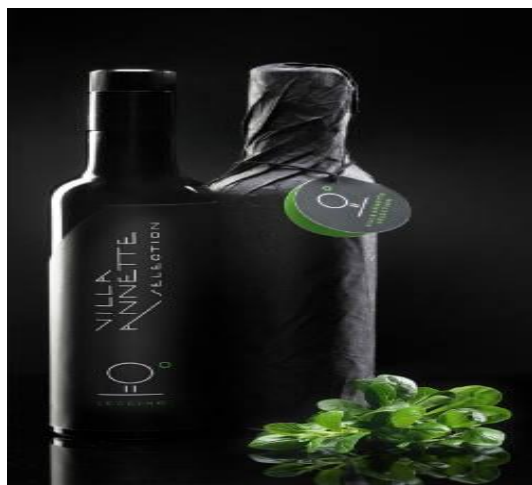
Slika 4: Proizvod Franotio

Izvor: Villa Annette, http://www.villa-annette.com/hr 22.05.2016