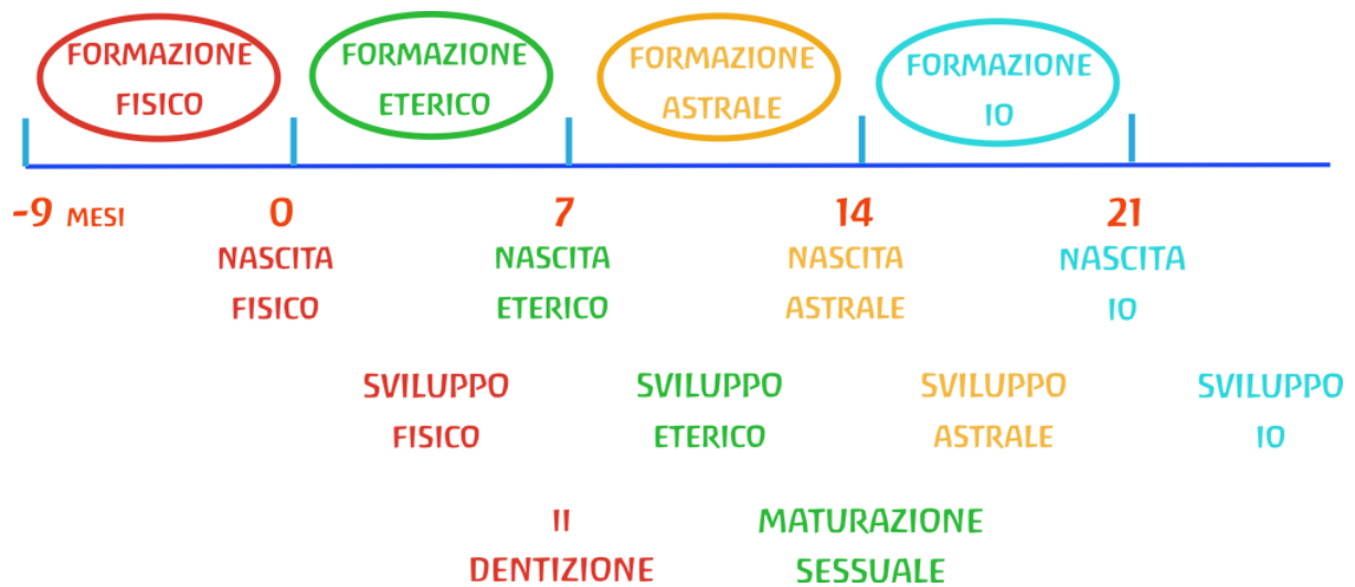
Foto 2. La formazione dell'uomo

Disponibile su: https://www.openyoureye.net/single-post/2017/11/13/i-principi-della-pedagogia-steineriana-iv-parte-sviluppo-in-settenni consultato in data 26 maggio 2023