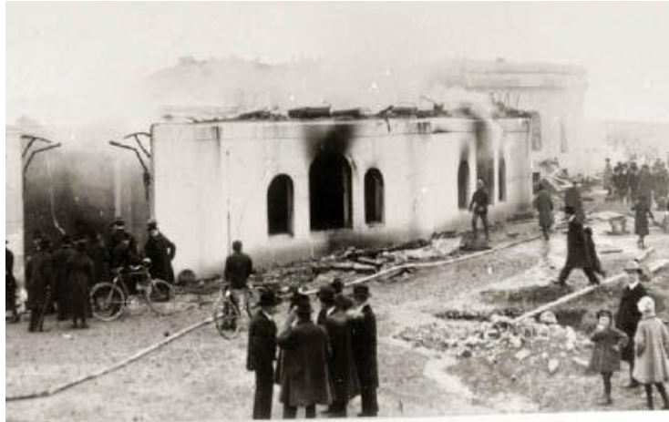
Foto 6. Fiamme al primo Goetheanum

Disponibile su: https://www.pinterest.com/pin/472596554622323566/ consultato in data 26 maggio 2023