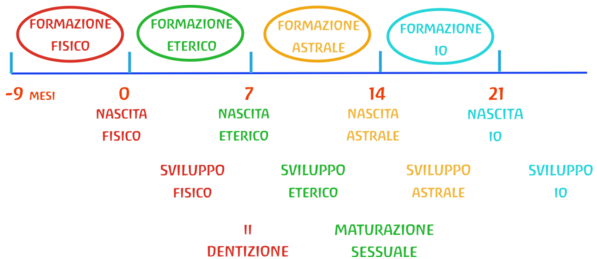
Foto 2. La formazione dell'uomo

Disponibile su: https://www.openyoureye.net/single-post/2017/11/13/i-principi-della-pedagogia-steineriana-iv-parte-sviluppo-in-settenni consultato in data 26 maggio 2023