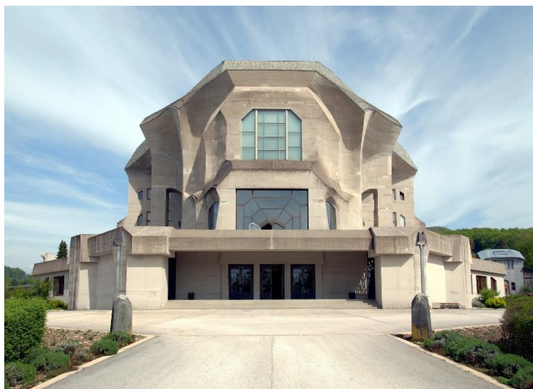
Foto 8. Il secondo Goetheanum

Disponibile su: https://it.wikipedia.org/wiki/Goetheanum consultato in data 26 maggio 2023