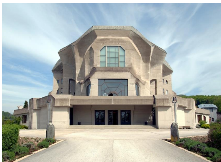
Foto 8. Il secondo Goetheanum

Disponibile su: https://it.wikipedia.org/wiki/Goetheanum consultato in data 26 maggio 2023