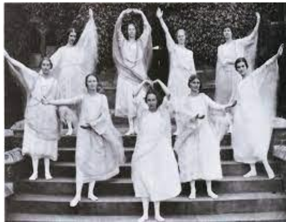
Foto 3. L'euritmia

Disponibile su: http://www.aie91.it/2017/05/07/la-nascita-delleuritmia/ consultato in data 25 giugno