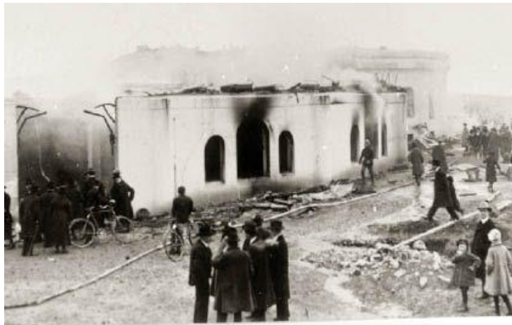
Foto 6. Fiamme al primo Goetheanum

Disponibile su: https://www.pinterest.com/pin/472596554622323566/ consultato in data 26 maggio 2023