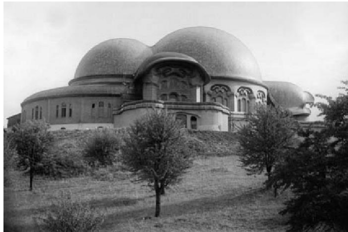
Foto 4. Il primo Goetheanum

Disponibile su: https://www.researchgate.net/figure/Rudolf-Steiner-Goetheanum-I-Dornach-Switzerland-1913-19-Benzinger-C-Rudolf-Steiner_fig9_308091429 consultato in data 23 maggio 2023