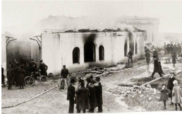
Foto 6. Fiamme al primo Goetheanum

Disponibile su: https://www.pinterest.com/pin/472596554622323566/ consultato in data 26 maggio 2023