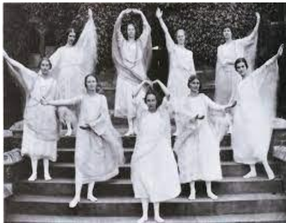
Foto 3. L'euritmia

Disponibile su: http://www.aie91.it/2017/05/07/la-nascita-delleuritmia/ consultato in data 25 giugno