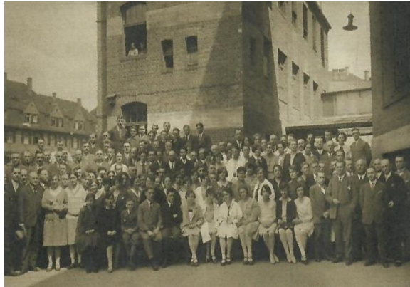
Foto 5. Amici della pedagogia Waldorf

Disponibile su: https://www.parzival-jugendhilfe.de/ueber-uns/waldorfpaedagogik/ consultato in data 14 giugno 2022