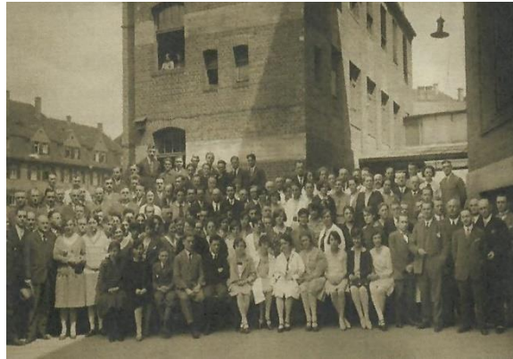
Foto 5. Amici della pedagogia Waldorf

Disponibile su: https://www.parzival-jugendhilfe.de/ueber-uns/waldorfpaedagogik/ consultato in data 14 giugno 2022