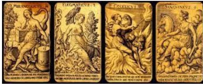
Foto 11. I quattro temperamenti secondo Rudolf Steiner

Disponibile su: https://www.eticamente.net/873/4-temperamenti-psicologici-di-rudolf-steiner.html consultato in data 24 maggio 2023