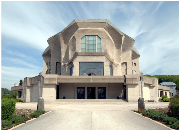
Foto 8. Il secondo Goetheanum

Disponibile su: https://it.wikipedia.org/wiki/Goetheanum consultato in data 26 maggio 2023