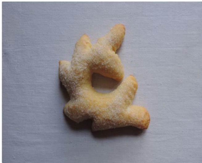
Slika 1. Pazinski cukerančić

Naime, pazinski cukerančić predstavlja prvu istarsku slasticu uvrštenu u popis Hrvatske nematerijalne baštine te je to prvo zaštićeno kulturno dobro iz istarske tradicijske gastronomije. 21