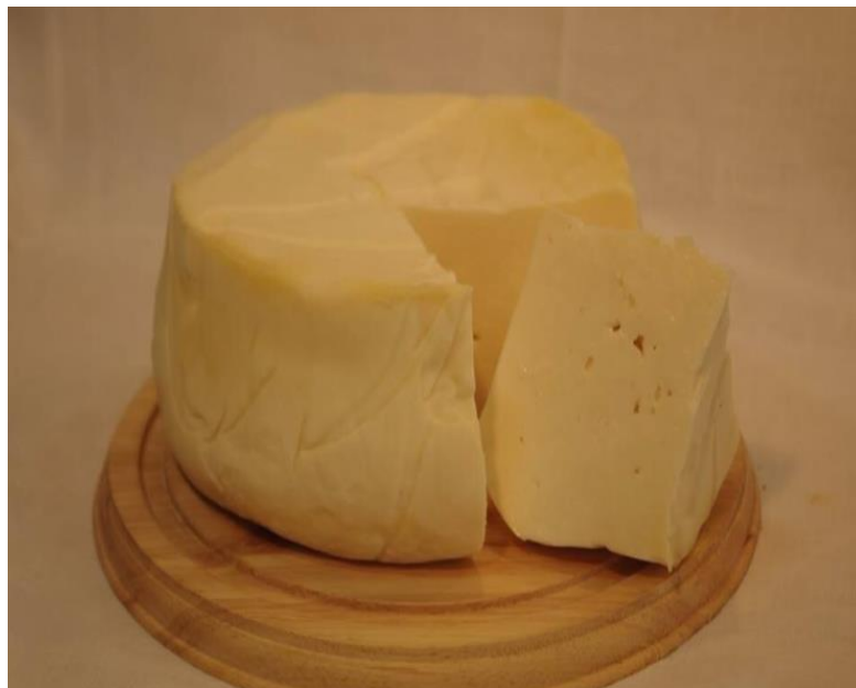
Slika 6. Lički sir škripavac

Međutim, priprema ove vrste sira na primorskoj strani Velebita i Velike Kapele nije toliko poznata, te je ovaj sir najčešće prezentiran kao lički škripavac, iako je njegova priprema zabilježena također u određenim krajevima Gorskoga kotara i Korduna. Naziv škripavac potječe iz specifičnog svojstva ove vrste sira, koji škripi pod zubima dok je mlad. Lički škripavac se tipično priprema od kravljeg mlijeka a iznimno od ovčjeg. U nekim slučajevima su žene miješale kravlje i ovčje mlijeko te na taj način pripremale ovaj sir (sl. 6.). 33