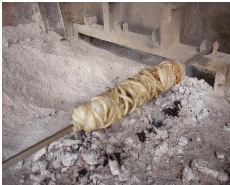
Slika 9. Brački vitalac

Brački vitalac predstavlja tradicijsko jelo koje se priprema od janjećih i kozlećih iznutrica, pri čemu se koristi meso janjca i kozlića koji se hrane majčinim mlijekom i još ne jedu travu. Tijekom pripreme bračkog vitalca se janjeće i kozleće iznutrice, odnosno jetra, slezena i pluća nataknu na tanki ražanj, zatim se mesu doda malo soli i sve se omota tzv. janjećom maramicom . Ražanj se zatim okreće na laganom žaru oko pola sata, nakon čega se omota janjećim crijevima, koja se prethodno ne peru ako se radi o mladom janjcu koji se hranio samo mlijekom (sl. 9.). 42