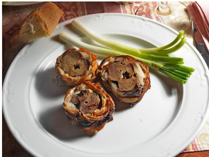
Slika 10. Posluživanje bračkog vitalca

Tribo non: jotra i pluća ol jančića oli kozliča i tuo onega s mlika, onega ča još ni pasa trovu, njegova čriva, zduor, soli i papra po guštu. Čriva se ne peredu nego somo dobro ištrukodu rukuon. Jotra i pluća učinimo u bokune, natakniemo hi na ražnjić, zasolimo i popaprimo po guštu po stavimo peć na žeravu nepristonce vartieć, duoklie guod ni na puol gotovo. Kalomo rožon na bondu, dobro omotomo zduor okolo jotrie pok sve obavijemo črivima, s puomnjuon, da dobrobracki vitalac utakniemo kraje. Nasolimo, vrotimo na žeravu, pečemo i svo vrime vartimo, duokle guod čriva ne ćapodu zlotni kolur. S ražnića skidomo vitalac z dvi fete kruha i tuko da ga izimo tepliega. 44