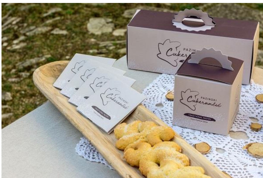
Slika 2. Promotivno pakiranje pazinskog cukerančića

Vrijedi spomenuti kako se grad Pazin i LAG Središnja Istra nadalje zalažu za promociju Pazinskog cukerančića. Naime, 2020. je u Kaštelu Pazin predstavljeno promotivno pakiranje Pazinskog cukerančića, kako bi se promovirala kulturna i gastronomska ponuda središnje Istre te kako bi se doprinijelo brendiranju i jačanju prepoznatljivosti ove slastice kao autentičnog proizvoda s ovog područja (sl. 2). Pakiranje cukerančića osmislila je dizajnerica Tina Erman Popović. Naglasak je stavljen na to da pakiranje bude kvalitetno i prilagodljivo transportu kako bi se očuvao poseban oblik cukerančića. Predstavljene su tri vrste pakiranja: malo pakiranje za jedan cukerančić, srednje za pet cukerančića te veliko za njih 15.