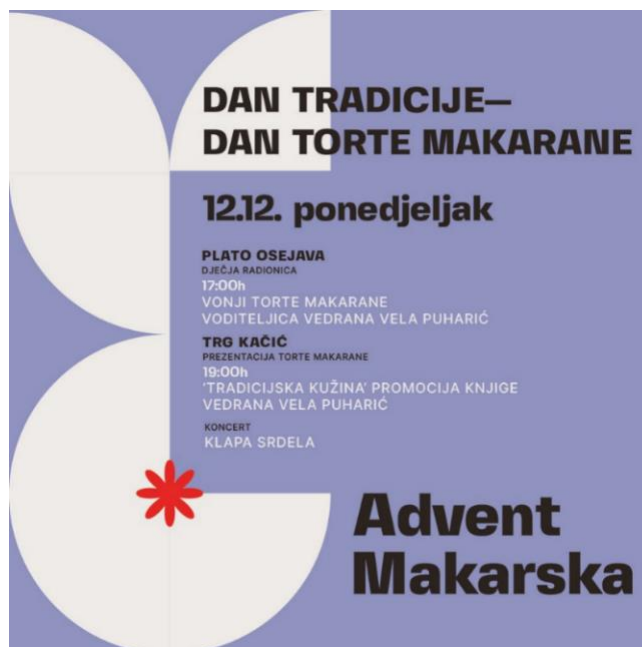
Slika 20. Plakat Dana torte makarane

Očuvanju i promoviranju tradicije pripreme torte makarane uvelike pridonosi manifestacija Dan torte makarane (sl. 20.).