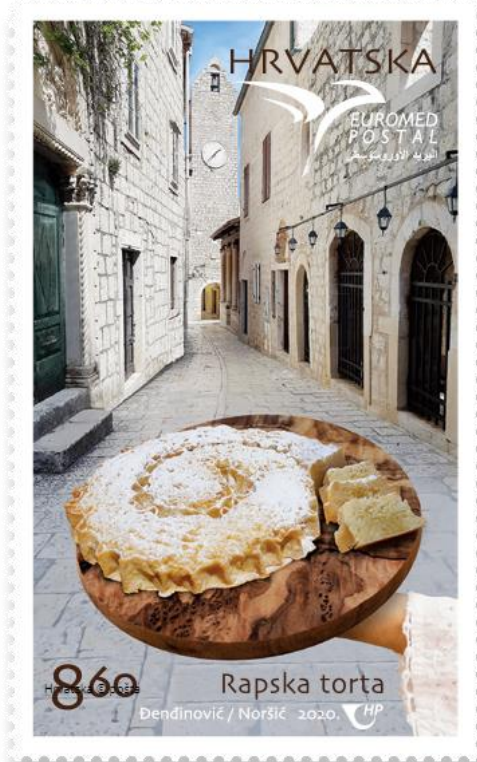
Slika 4. Poštanska marka s motivom rapske torte