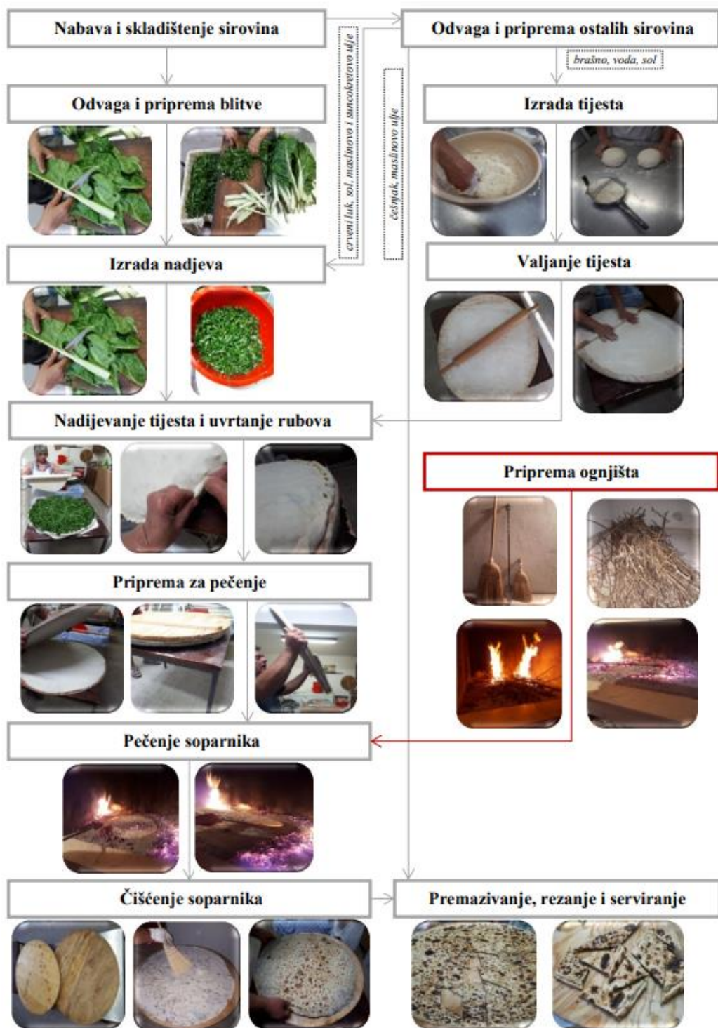
Slika 7. Proces pripreme poljičkog soparnika