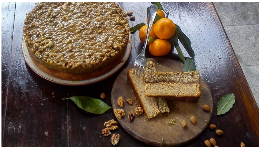
Slika 13. Dolška torta hrapočuša