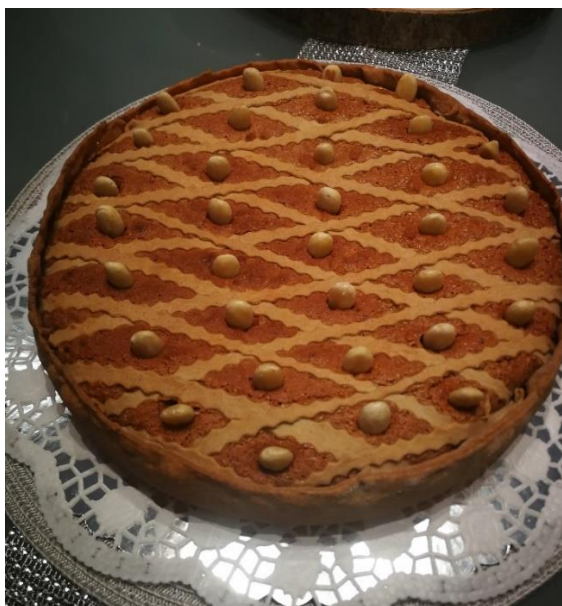
Slika 14. Torta Makarana