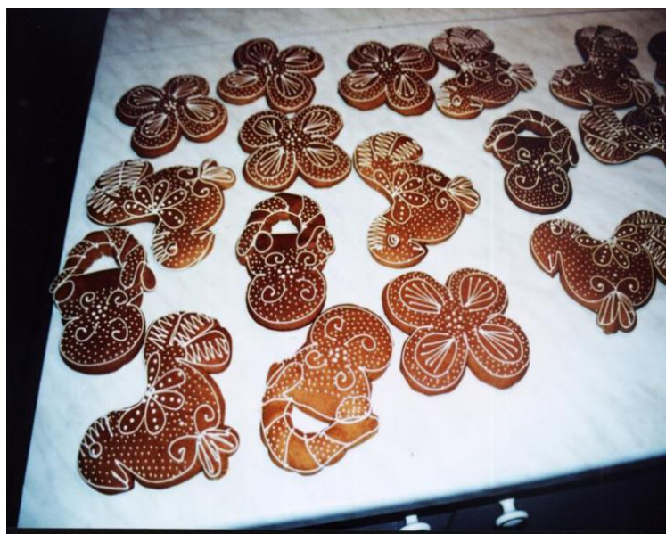
Slika 11. Ukrašeni paprenjok

njezinom obliku se ne slome. Pečeni paprenjaci se obično ukrase tehnikom cukravnja , što obuhvaća pripremu smjese od zamućenog bjelanjka, šećera u prahu i malo limunovog soka. Nakon toga se u smjesu umače glavica od pribadače, zadjenuta za štapić vinove loze, i njome se na paprenjok crtaju crtice i točkice. Modernija tehnika je ukrašavanje s pomoću plastične vrećice s rupicom – stiskanjem vrećice izlazi tanki mlaz smjese 49 (sl. 11.).