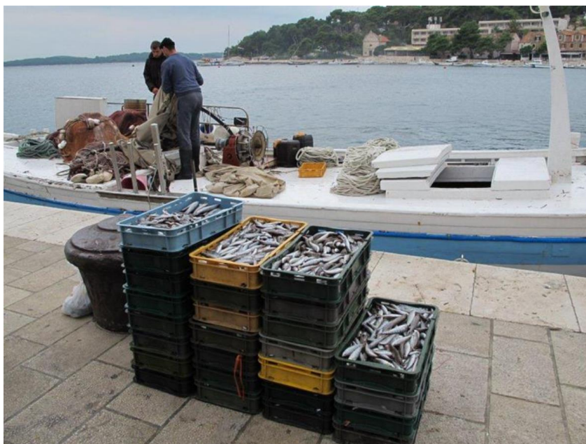
Slika 5. Ribarstvo kao vještina povezana s mediteranskom prehranom