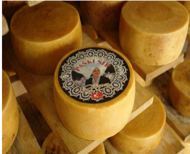
Slika 12. Paški sir

kilogram zrelog sira potrebno je oko 7 litara mlijeka. Paški sir se dijeli na dvije vrste, odnosno mladi i stari sir. Mladi sir sazrijeva pet mjeseci, a stari sir oko godinu dana ili više. 52