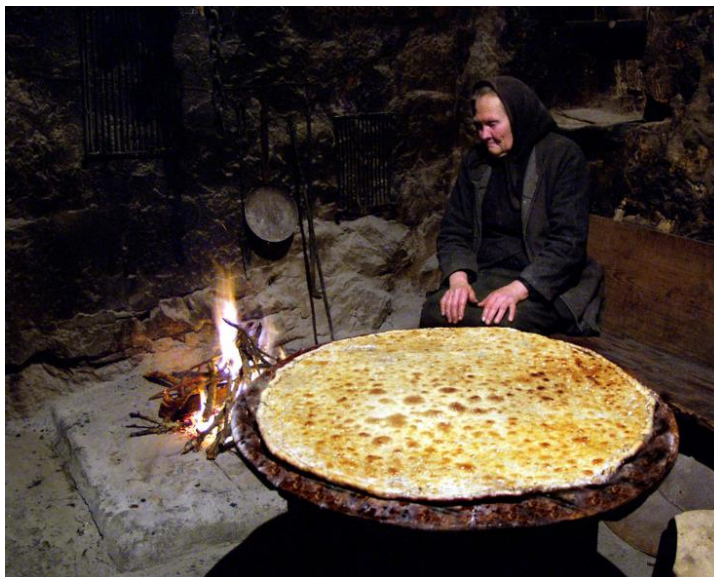
Slika 8. Ispečeni soparnik

izobličići. 37 Soparnik je okruglog oblika i promjer varira između 90 do 110 centimetara. Ispečeni soparnik se maže maslinovim uljem i češnjakom, i reže se na komade romboidnog oblika (sl 8.). 38