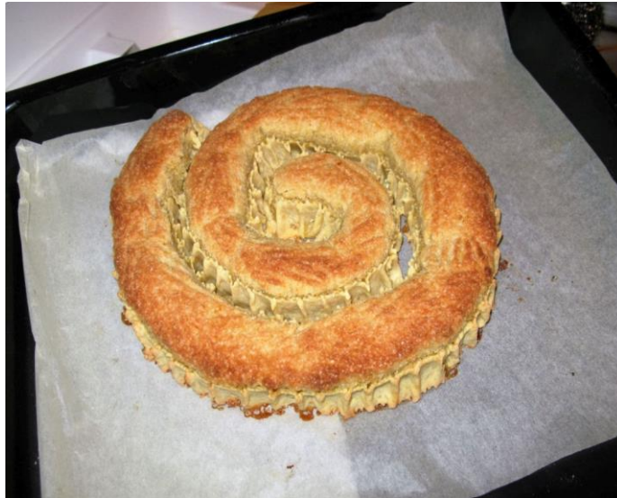
Slika 3. Rapska torta

povezana s drugim tradicijskim slasticama koje se na području Mediterana izrađuju već od XVIII. st. 24