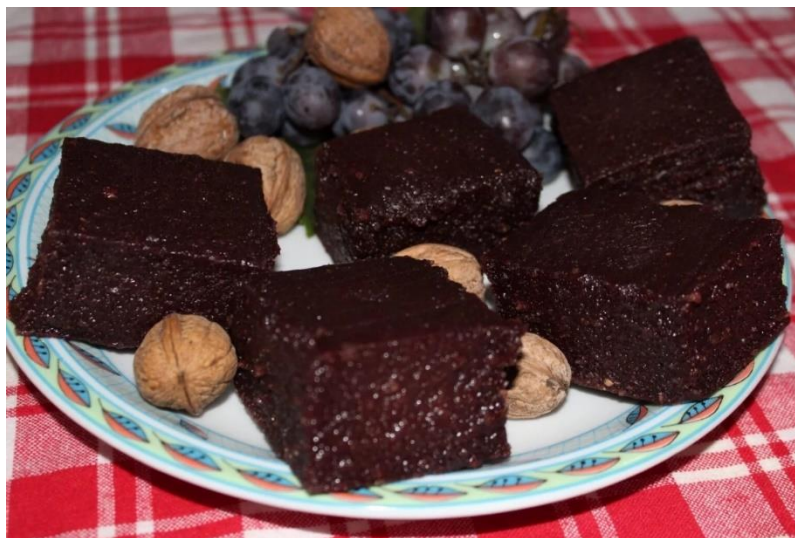
Slika 15. Kumpet ili ćufter

Narežemo orahe, bajame, bačić, suhe smokve, dodamo mirodije (kanele, muškatni oraščić, vanilin šećer). Sve zajedno još nekoliko minuta miješamo na vatri i izlijemo u kalupe ili roštjeru u koju smo stavili mokru kanavacu. Ostavimo da se suši nekoliko dana, a onda okrenemo i pustimo isto toliko sušiti drugu stranu, zatim narežemo i poslužimo na listovima vinove loze. 67