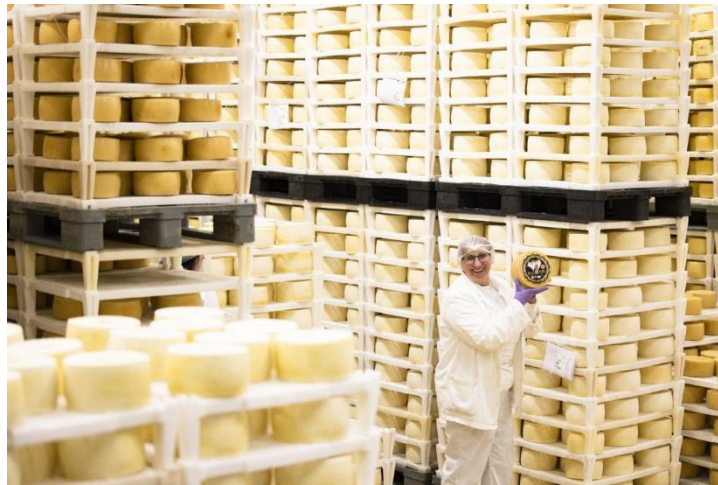
Slika 21. Zrionica u sirani Gligora

mogućnost degustacije proizvoda u kušaonici, kao i mogućnost kupnje proizvoda. Cijena ulaznice za obilazak je deset eura za odrasle, a pet eura za djecu. 97