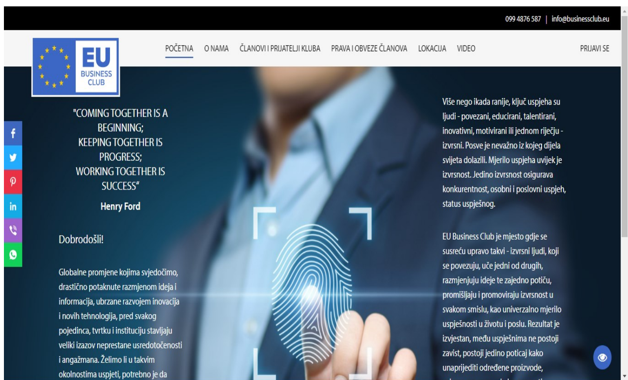
Slika 4. Web stranica Crowdfunding.hra