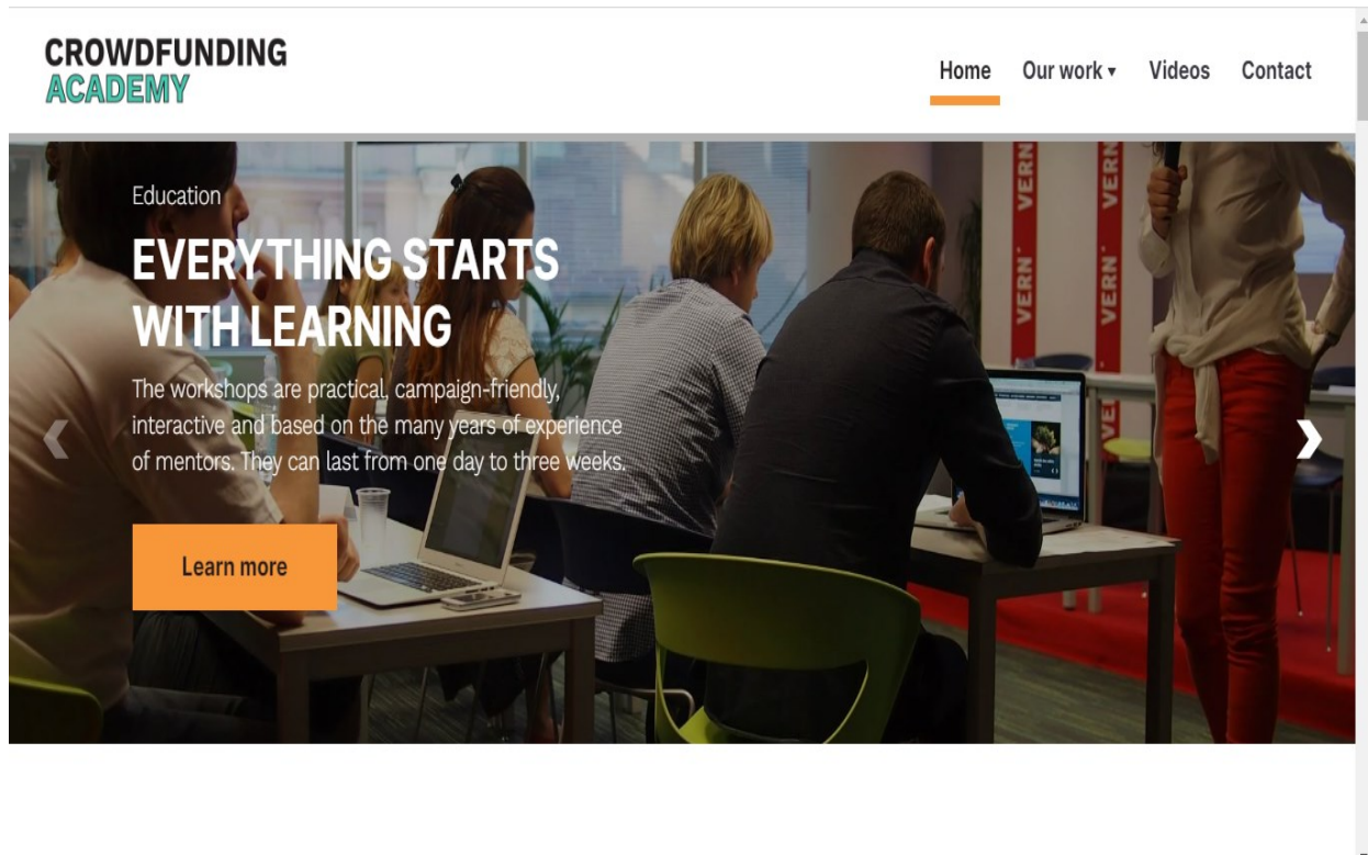
Slika 5. Web stranica Crowdfundingacademy.eua