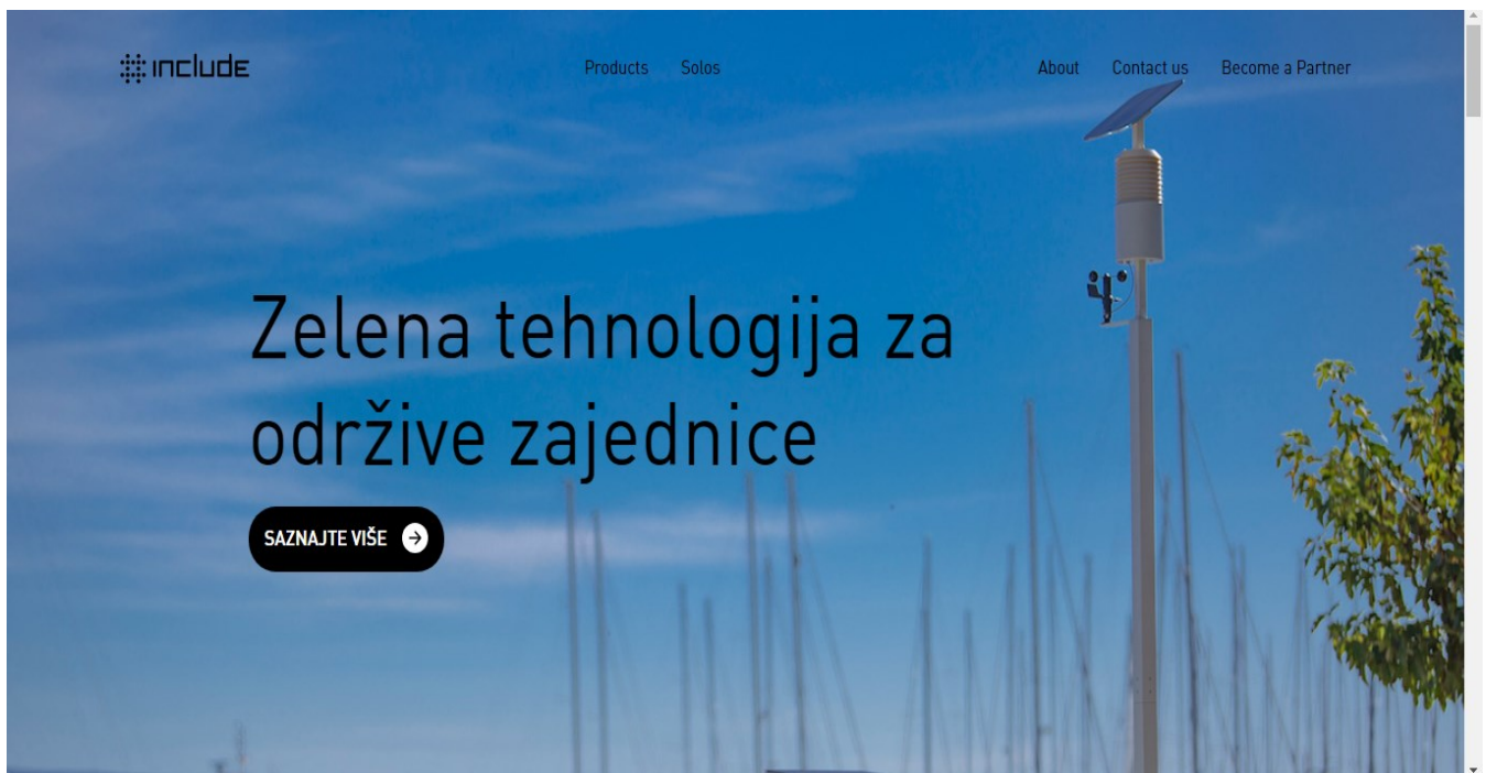
Slika 8. Web stranica Includea