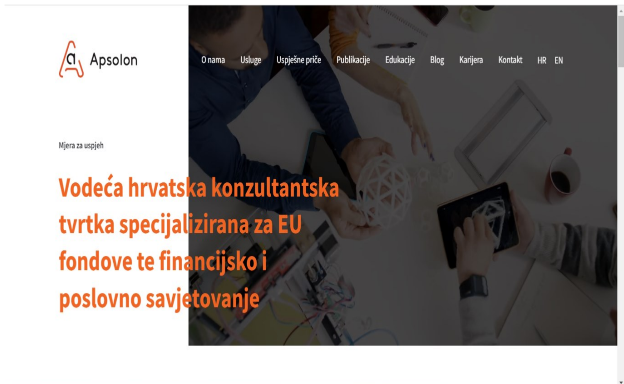
Slika 9. Web stranica Apsolona