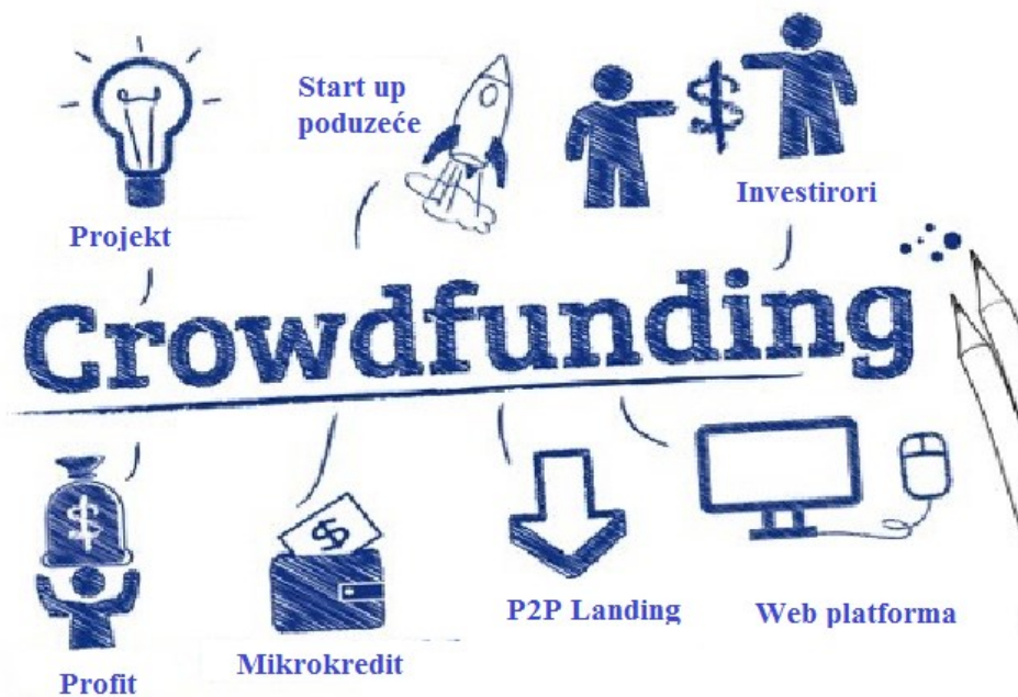
Slika 1. Proces skupnog financiranja