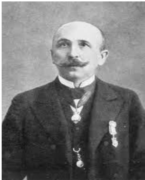
Slika 1. Jan Nepomuk Vlašimsky 2

Prema riječima autora knjige „Jan Nepomuk Vlašimsky“ Vjenceslava Herouta (2016), Jan Vlašimsky okarakteriziran je kao dirigent, zborovođa, kapelnik, skladatelj i aranžer te glazbeni pedagog i kulturni djelatnik koji je 50 godina neumorno vodio i razvijao glazbenu kulturu u Virovitici te je s razlogom virovitička glazbena legenda.