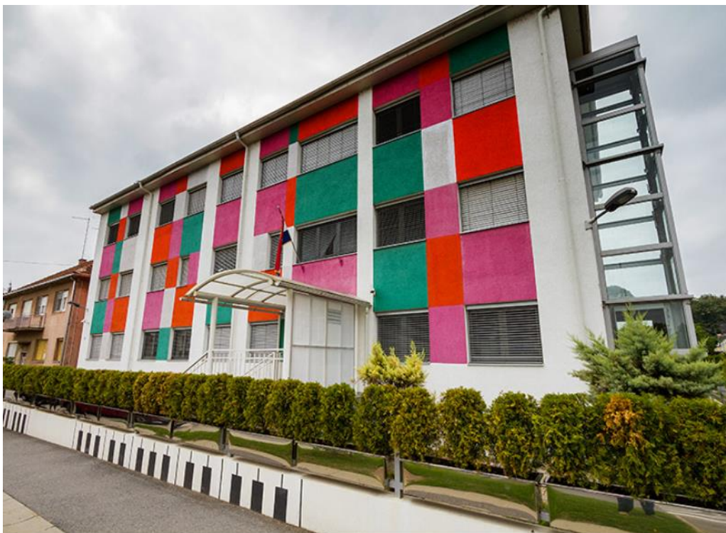
Slika 9. Glazbena škola Jan Vlašimsky danas 9

Glazbena škola Jan Vlašimsky Virovitica, samostalna je umjetnička škola koja provodi predškolsko, osnovnoškolsko i srednjoškolsko glazbeno obrazovanje. Škola je osnovana 1886. godine, a ime je dobila 1991. godine po svom prvom voditelju, učitelju, svestranom glazbeniku i pedagogu koji je pedeset godina bio nositelj glazbenog života Virovitice – Janu Vlašimskom iz Češke. Škola ima područnu školu u Pitomači koja je počela s radom 15. listopada 2007. godine i dislocirani odjel u Suhopolju.