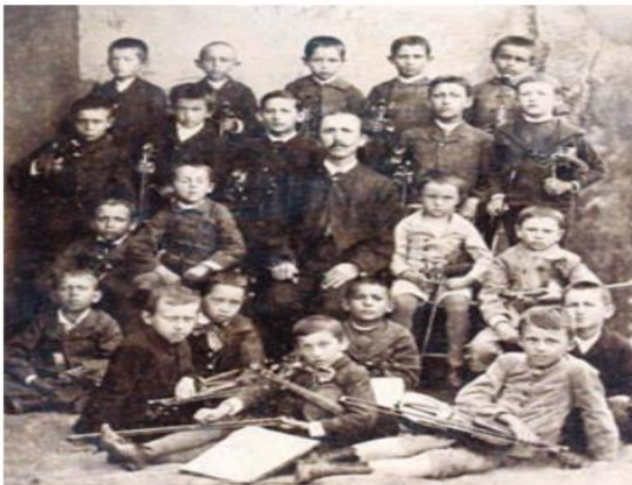
Slika 4: Društvo za promicanje glazbe 5