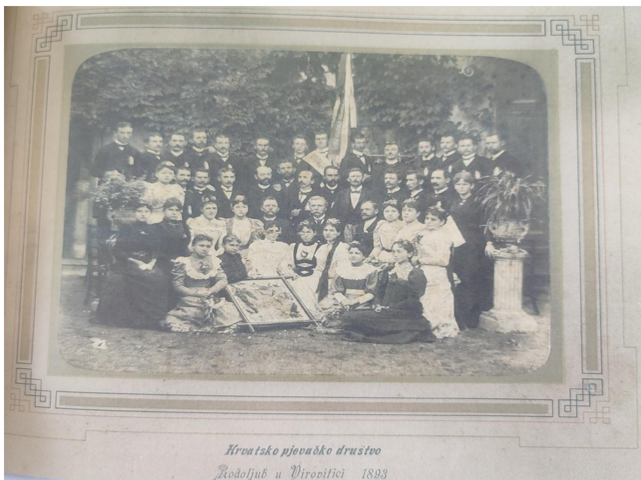
Slika 5. HPD Rodoljub u Virovitici 1893.godine-na poledini potpis J. Vlašimsky, zborovođa 7