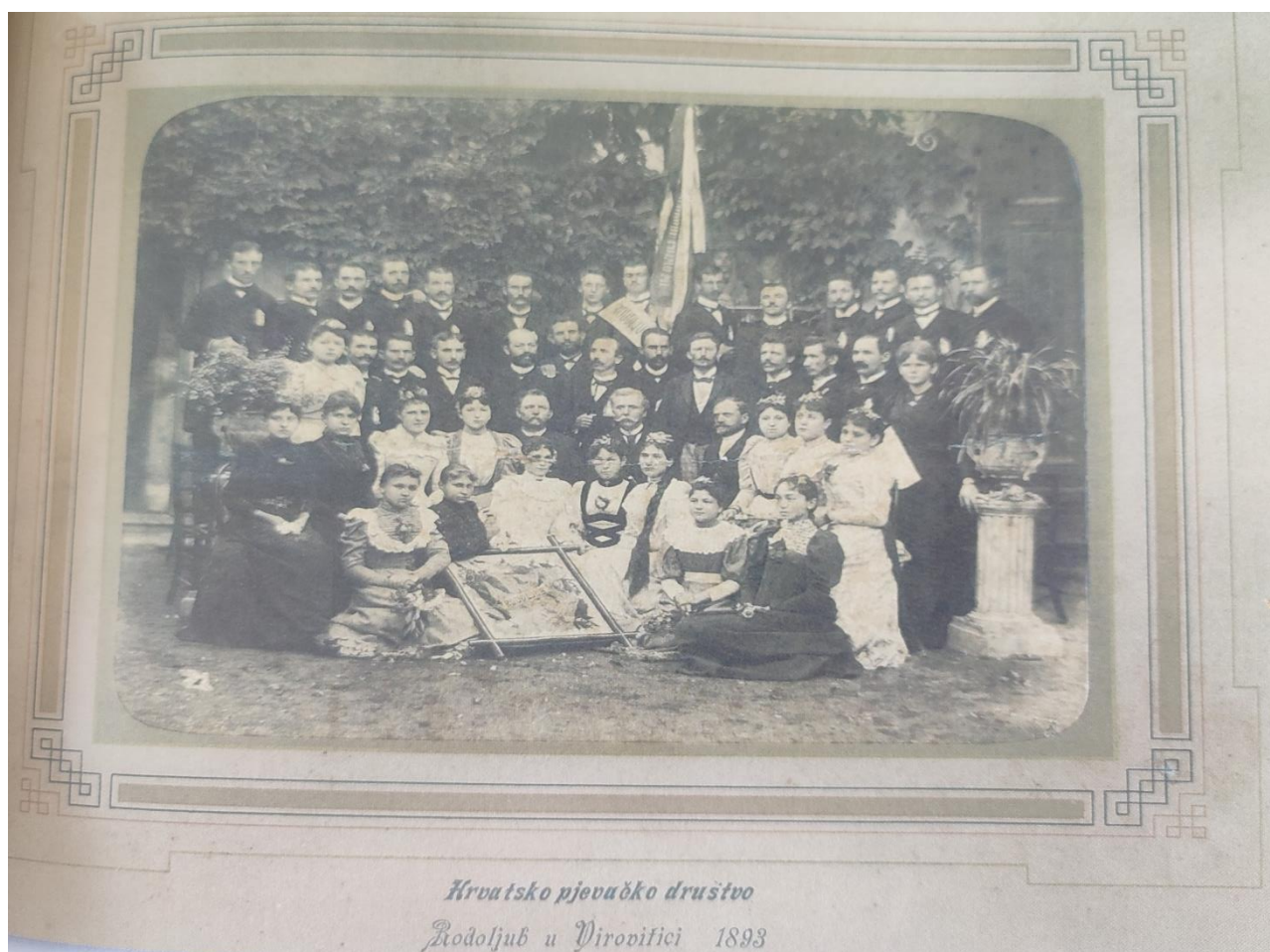
Slika 5. HPD Rodoljub u Virovitici 1893.godine-na poledini potpis J. Vlašimsky, zborovođa 7