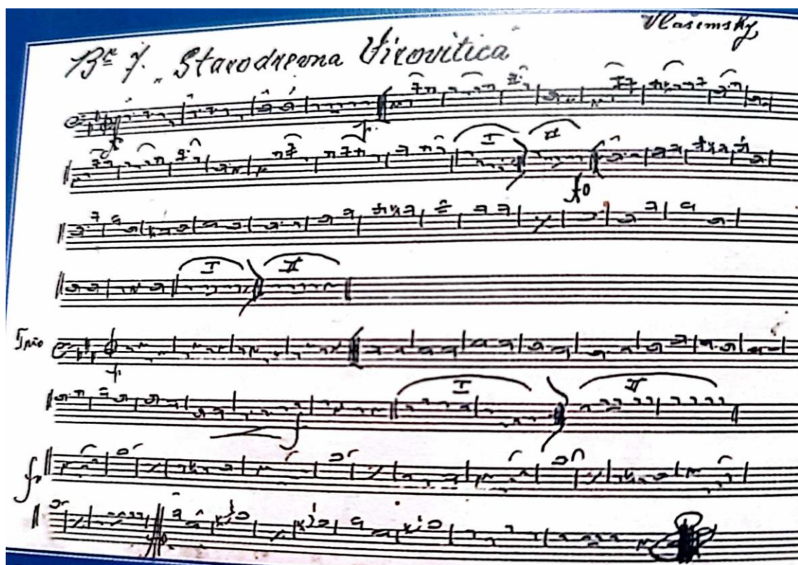
Slika 6. Iz pjesmarice Društva za promicanje glazbe „Flugelhorn 2 B“ (1920.godina)