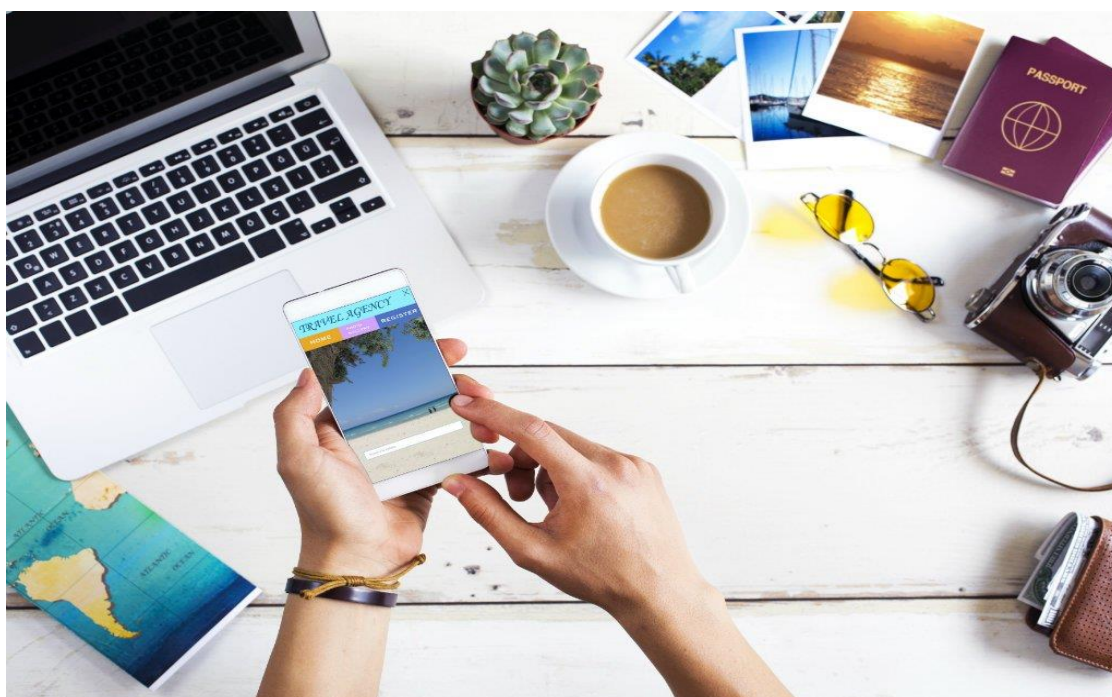
Slika 2. Digitalna transformacija u turizmu