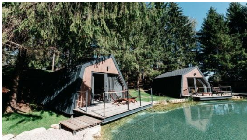
Slika 4. Nacionalni park Plitvička Jezera