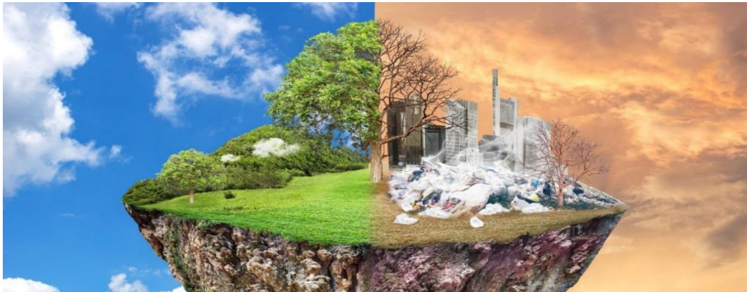
Slika 5. Različite vrste zagađenja