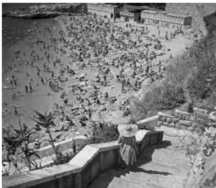
Slika 3. Povijesne slike Dubrovnika