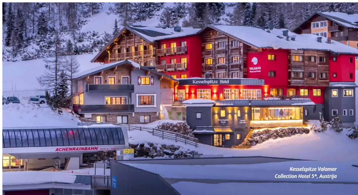
Slika 8. Kesselspitze ValamarCollection Hotel 5*, Austrija