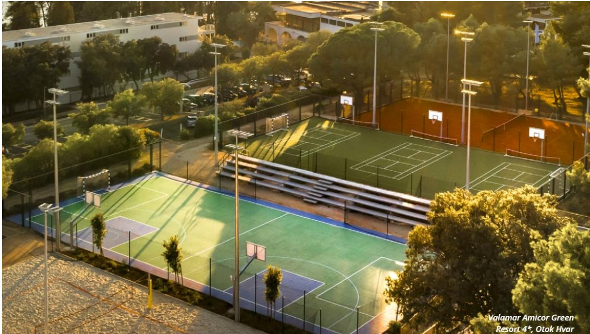
Slika 9. Valamar Amicor Green Resort 4*, Otok Hvar