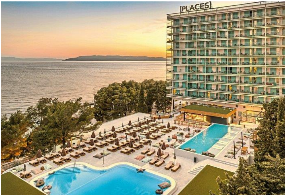
Slika 7. Valamarov hotel ,Dalmacija [PLACESHOTEL]